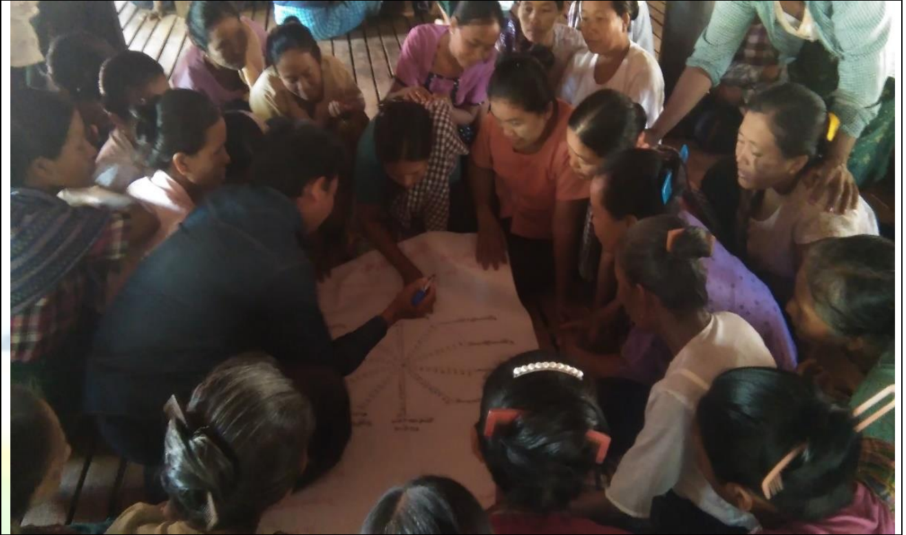
အမျိုးသမီးများပင့်ကူအိမ်ကွန်ယက်ရေးဆွဲနေစဉ် မှတ်တမ်းဓာတ်ပုံ