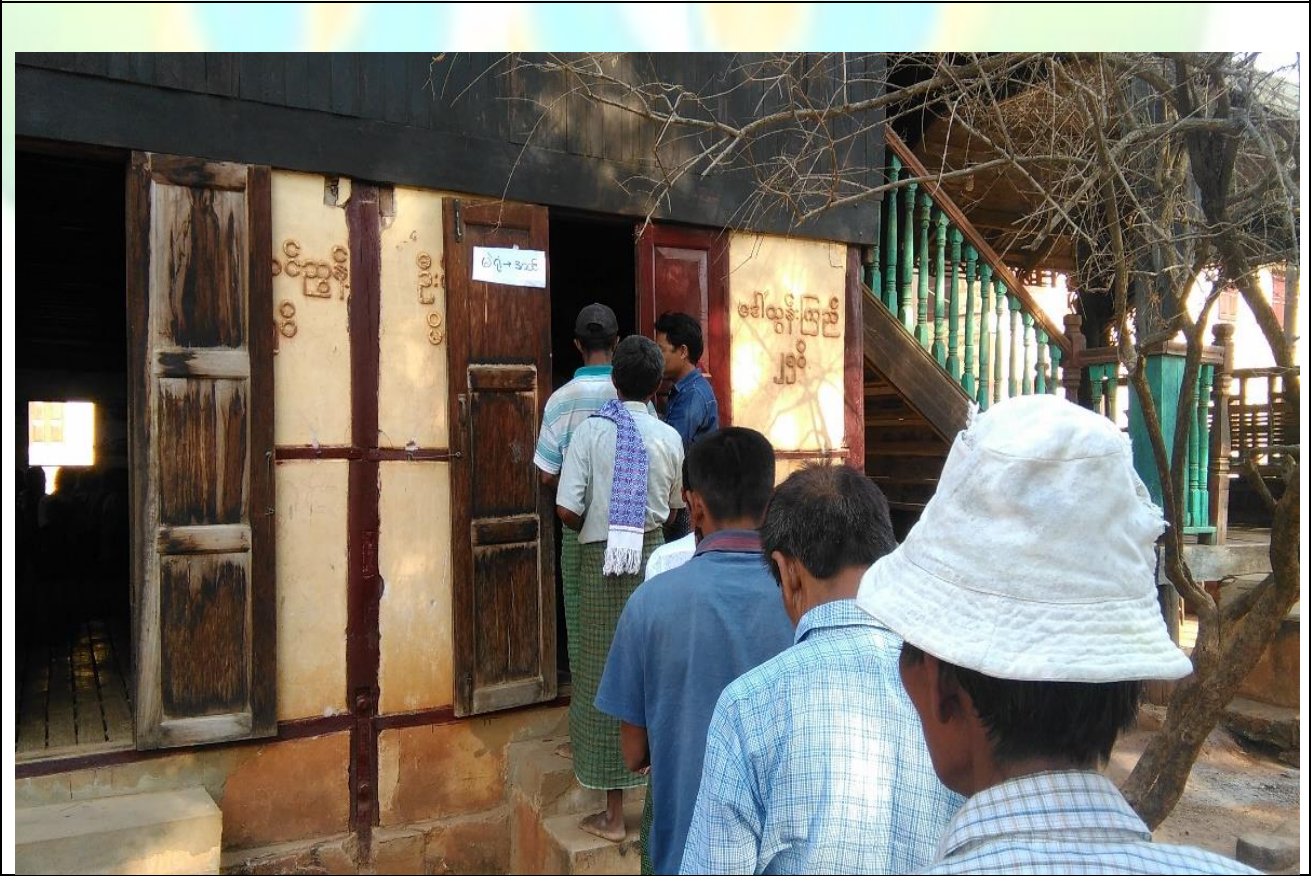
ကျေးရွာဖွံ့ဖြိုးရေးဦးစားပေးမဲပေးရန်တန်းစီနေကြစဉ်