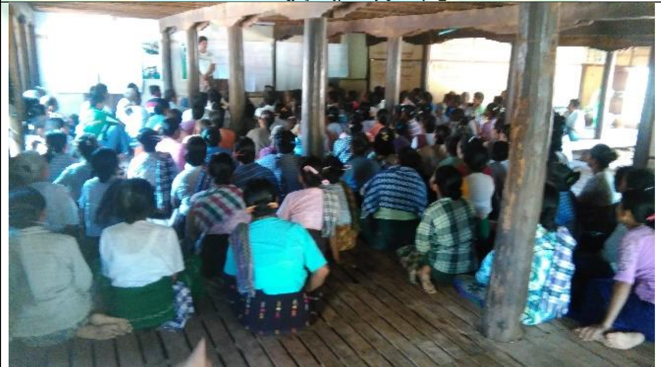
စီမံကိန်းမိတ်ဆက်အစည်းအဝေး မှတ်တမ်းခါတ်ပုံ