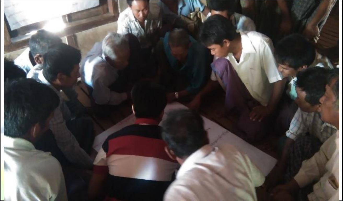
ကျေးရွာလုပ်ငန်းခွဲအတွက်အခက်အခဲများဖော်ထုတ်ဆွေးနွေးစဉ်