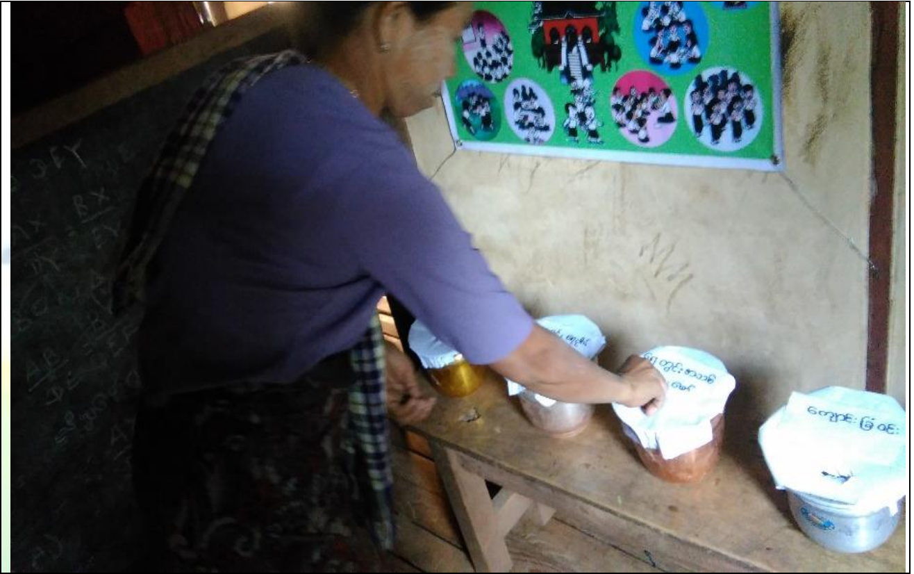
ကော်မတီရွေးချယ်ရန် မဲရေတွက်နေစဉ်