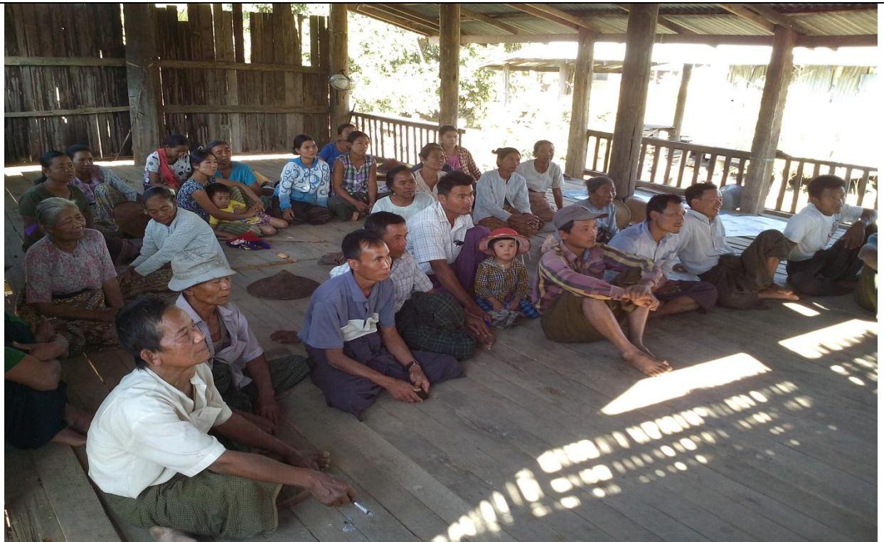
စေတနာ့ဝန်ထမ်းရွေးချယ်ခြင်း မှတ်တမ်းဓါတ်ပုံ