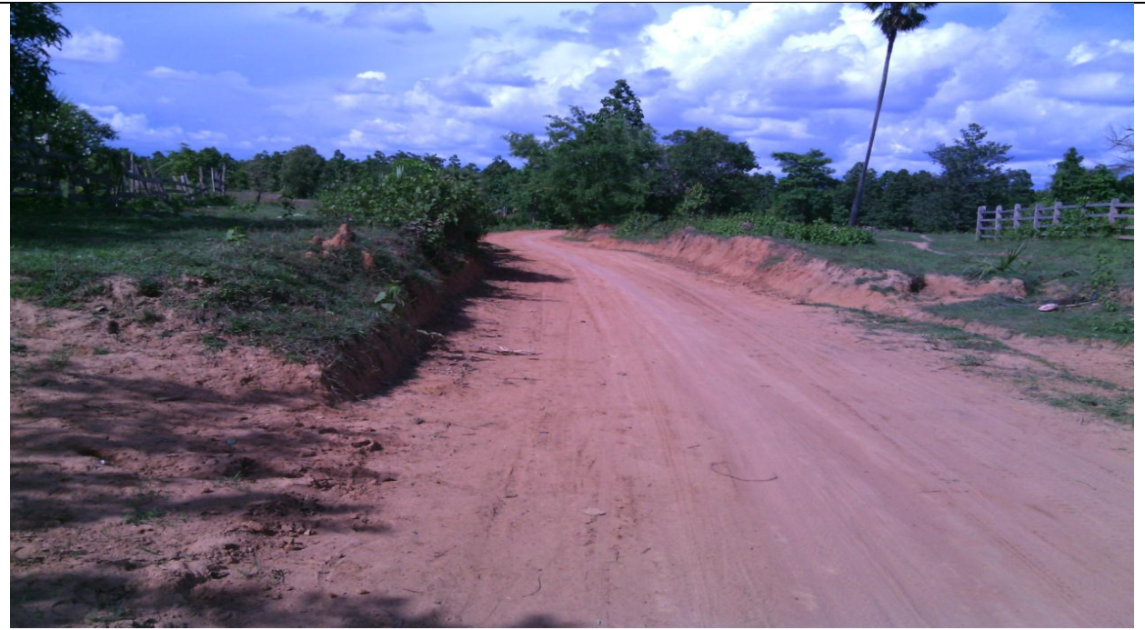
ပထမနှစ်မိကိန်းလုပ်ငန်းခွဲဆောင်ရွက်ပြီး မှတ်တမ်းဓာတ်ပုံ