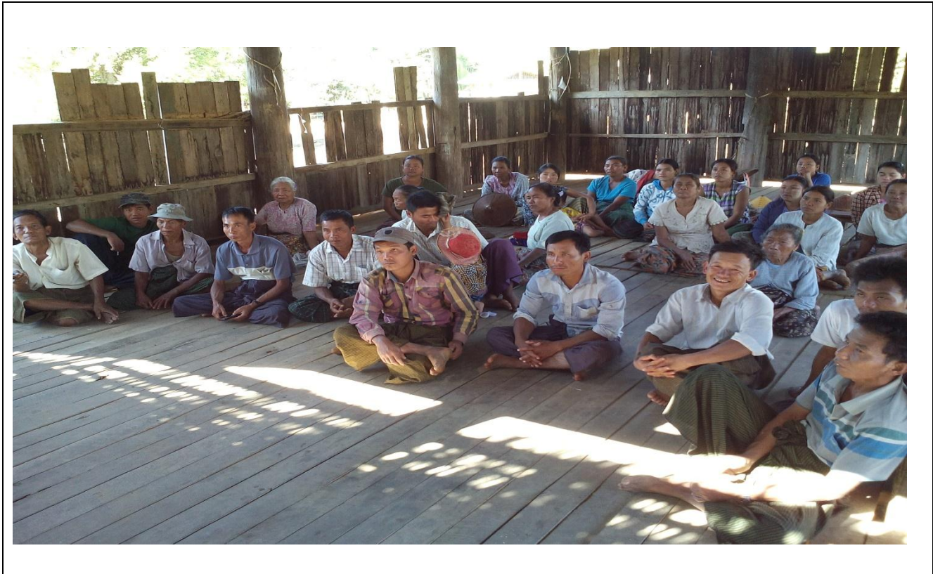
ကော်မတီဖွဲ့စည်းခြင်းမှတ်တမ်းဓာတ်ပုံ