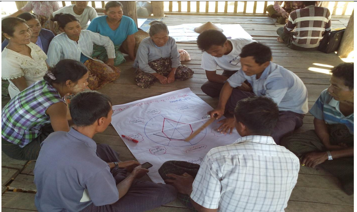
လူငယ်အုပ်စု မှတ်တမ်းခါတ်ပုံ