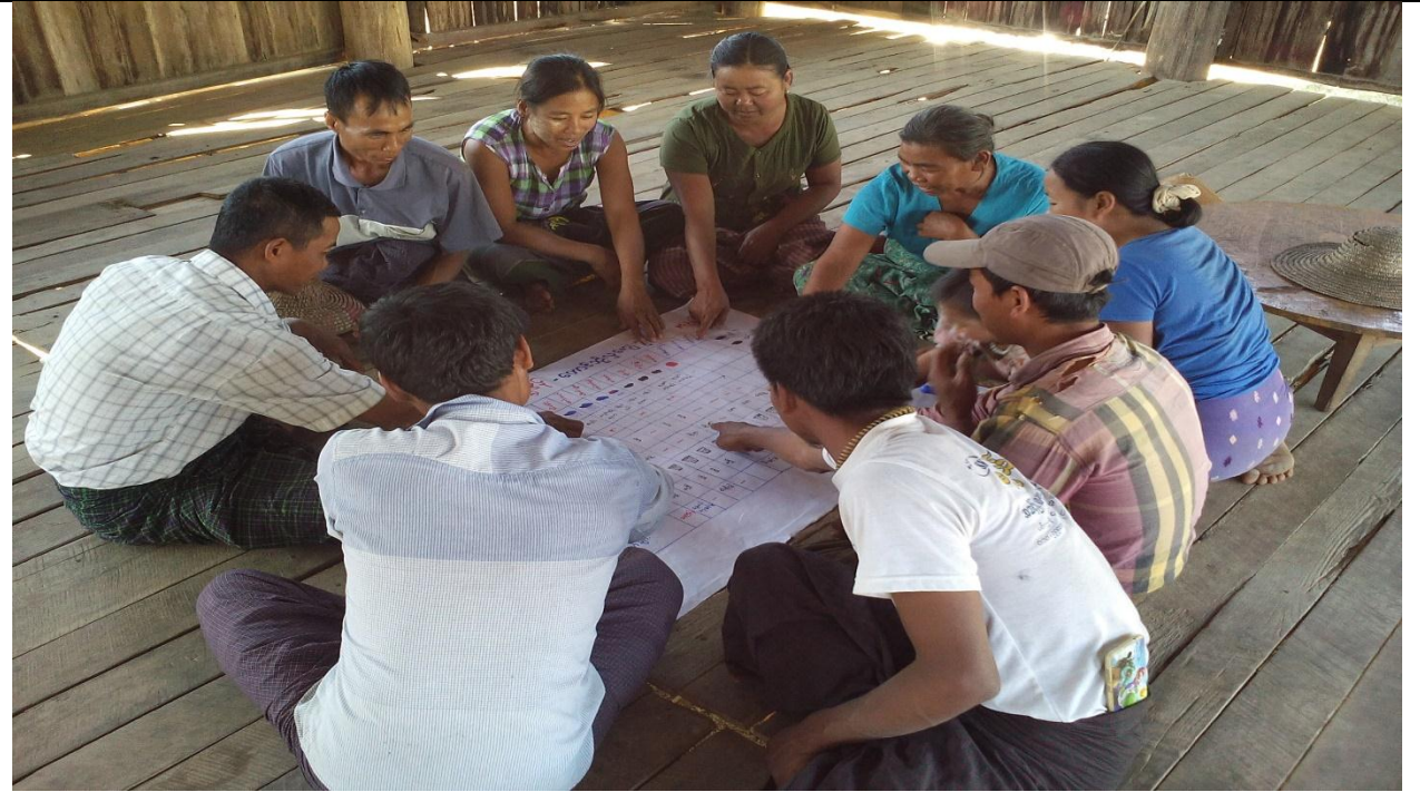
ထိခိုက်လွယ်အုပ်စု မှတ်တမ်းခါတ်ပုံ