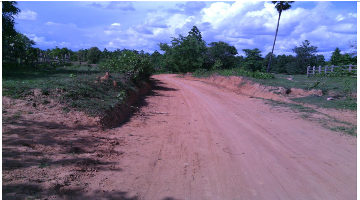
ပထမနှစ် စီမံကိန်းလုပ်ငန်းခွဲပြီးစီးမှုမှတ်တမ်းဓာတ်ပုံ