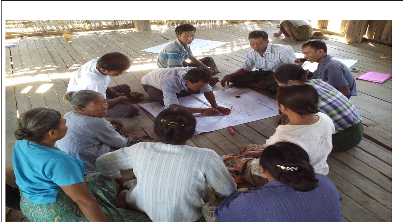
ကျေးရွာဖွံ့ဖြိုးရေးစီမံချက်ရေးဆွဲခြင်း မှတ်တမ်းဓာတ်ပုံ