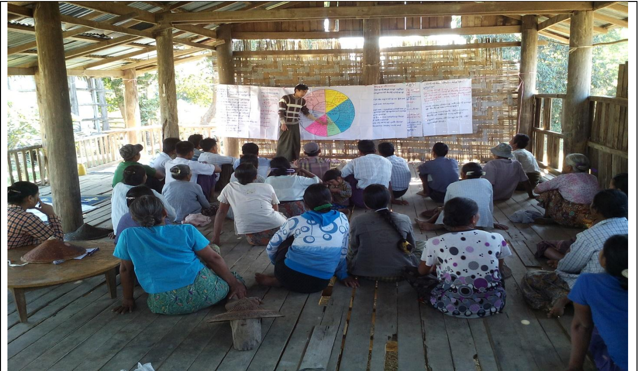
မိတ်ဆက်အစည်းဝေးမှတ်တမ်းဓါတ်ပုံ