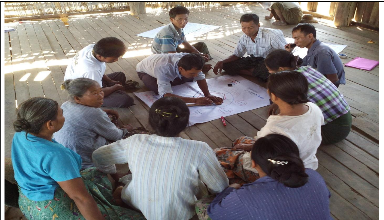
အမျိုးသားအုပ်စု မှတ်တမ်းခါတ်ပုံ