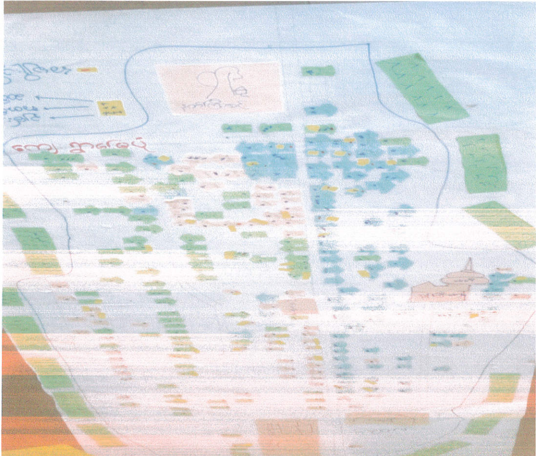
ကျေးရွာ၏လူမှုရေးနှင့် အရင်းအမြစ်ပြမြေပုံ