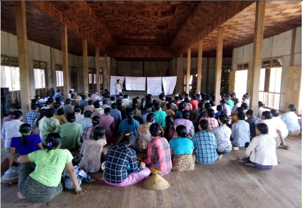
စေတနာ့ဝန်ထမ်းများ ရွေးချယ်ခြင်း မှတ်တမ်းဓါတ်ပုံ