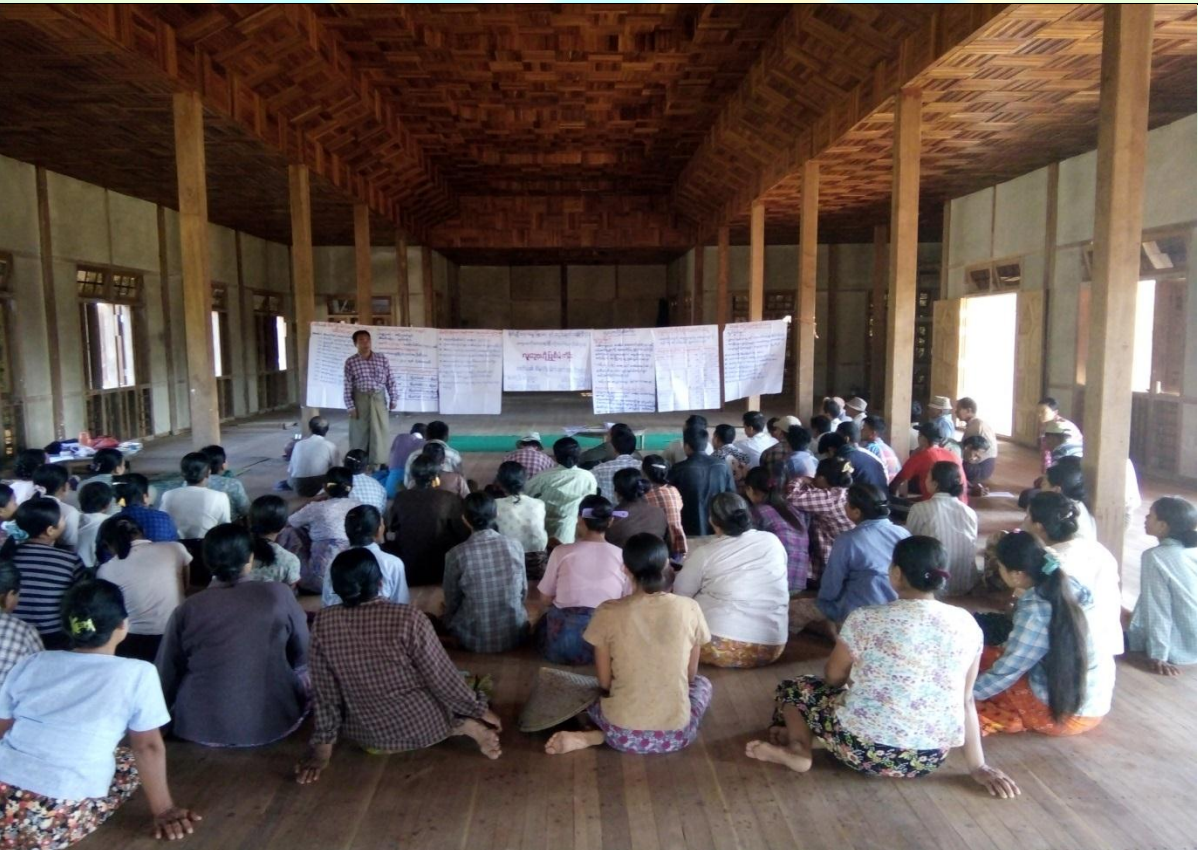
ကော်မတီရွေးချယ်ခြင်း မှတ်တမ်းဓါတ်ပုံ