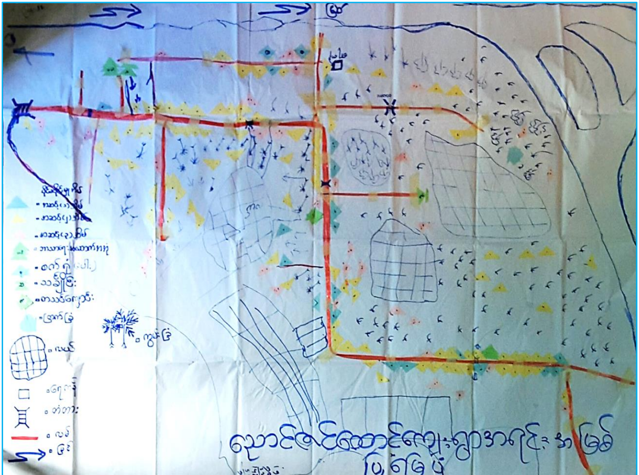
လူမှုရေးအရင်းအမြစ်ပြမြေပုံသုံးသပ်ချက်

လူမှုရေးအရင်းအမြစ်ပြ မြေပုံကိုကြည့်ခြင်းအားဖြင့် ညောင်ဇင်ထောင့်ကျေးရွာ၏ အဓိက အရင်းအမြစ်မှာ လယ် ဖြစ်သည်ကိုတွေ့ရပါသည်။ မြစ်ကမ်းနံဘေးတွင်ရွာတည်ထားပြီး မြစ်ကြောင်းအား အခြေပြုကာ ဥယျာဉ်ခြံမြေများ၊ လယ်ယာများ၊ တံငါလုပ်ငန်းများ၊ ဟင်းရွက်နုစိုက်ခင်းများဖြင့် လုပ်ကိုင်စားသောက်ကြသည်ကို တွေ့မြင်နိုင်ပါ သည်။