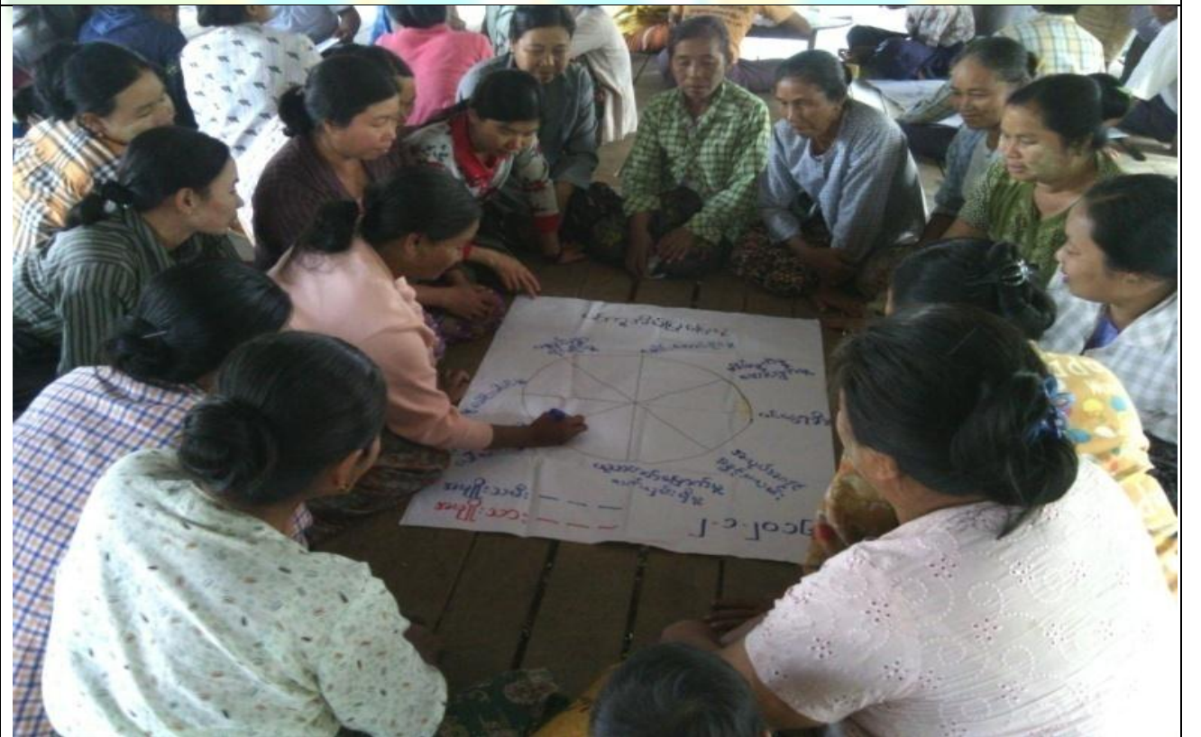
အမျိုးသမီးအုပ်စု၏ မှတ်တမ်းခါတ်ပုံ