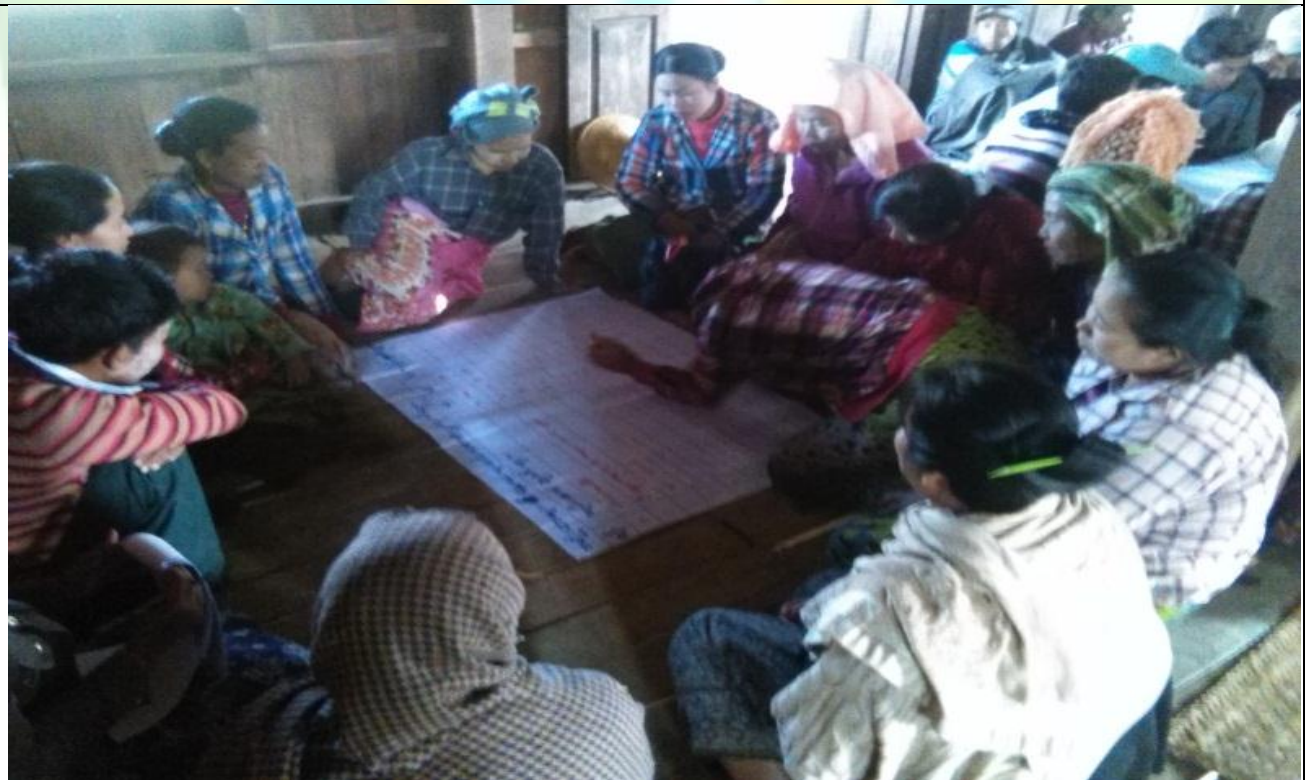
ဖွံ့ဖြိုးရေးအစီအစဉ်ရေးဆွဲခြင်း မှတ်တမ်းခါတ်ပုံ