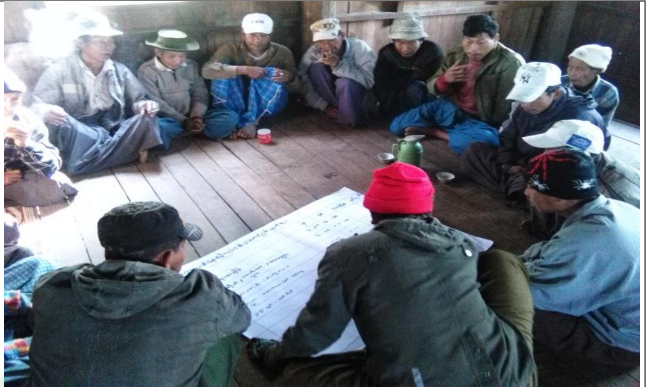
ဖွံ့ဖြိုးရေးအစီအစဉ်ရေးဆွဲခြင်း မှတ်တမ်းခါတ်ပုံ