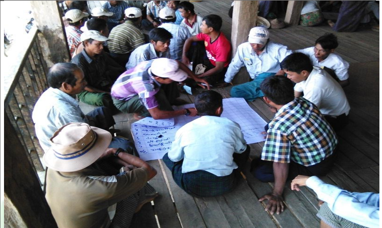
အမျိုးသားအုပ်စု၏ မှတ်တမ်းခါတ်ပုံ