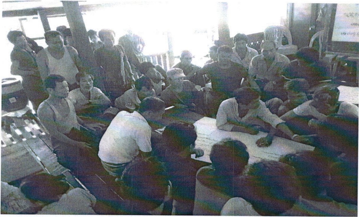
ကော်မတီဝင်များရွေးခြယ်ခြင်းနှင့်ကျေးရွာဖွံ့ဖြိုးရေးအစီအစဉ်ဆောင်ရွက်မှုမှတ်တမ်းဓာတ်ပုံများ