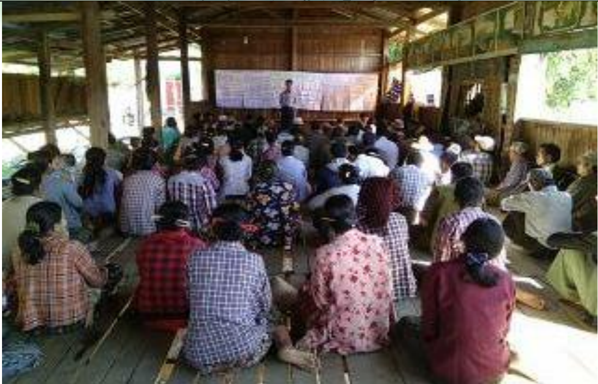
ကော်မတီရွေးချယ်ခြင်း မှတ်တမ်းဓာတ်ပုံ