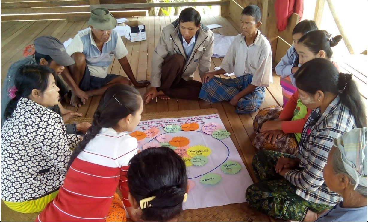
လူငယ်အုပ်စု၏ မှတ်တမ်းခါတ်ပုံ