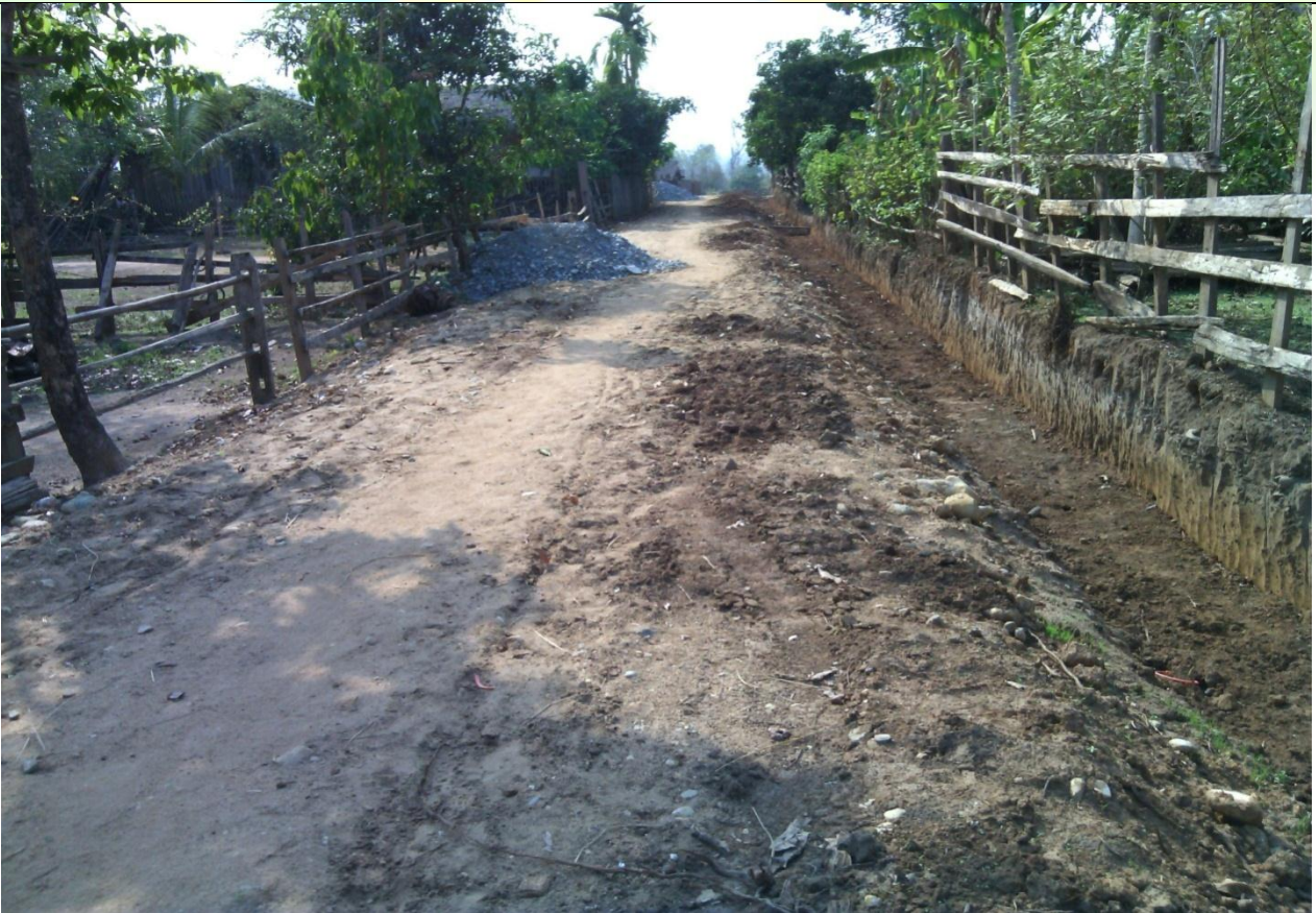
ပထမနှစ်စီမံကိန်းလုပ်ငန်းခွဲဆောင်ရွက်ပြီးစီးမှုမှတ်တမ်းဓာတ်ပုံ