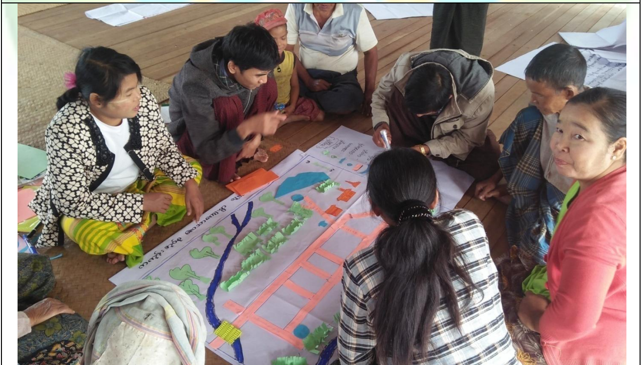
အမျိုးသမီးအုပ်စု၏ မှတ်တမ်းခါတ်ပုံ