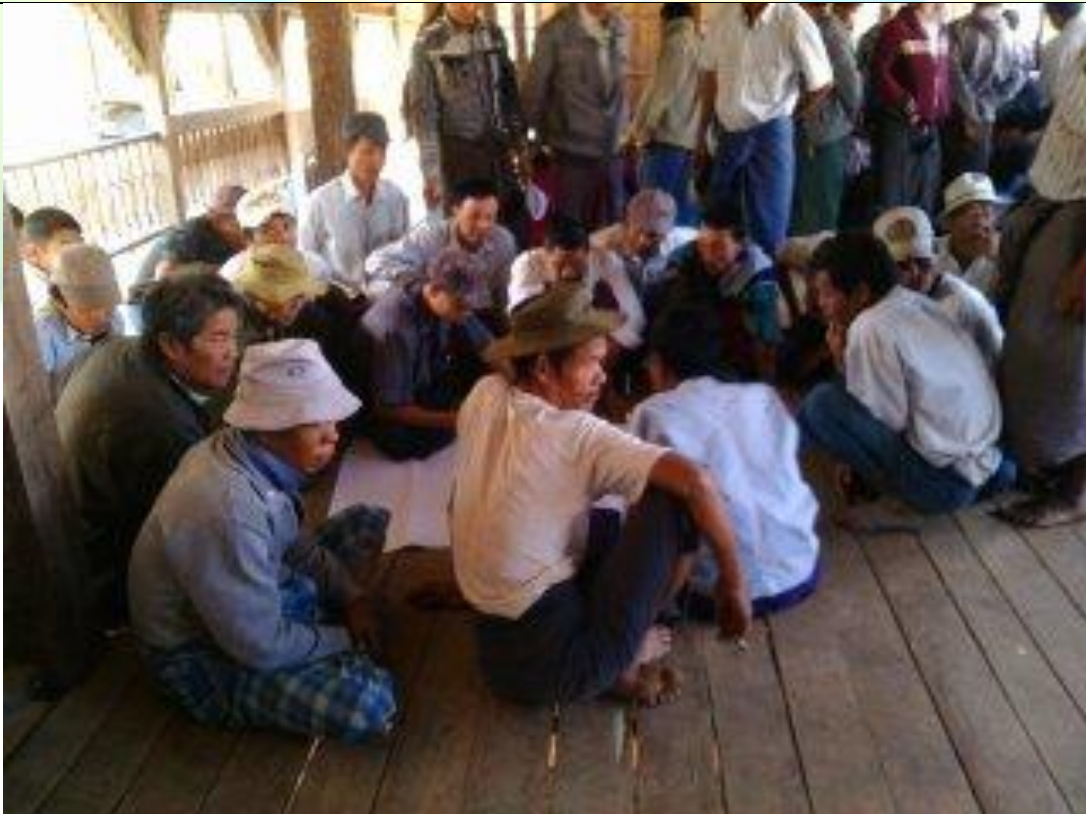
ထိခိုက်လွယ်အုပ်စုများ၏ မှတ်တမ်းခါတ်ပုံ