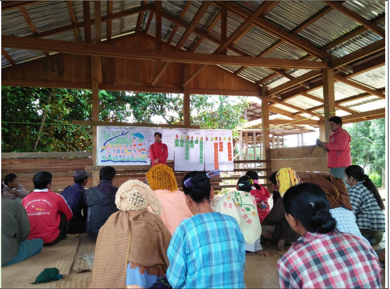
စေတနာ့ဝန်ထမ်းများ ရွေးချယ်ခြင်း မှတ်တမ်းဓာတ်ပုံ