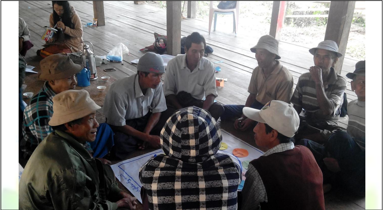
အမျိုးသားအုပ်စု၏ မှတ်တမ်းခါတ်ပုံ