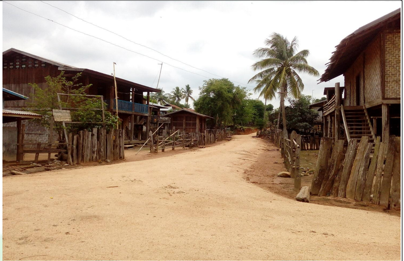
တတိယနှစ် စီမံကိန်းလုပ်ငန်းခွဲ ဆောင်ရွက်ပြီးစီးမှုအခြေအနေ (ရွာတွင်းလမ်း)