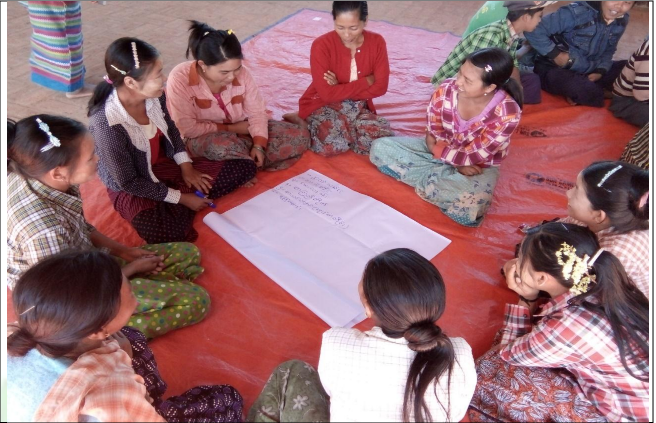
လူငယ်အုပ်စု၏ မှတ်တမ်းခါတ်ပုံ