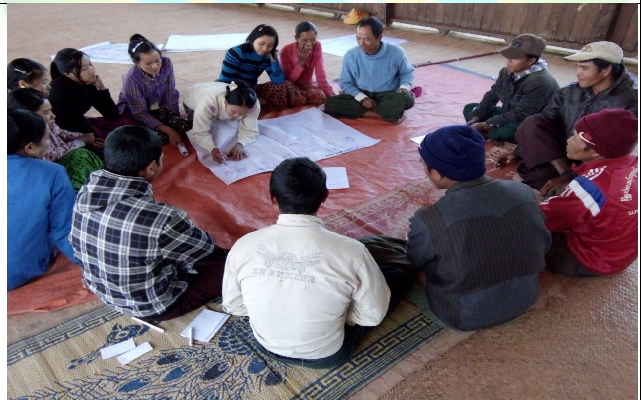
ထိခိုက်လွယ်အုပ်စုများ၏ မှတ်တမ်းခါတ်ပုံ