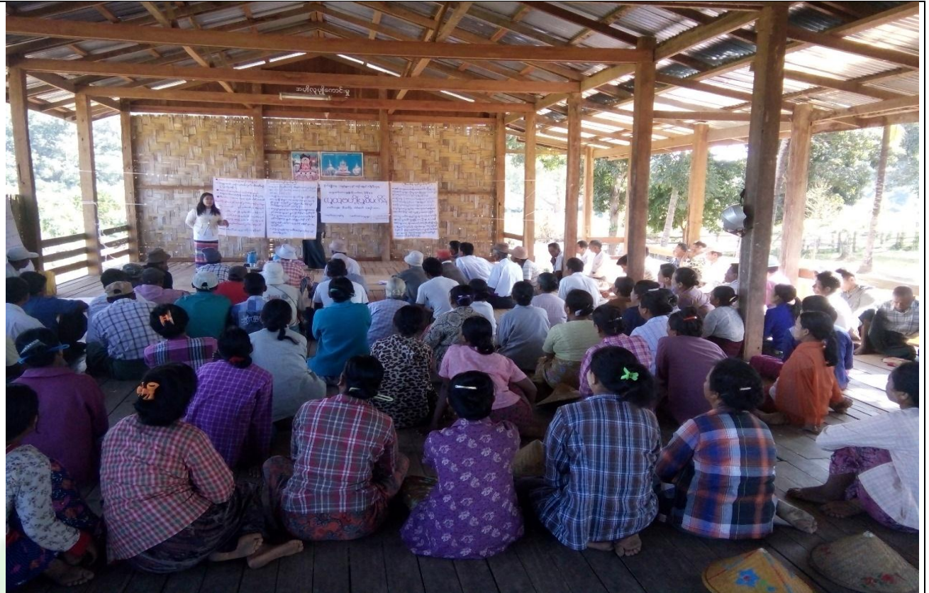
စေတနာ့ဝန်ထမ်းများ ရွေးချယ်ခြင်း မှတ်တမ်းခါတ်ပုံ