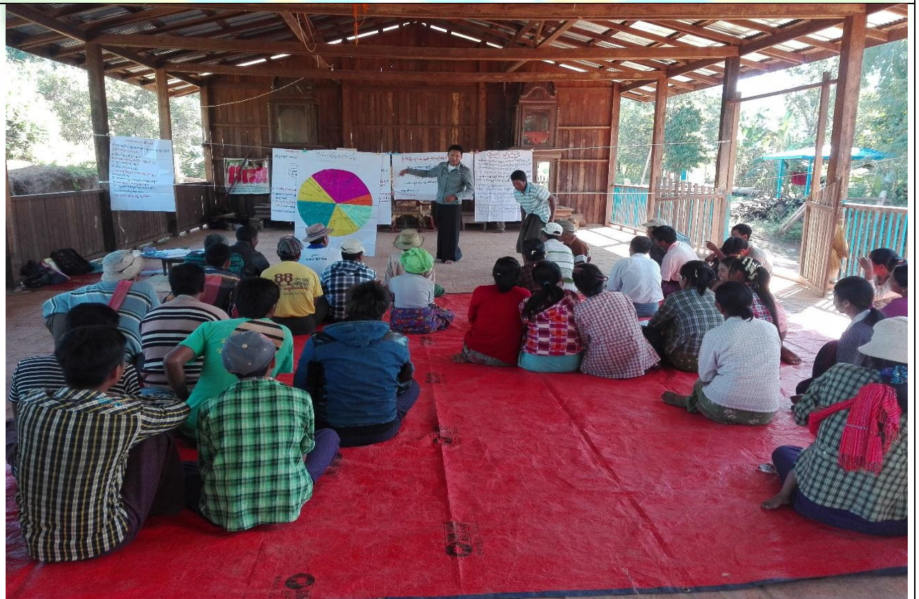
ကော်မတီရွေးချယ်ခြင်း မှတ်တမ်းခါတ်ပုံ