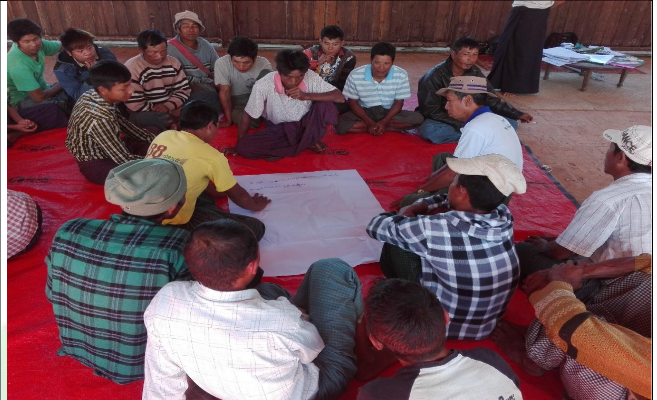
အမျိုးသားအုပ်စု၏ မှတ်တမ်းခါတ်ပုံ