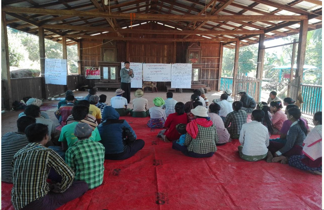
လုပ်ငန်းခွဲများရွေးချယ်ခြင်းမှတ်တမ်းဓာတ်ပုံ