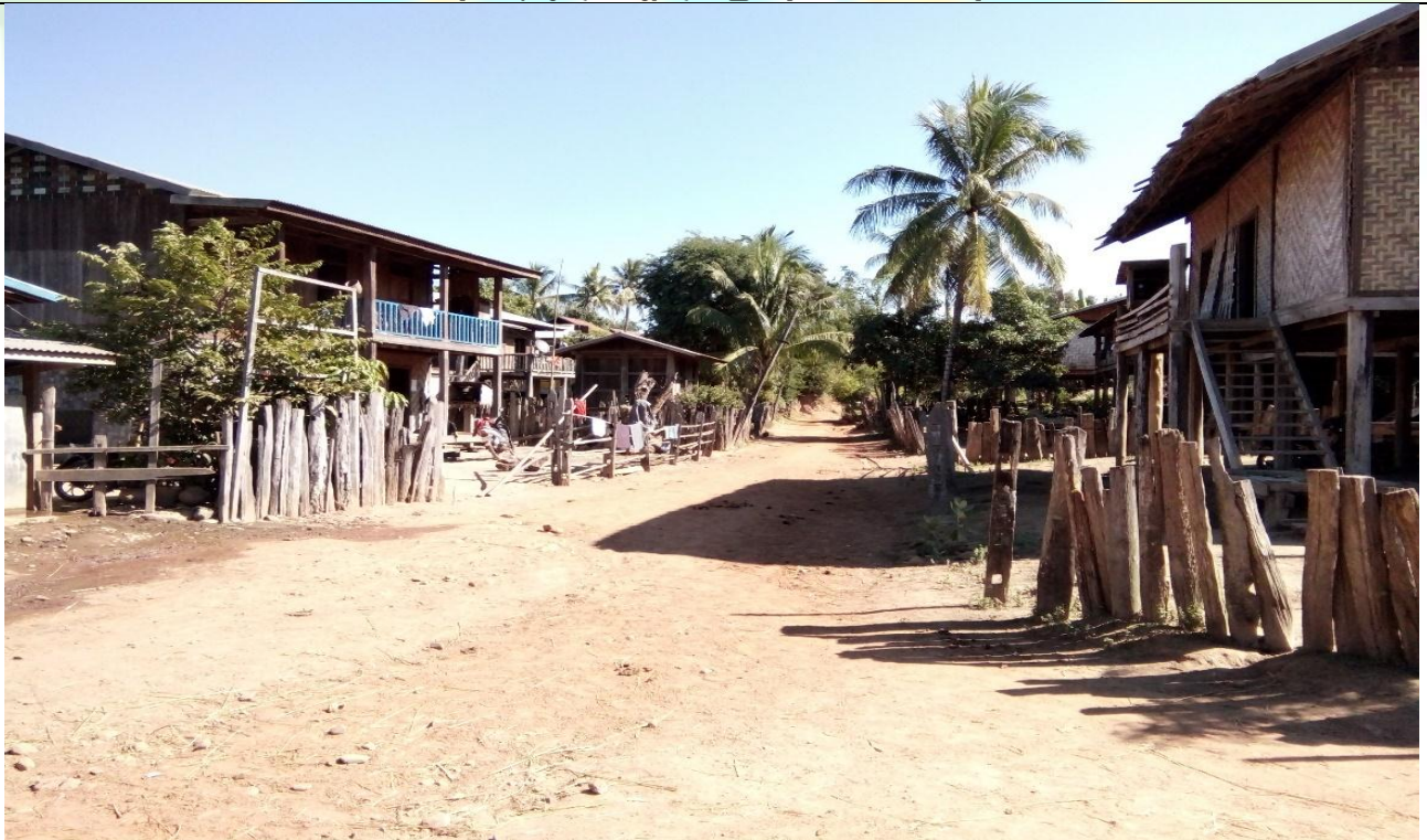
တတိယနှစ်စီမံကိန်းလုပ်ငန်းခွဲဆောင်ရွက်မှုအခြေအနေ(ရွာတွင်းလမ်း)