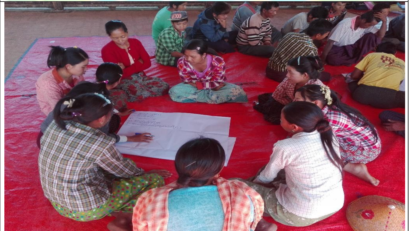
အမျိုးသမီးအုပ်စု၏ မှတ်တမ်းခါတ်ပုံ