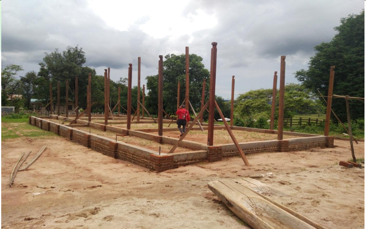
ဒုတိယနှစ်စီမံကိန်းလုပ်ငန်းခွဲဆောင်ရွက်နေမှုမှတ်တမ်းဓာတ်ပုံ