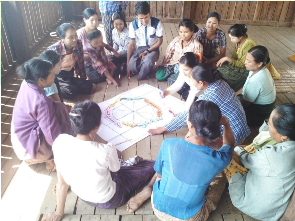
အမျိုးသမီးအုပ်စု၏ မှတ်တမ်းဓာတ်ပုံ