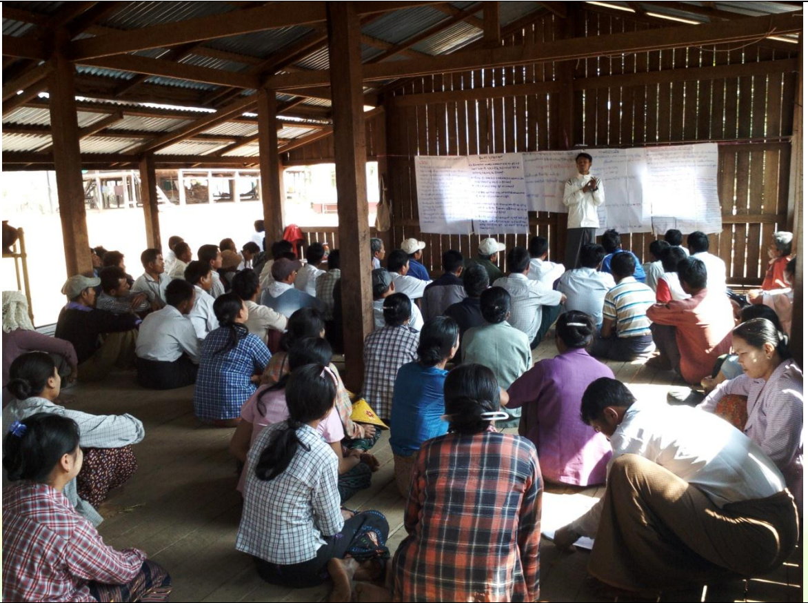
စေတနာ့ဝန်ထမ်းများ ရွေးချယ်ခြင်း မှတ်တမ်းခါတ်ပုံ