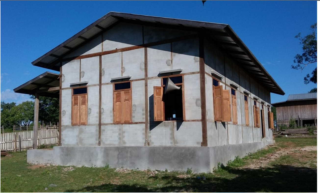
ပထမနှစ်စီမံကိန်းလုပ်ငန်းခွဲပြီးစီးမှုမှတ်တမ်းဓာတ်ပုံ