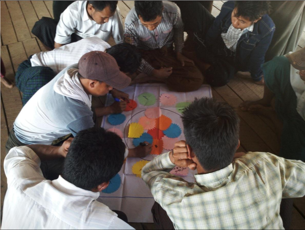
အမျိုးသားအုပ်စု၏ မှတ်တမ်းဓာတ်ပုံ