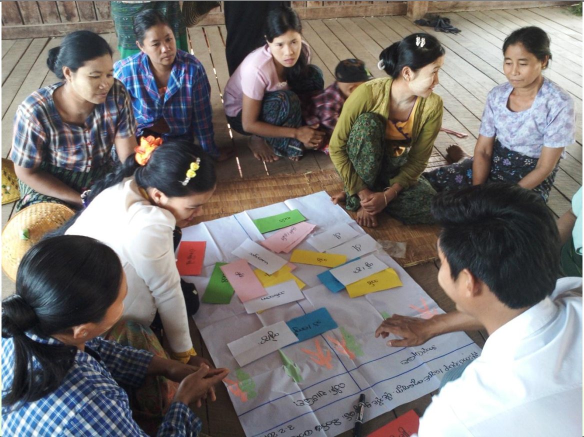
လူငယ်အုပ်စု၏ မှတ်တမ်းဓါတ်ပုံ