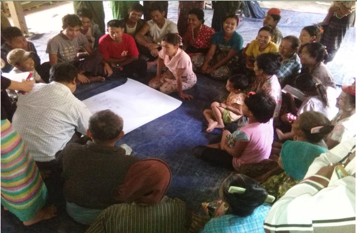
ထိခိုက်လွယ်အုပ်စုများ၏ မှတ်တမ်းဓါတ်ပုံ