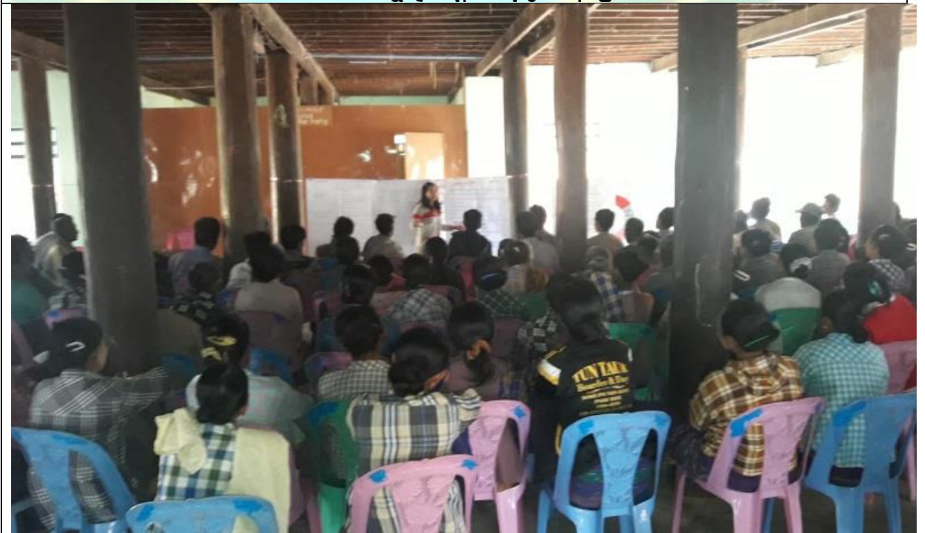
စီမံကိန်းမိတ်ဆက်အစည်းအဝေး မှတ်တမ်းဓါတ်ပုံ