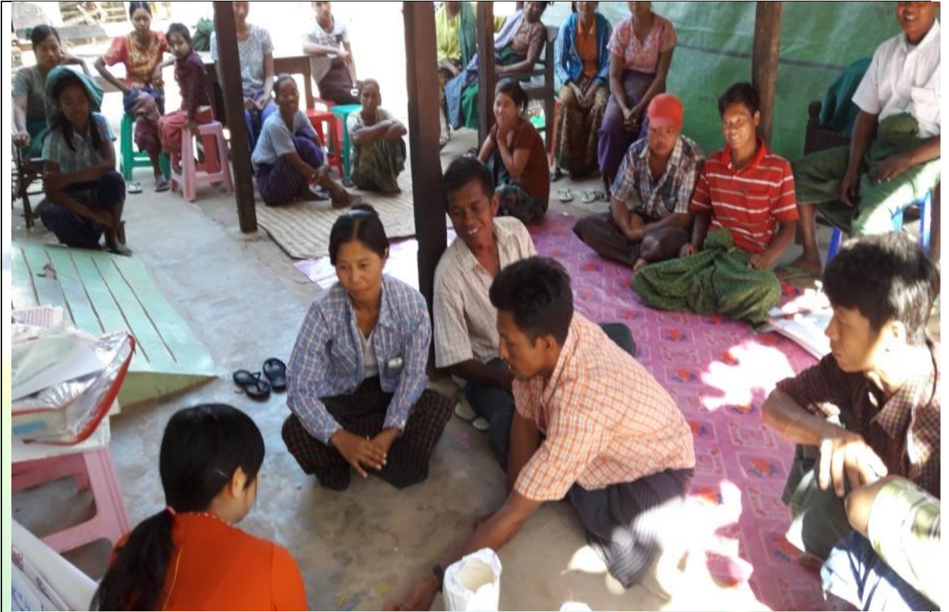
ကော်မတီရွေးချယ်ရန် မဲရေတွက်နေစဉ်