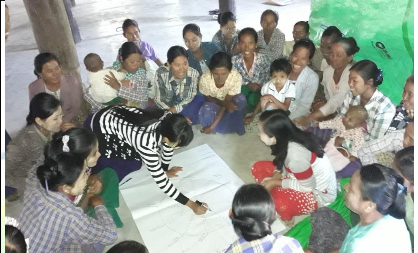
အမျိုးသမီးများပင့်ကူအိမ်ကွန်ယက်ရေးဆွဲနေစဉ် မှတ်တမ်းဓါတ်ပုံ