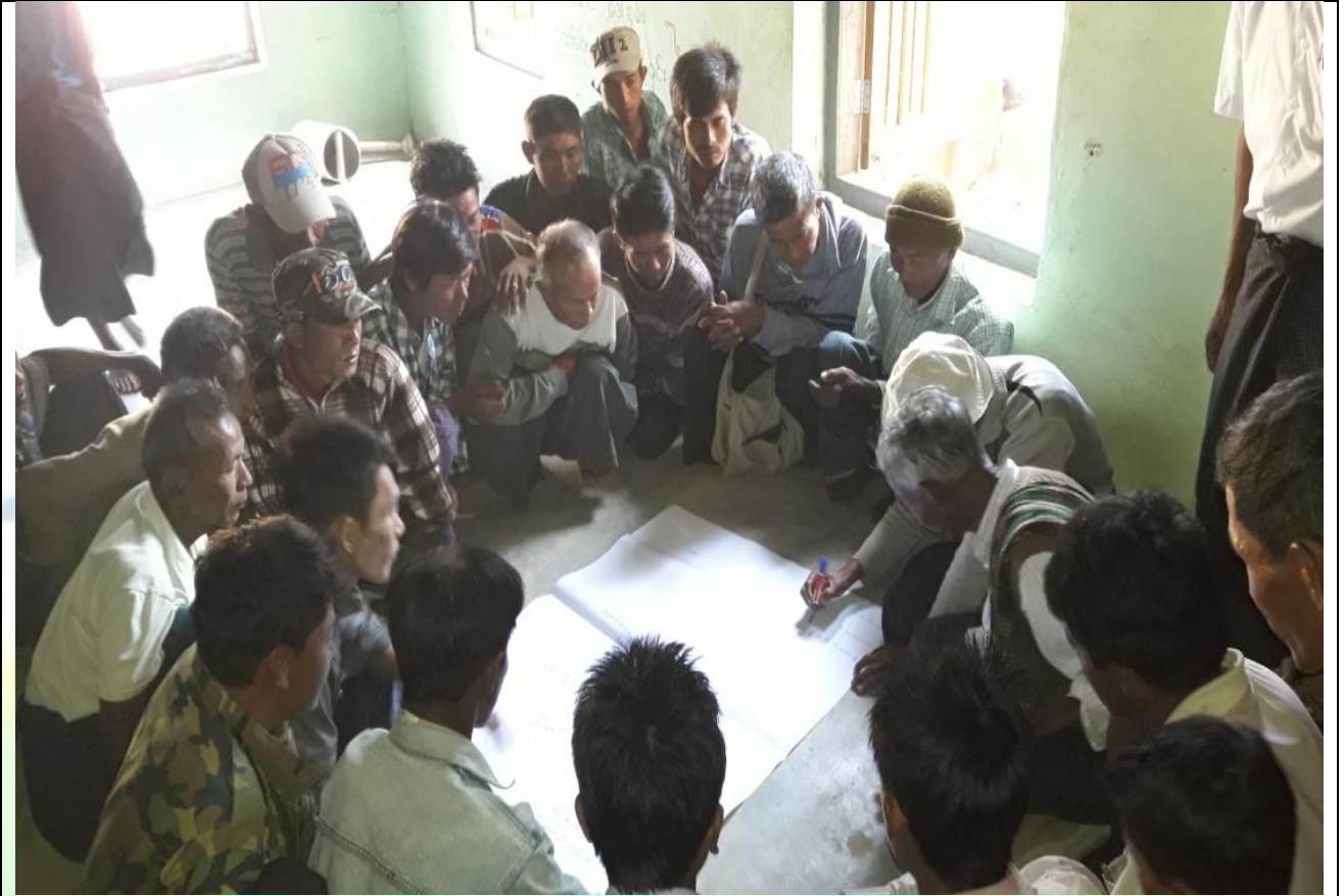
ကျေးရွာလုပ်ငန်းခွဲအတွက်အခက်အခဲများဖော်ထုတ်ဆွေးနွေးစဉ်