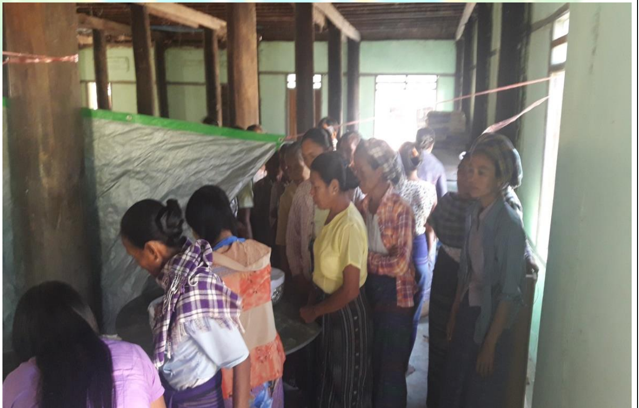
ကျေးရွာဖွံ့ဖြိုးရေးဦးစားပေးမဲပေးရန်တန်းစီနေကြစဉ်