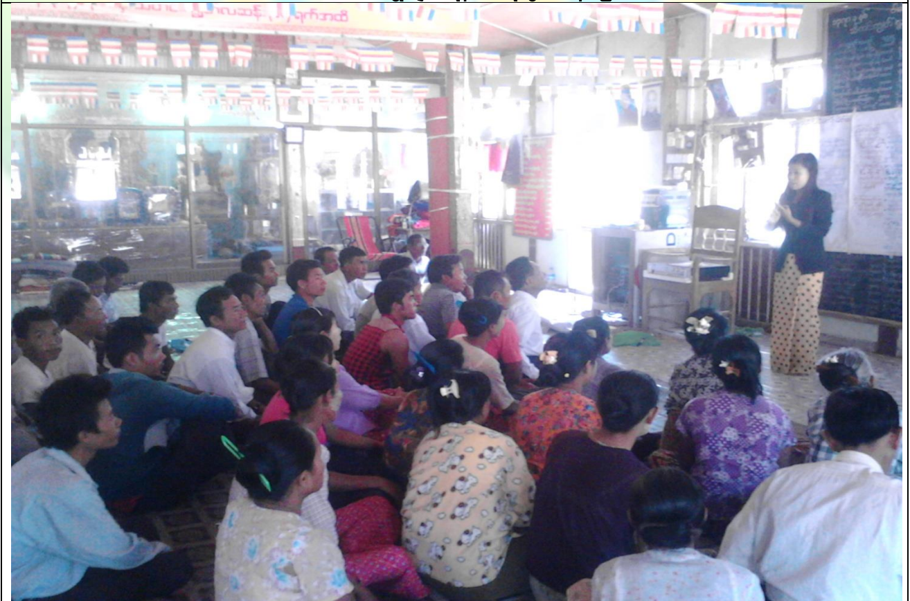
စီမံကိန်းမိတ်ဆက်အစည်းအဝေးမှတ်တမ်းဓါတ်ပုံ