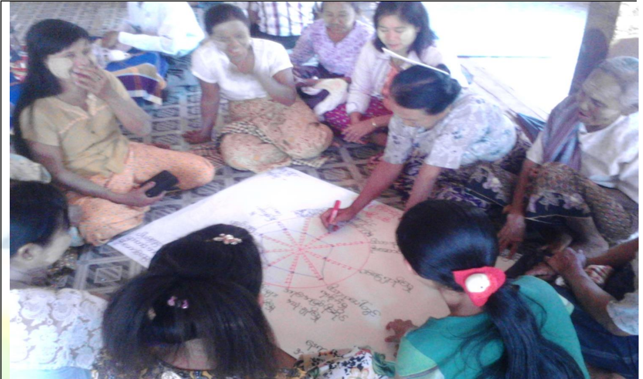
အမျိုးသမီးများပင့်ကူအိမ်ကွန်ယက်ရေးဆွဲနေစဉ်မှတ်တမ်းဓာတ်ပုံ