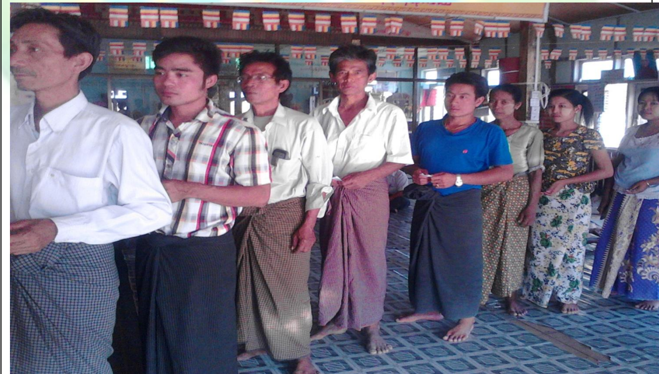
ကျေးရွာဖွံ့ဖြိုးရေးဦးစားပေးမဲပေးရန်တန်းစီနေကြစဉ်