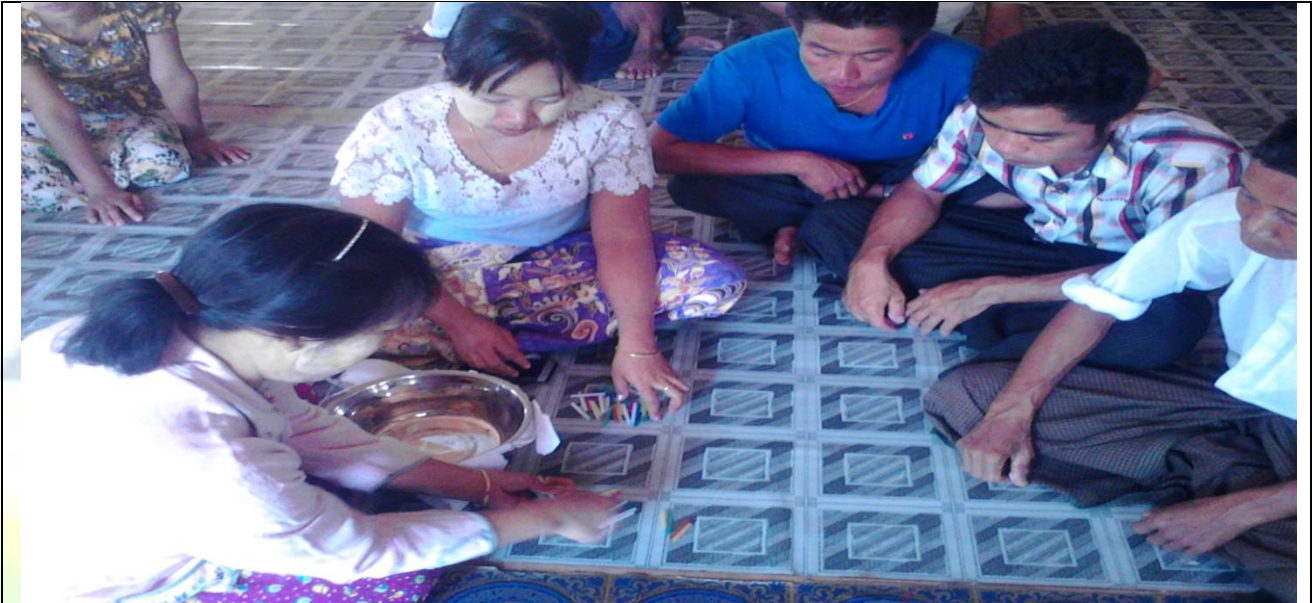
ကော်မတီရွေးချယ်ရန် မဲရေတွက်နေစဉ်

၆။ ကော်မတီဝင်များရွေးချယ်ခြင်းနှင့်ကျေးရွာဖွံ့ဖြိုးရေးအစီအစဉ်ဆောင်ရွက်မှုမှတ်တမ်းဓါတ်ပုံများ