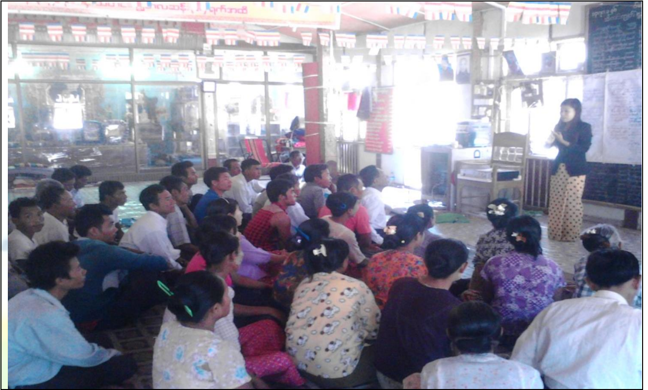
ကျေးရွာလုပ်ငန်းခွဲအတွက်အခက်အခဲများဖော်ထုတ်ဆွေးနွေးစဉ်