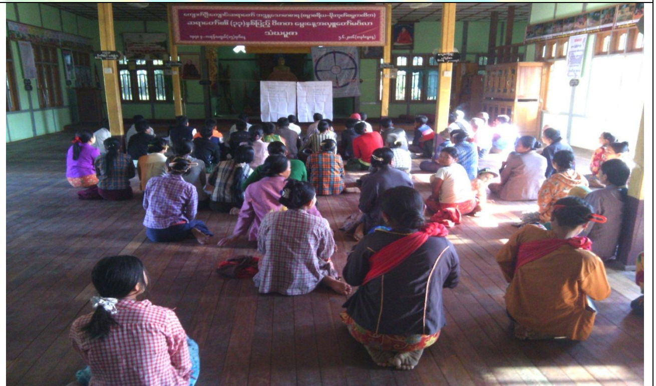
ကော်မတီရွေးချယ်ခြင်း မှတ်တမ်းဓာတ်ပုံ