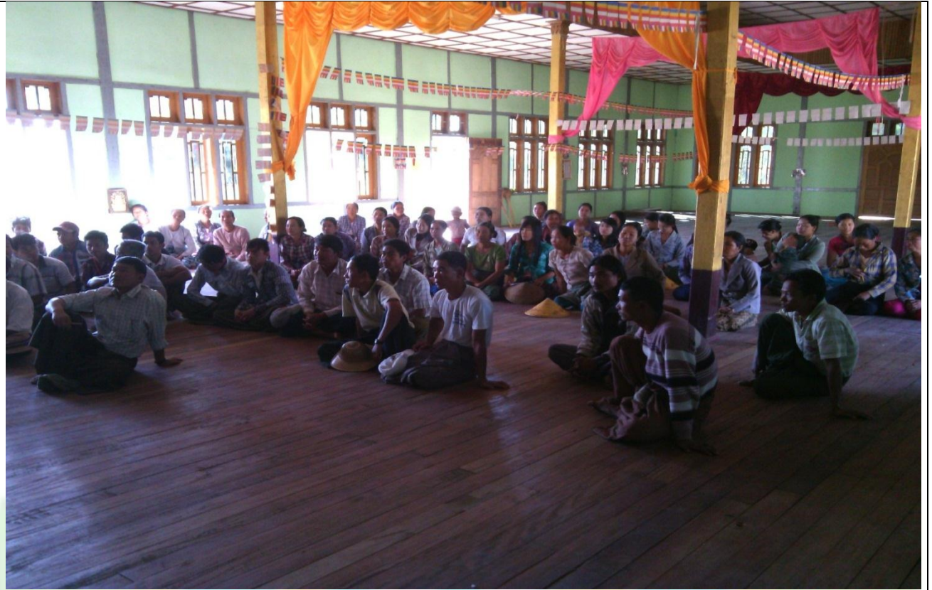
စေတနာ့ဝန်ထမ်းများ ရွေးချယ်ခြင်း မှတ်တမ်းဓာတ်ပုံ