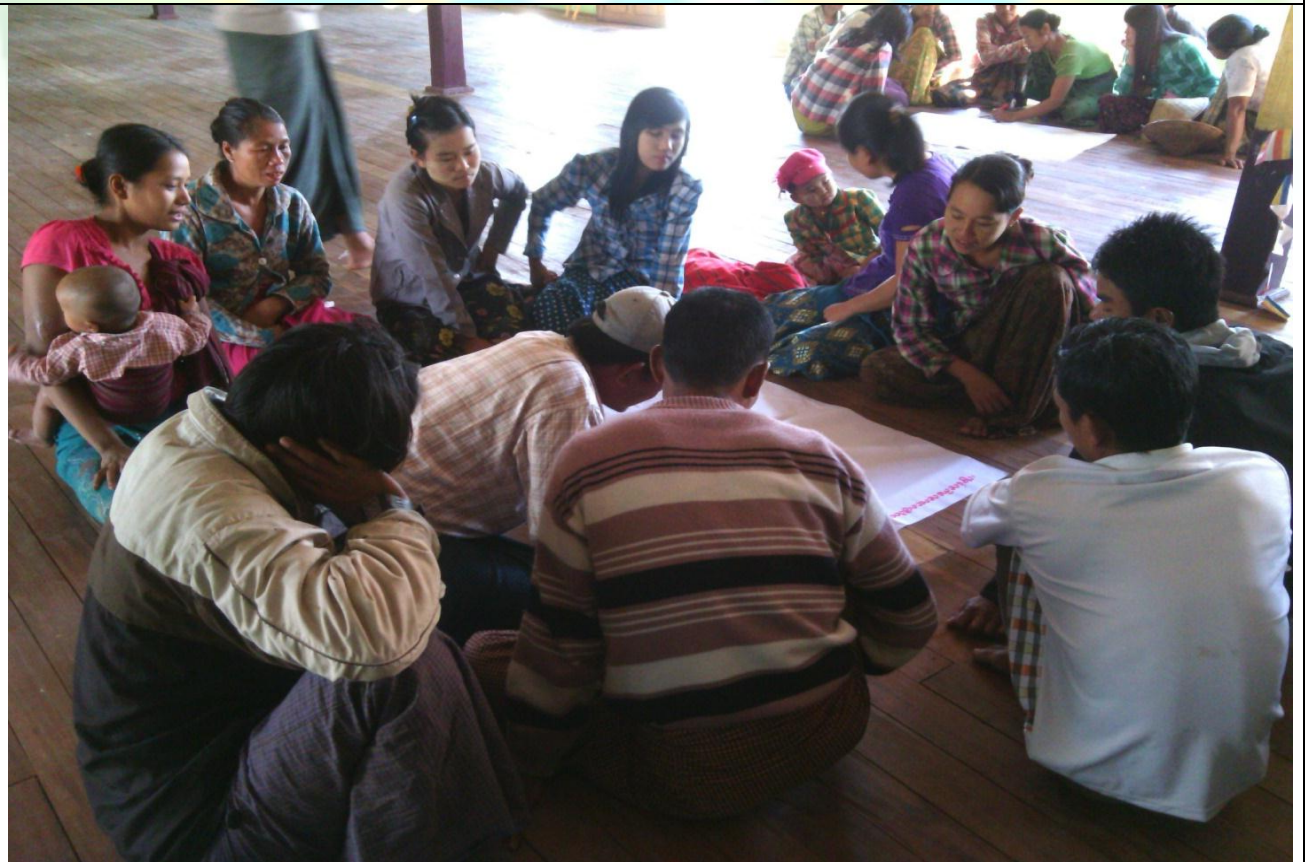
ဖွံ့ဖြိုးရေးအစီအစဉ်ရေးဆွဲခြင်း မှတ်တမ်းဂါတ်ပုံ