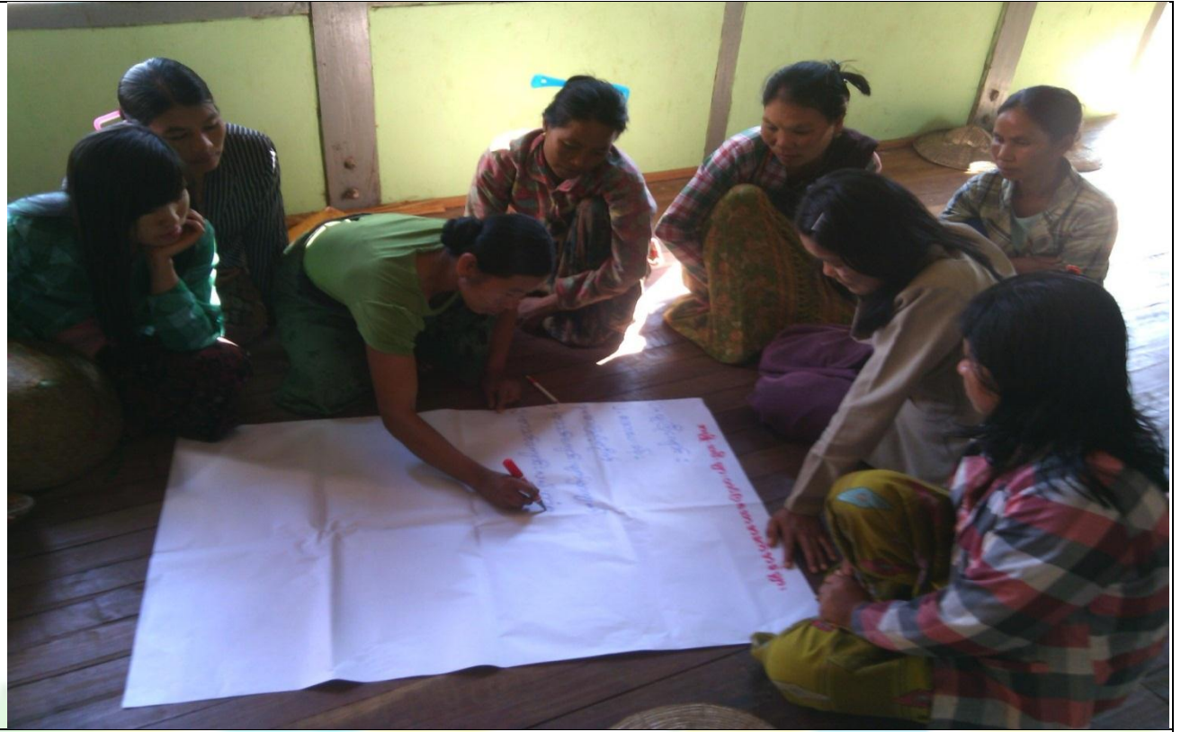
ဖွံ့ဖြိုးရေးအစီအစဉ်ရေးဆွဲခြင်း မှတ်တမ်းဂါတ်ပုံ