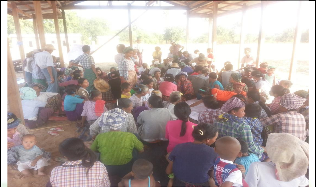
ကျေးရွာလုပ်ငန်းခွဲအတွက်အခက်အခဲများဖော်ထုတ်ဆွေးနွေးစဉ်