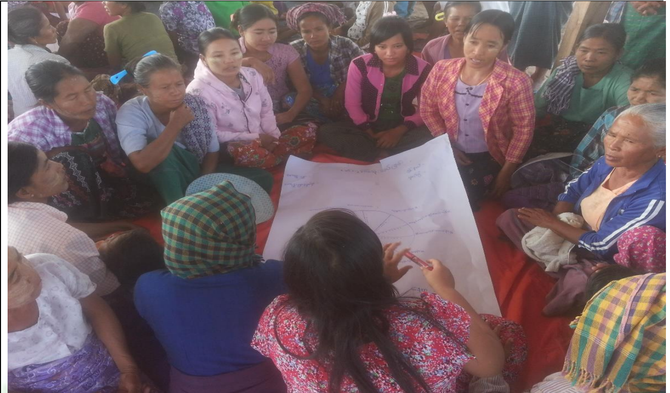
အမျိုးသမီးများပင့်ကူအိမ်ကွန်ယက်ရေးဆွဲနေစဉ် မှတ်တမ်းဓါတ်ပုံ