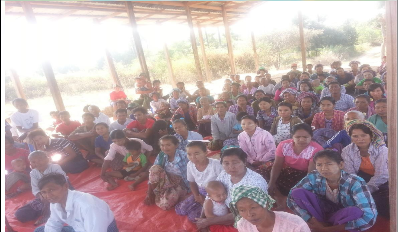
စီမံကိန်းမိတ်ဆက်အစည်းအဝေး မှတ်တမ်းဓါတ်ပုံ