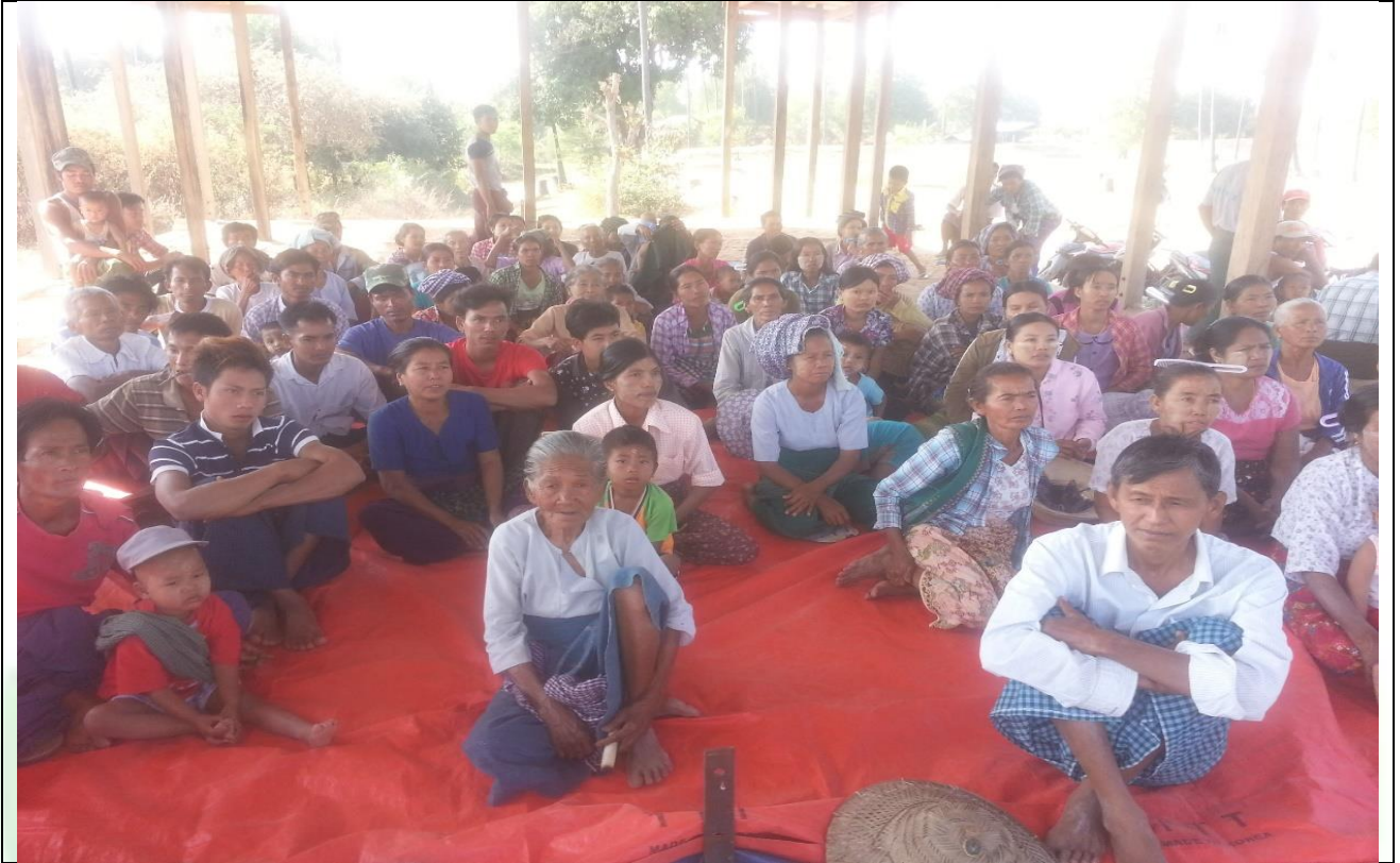
ကော်မတီရွေးချယ်ရန် မဲရေတွက်နေစဉ်