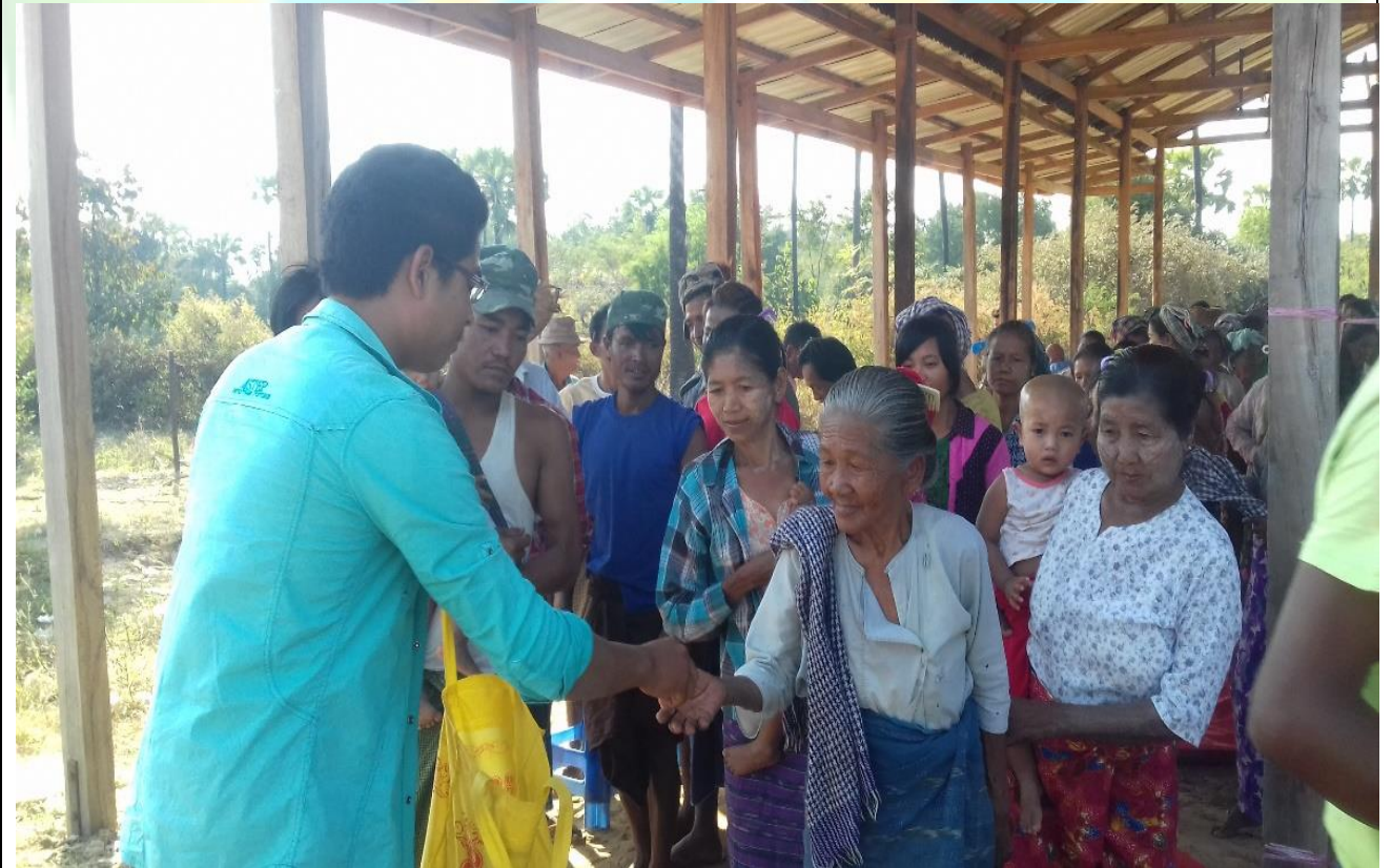
ကျေးရွာဖွံ့ဖြိုးရေးဦးစားပေးမဲပေးရန်တန်းစီနေကြစဉ်