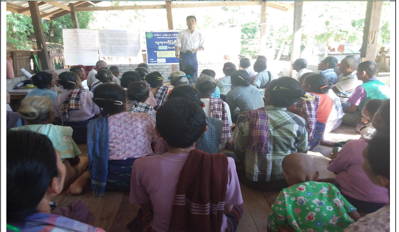
စီမံကိန်းမိတ်ဆက်အစည်းအဝေး မှတ်တမ်းခါတ်ပုံ