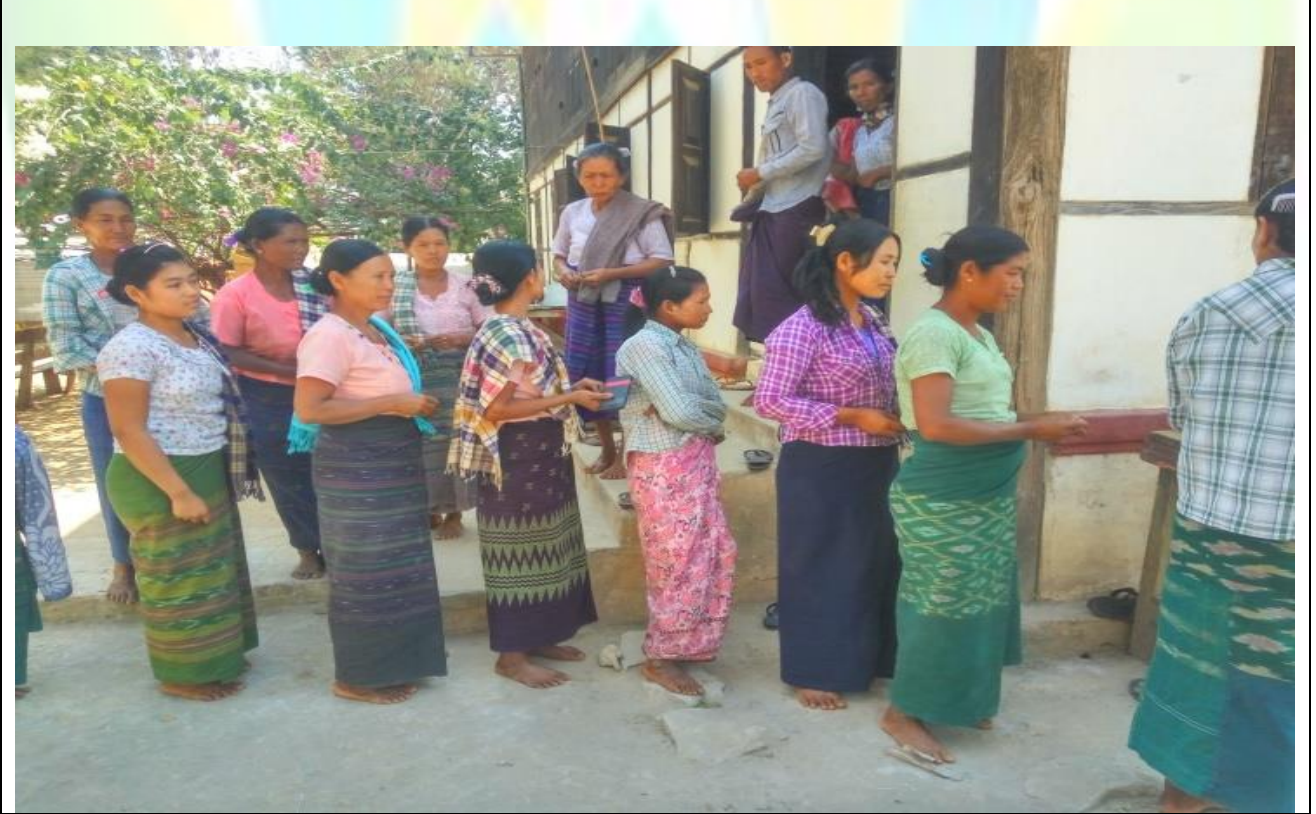
ကျေးရွာဖွံ့ဖြိုးရေးဦးစားပေးမဲပေးရန်တန်းစီနေကြစဉ်