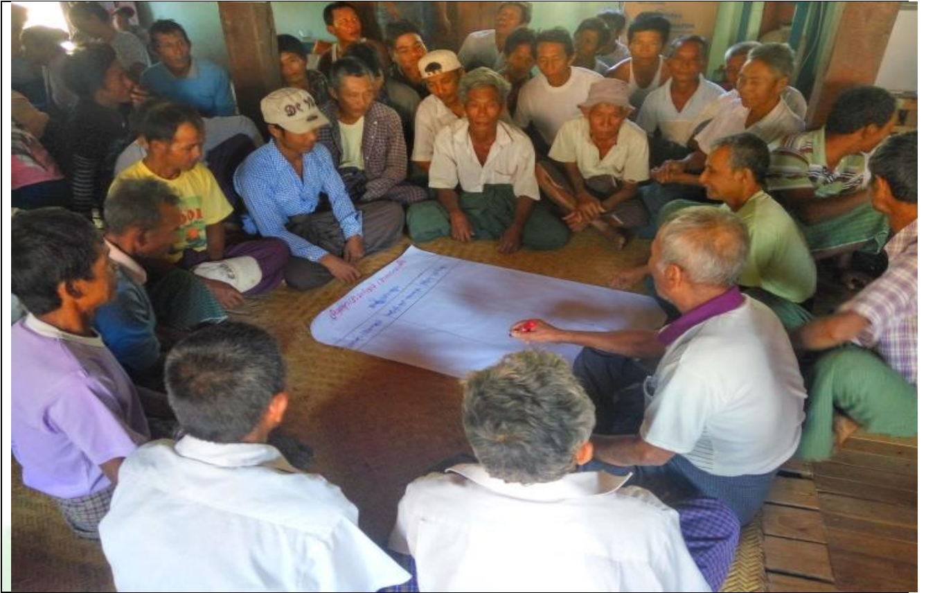
ကျေးရွာလုပ်ငန်းခွဲအတွက်အခက်အခဲများဖော်ထုတ်ဆွေးနွေးစဉ်