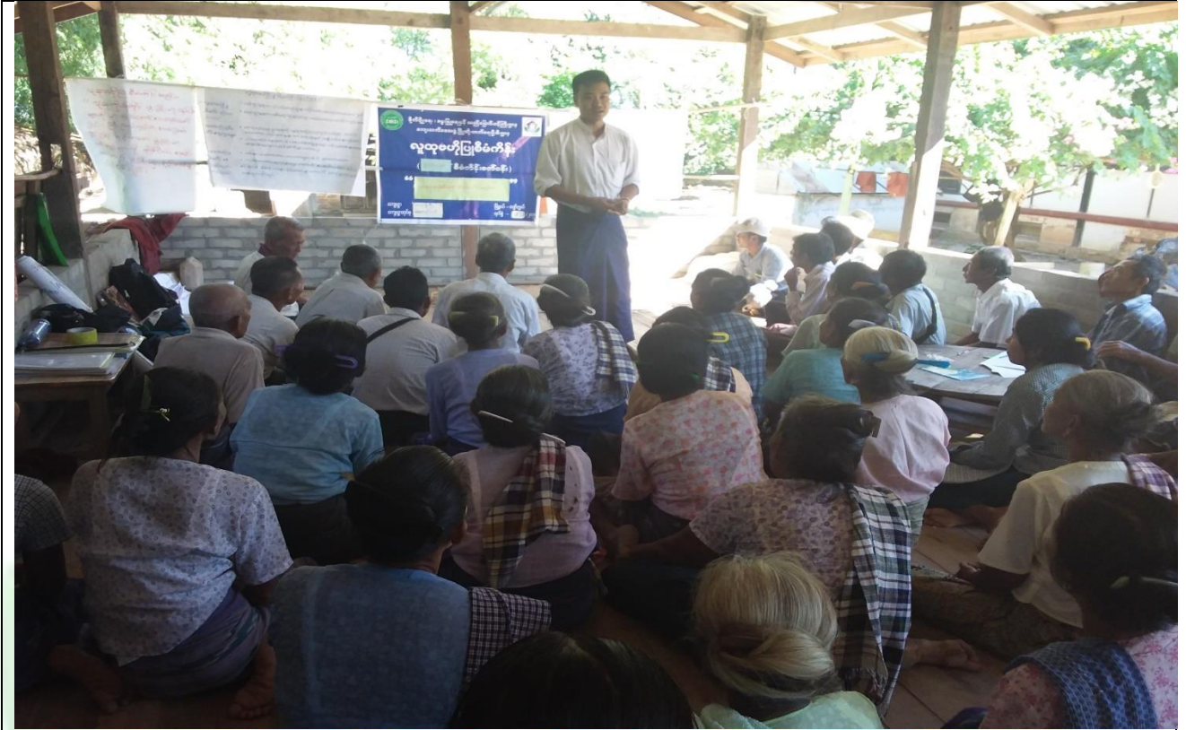
ကော်မတီရွေးချယ်ရန် မဲရေတွက်နေစဉ်