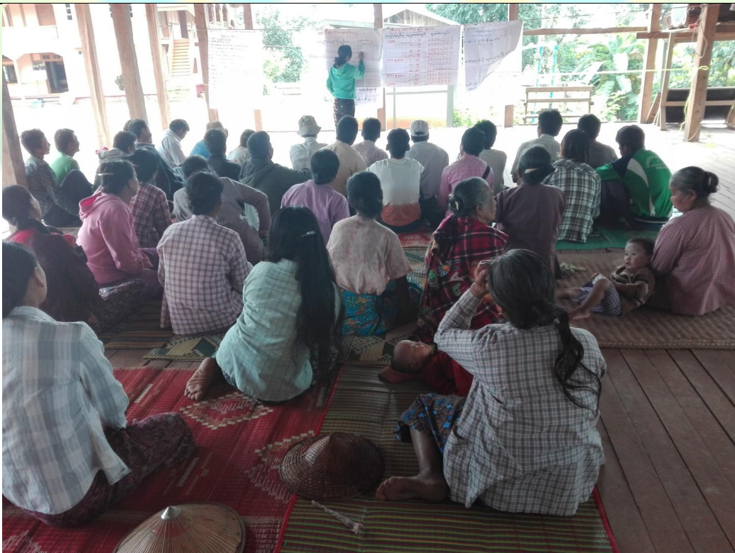
ကော်မတီရွေးချယ်ခြင်း မှတ်တမ်းခါတ်ပုံ