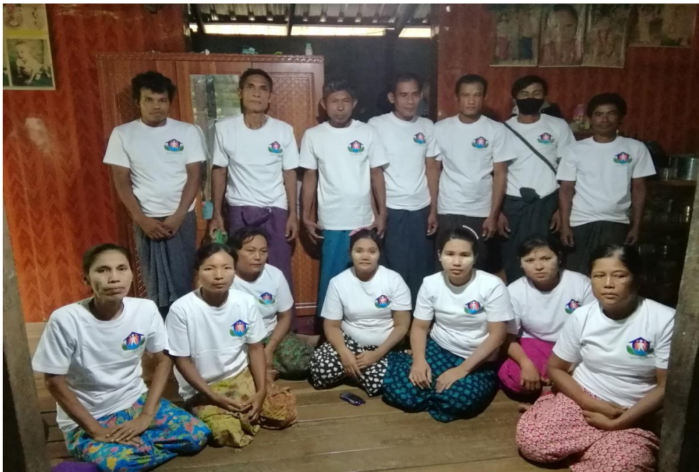
ကွင်းကောက် တောင် ကျေးရွာအုပ်စု ၊ ဒေါင်ကြီး ကျေးရွာ ၂၀၂၀-၂၀၂၁ ခုနှစ်

အင်္ဂပူ မြို့နယ် ၊ ရောဝတီ တိုင်းဒေသကြီး ကျေးရွာဖွံ့ဖြိုးရေးအစီအစဉ်