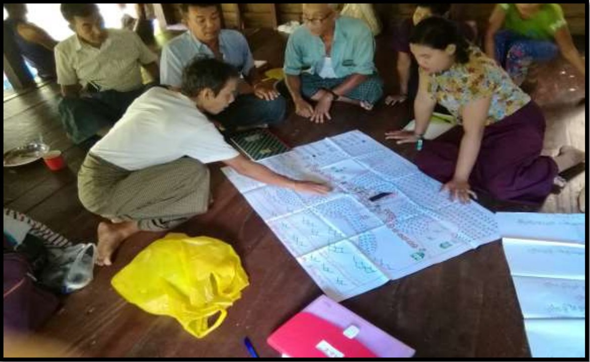
၇။ကော်မတီဝင်များရွေးချယ်ခြင်းနှင့် ကျေးရွာဖွံ့ဖြိုးရေးအစီအစဉ်ဆောင်ရွက်မှုမှတ်တမ်းခါတ်ပုံများ