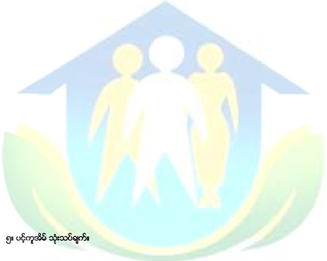
၅။ ပင့်ကူအိမ် သုံးသပ်ချက်။

ကျေးရွာပြင်ပအဖွဲ့ အစည်းဖြစ်သော မြို့ နယ်ထွေအုပ်၊ စိုက်ပျိုးရေးဦးစီးဌာန၊ မြေစာရင်းဌာန၊ လဝကဌာန၊ ငါးဦးစီးဌာနနှင့် ပက်မြန်မာအဖွဲ့ များသည်လည်း ကျေးရွာ အဖွဲ့ အစည်းများနှင့် ကဏ္ဍအသီးသီးတွင် ချိတ်ဆက်ဆောင်ရွက်နေသည်ကိုလဲ တွေ့ ရှိပါသည်။