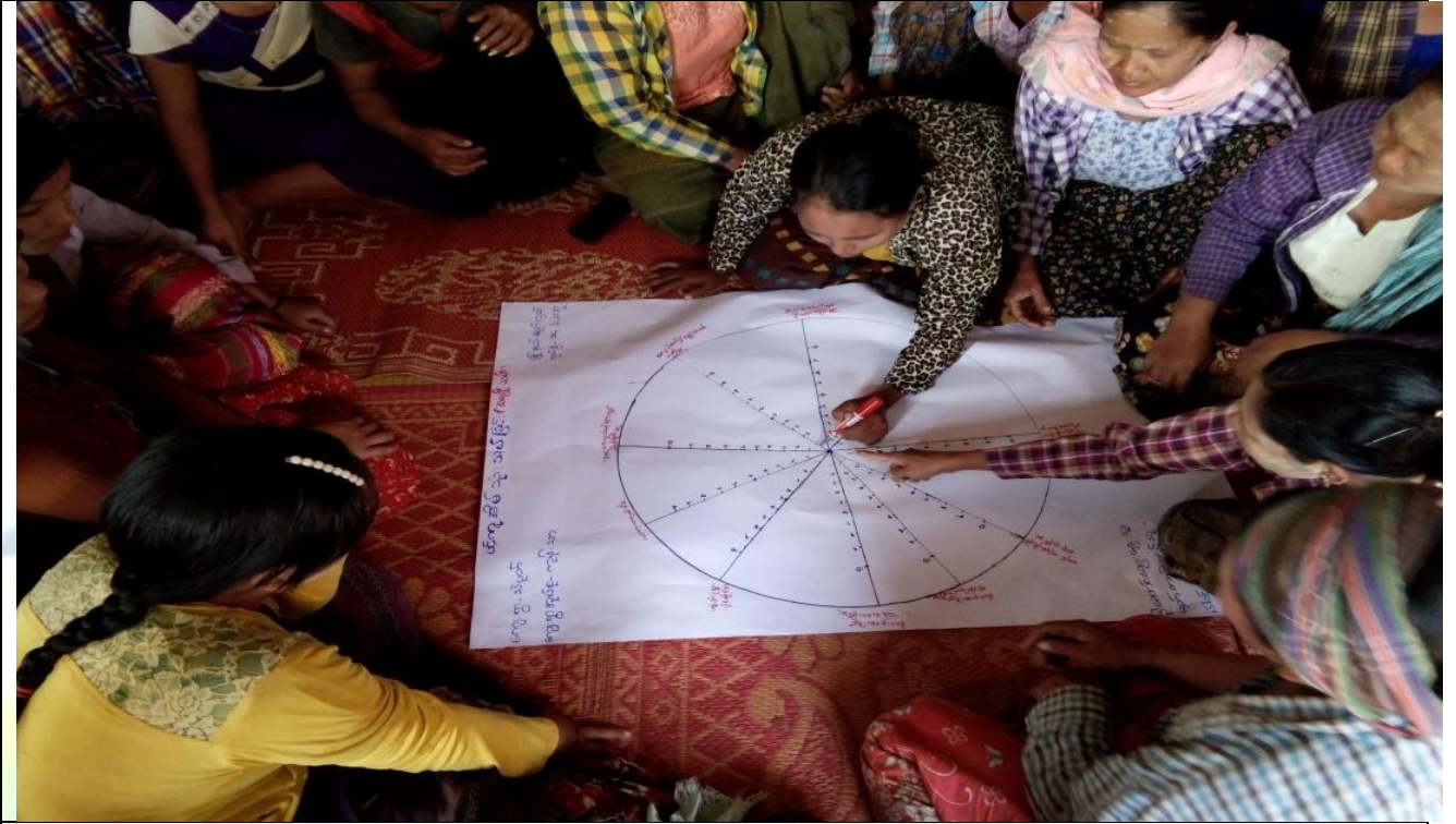
အမျိုးသမီးများပင့်ကူအိမ်ကွန်ယက်ရေးဆွဲနေစဉ် မှတ်တမ်းဓာတ်ပုံ