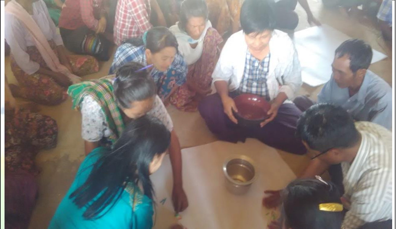
ကော်မတီရွေးချယ်ရန် မဲရေတွက်နေစဉ်