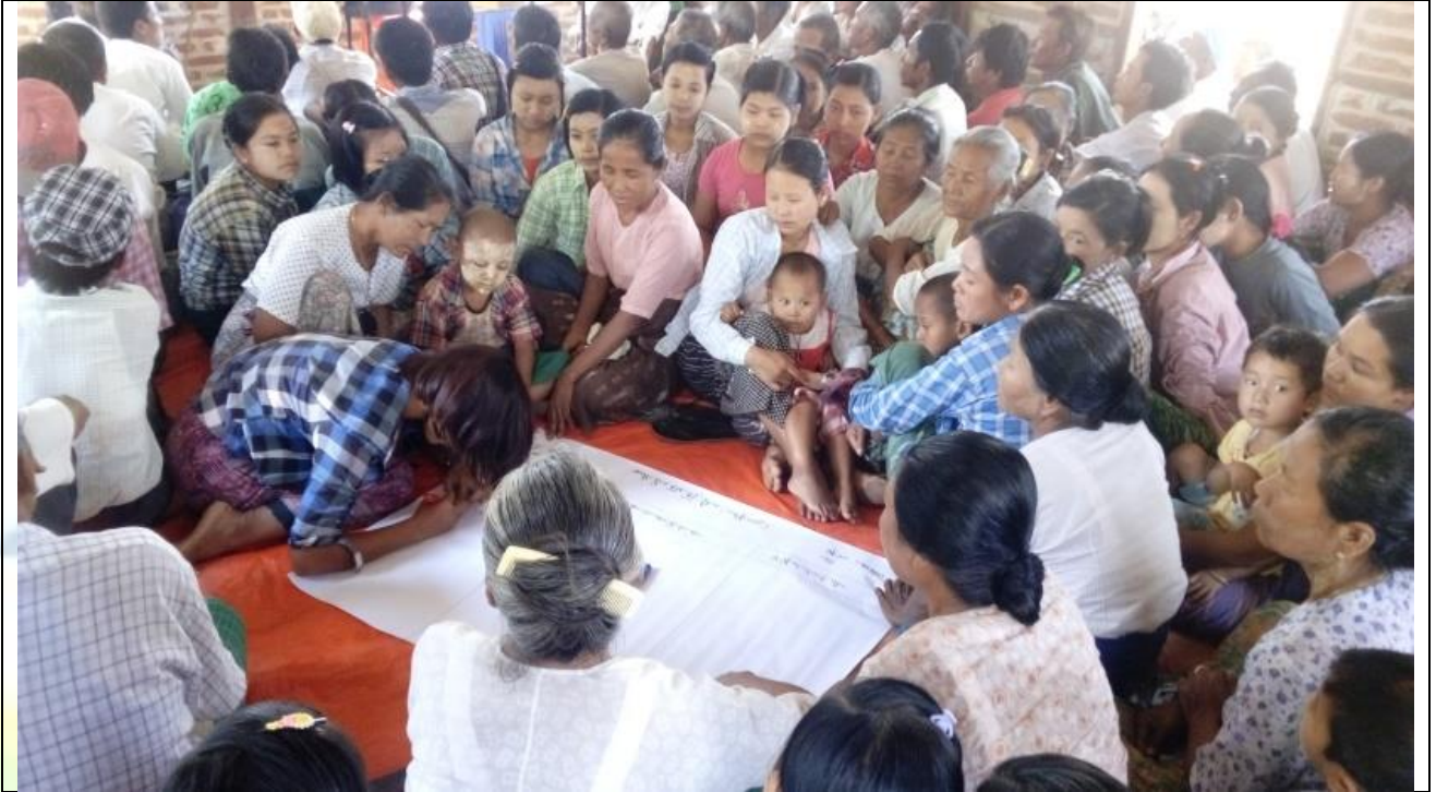
ကျေးရွာလုပ်ငန်းခွဲအတွက်အခက်အခဲများဖော်ထုတ်ဆွေးနွေးစဉ်