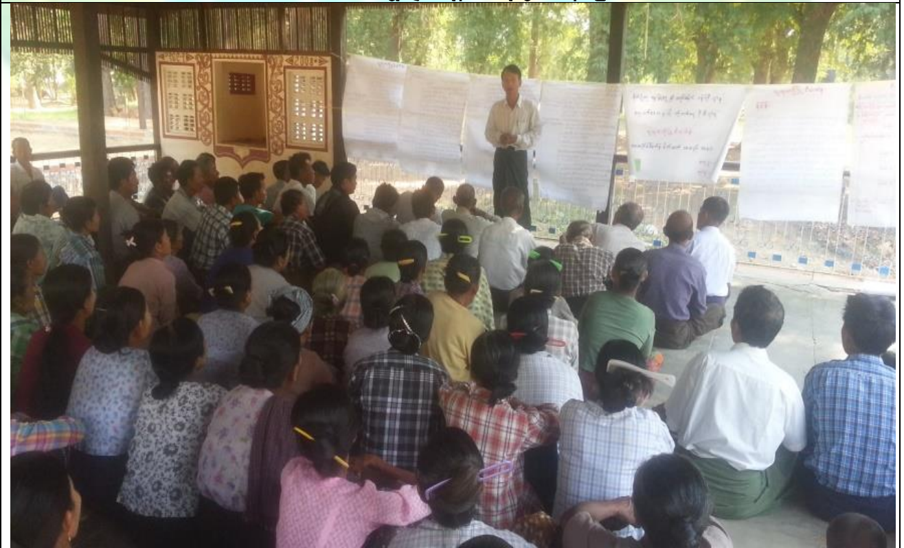
စီမံကိန်းမိတ်ဆက်အစည်းအဝေး မှတ်တမ်းဓါတ်ပုံ