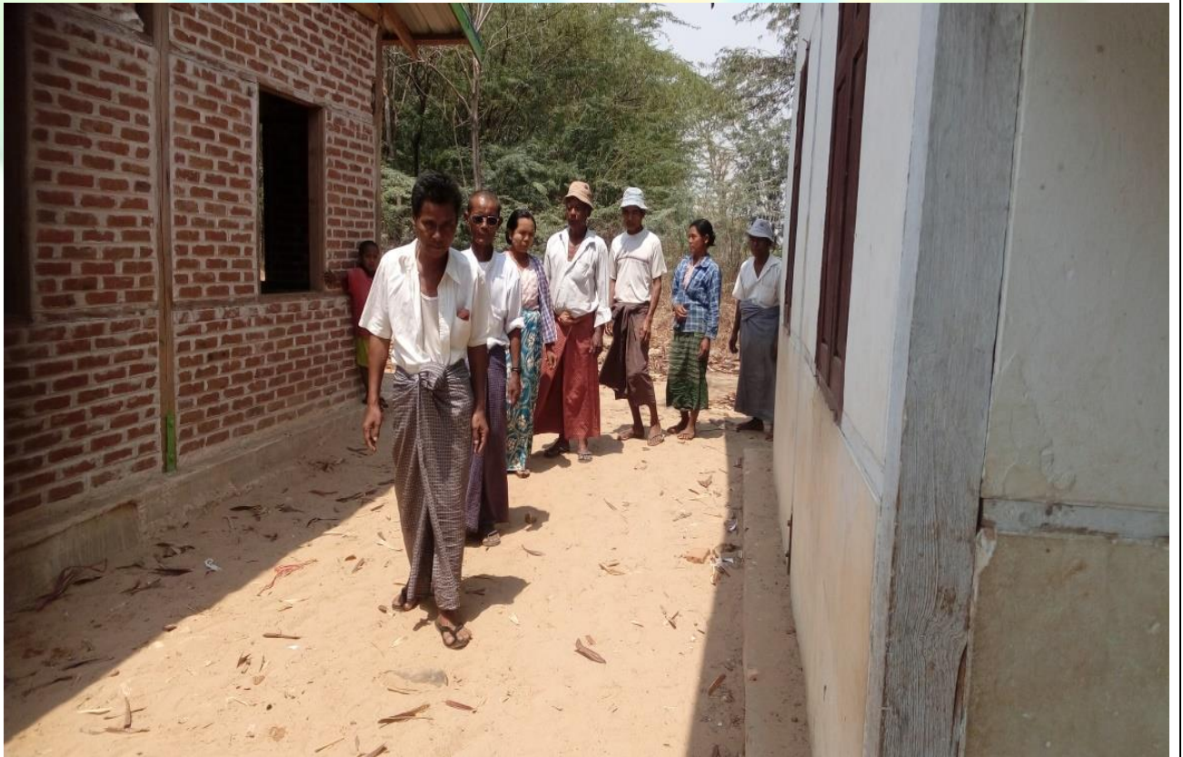
ကျေးရွာဖွံ့ဖြိုးရေးဦးစားပေးမဲပေးရန်တန်းစီနေကြစဉ်