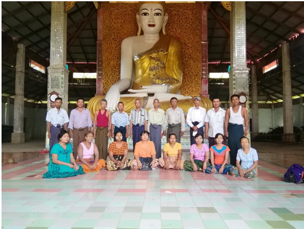
ခြောက်ရွာကျေးရွာအုပ်စု၊ ခြောက်ရွာကျေးရွာ ၂၀၁၉/၂၀၂၀-ခုနှစ်

National Community Driven Development Project လူထုပဟိုပြုစီမံကိန်း ( ဒုတိယနှစ်စက်ဝန်း ) အင်္ဂပူမြို့နယ် ၊ ဧရာဝတီတိုင်းဒေသကြီး ကျေးရွာဖွံ့ဖြိုးရေးအစီအစဉ်