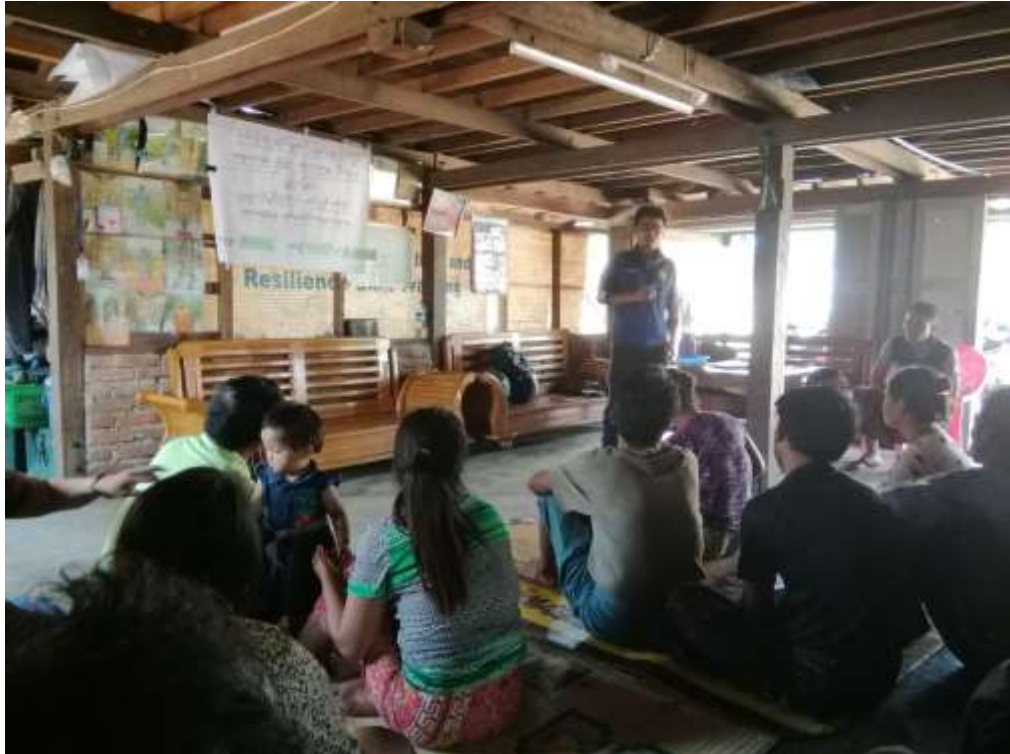
ပထမအကြိမ် ကျေးရွာစီမံကိန်းမိတ်ဆက်အစည်းအဝေး ဆောင်ရွက်ပုံ