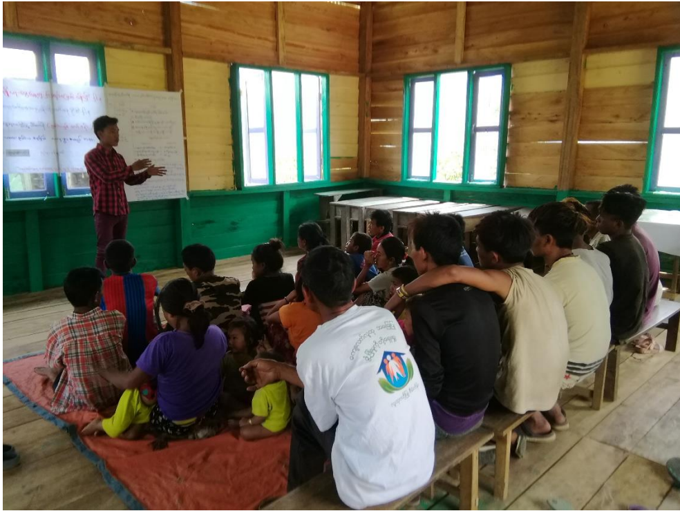
PRA Tools ဆောင်ရွက်နေမှုမှတ်တမ်းများ

ပထမအကြိမ် မိတ်ဆက် အစည်းအဝေးဆောင်ရွက်နေသည့် မှတ်တမ်းခါတ်ပုံများ