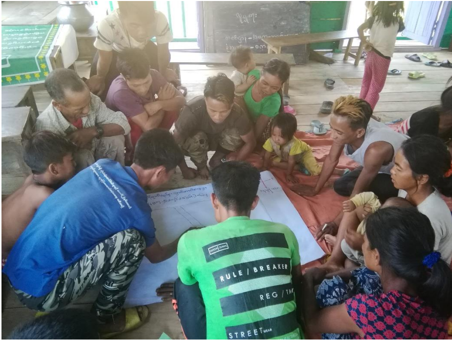
ကျေးရွာ၏အခက်အခဲပြဿနာများဆွေးနွေးမှုမှတ်တမ်း