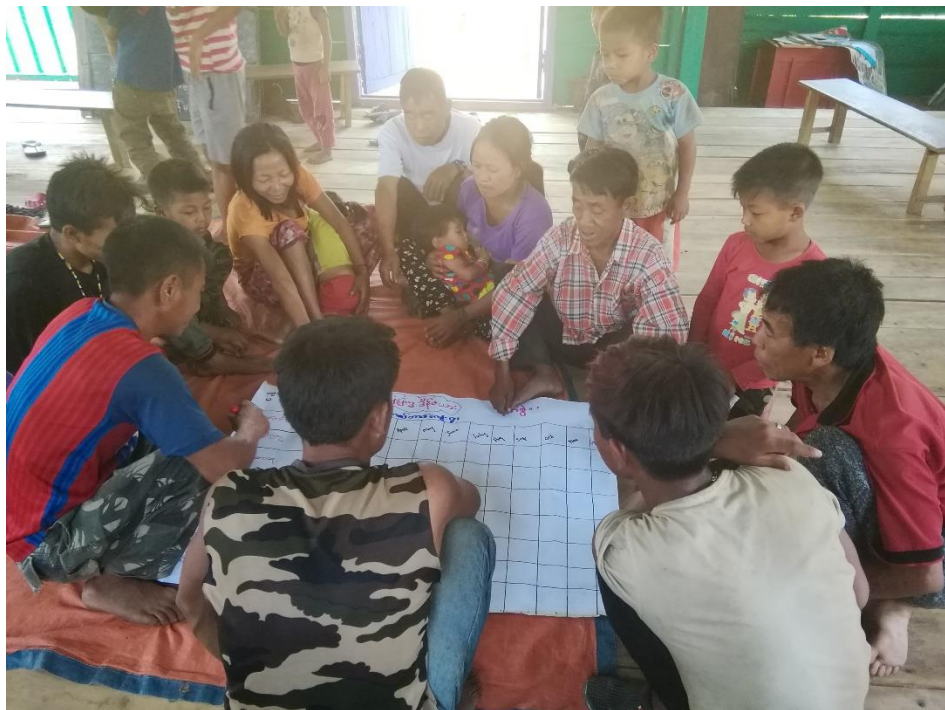
PRA Tools ဆောင်ရွက်နေမှုမှတ်တမ်းများ