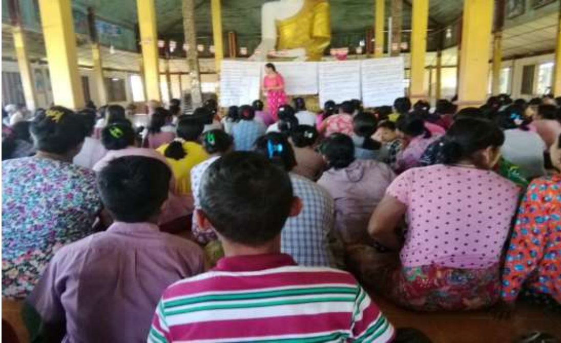
စီမံကိန်းမိတ်ဆက်အစည်းအဝေးမှတ်တမ်းတင်ဓါတ်ပုံ။

၈။ ကော်မတီဝင်များရွေးချယ်ခြင်းနှင့် ကျေးရွာဖွံ့ဖြိုးရေးအစီအစဉ် ဆောင်ရွက်မှု မှတ်တမ်းဓါတ်ပုံများ