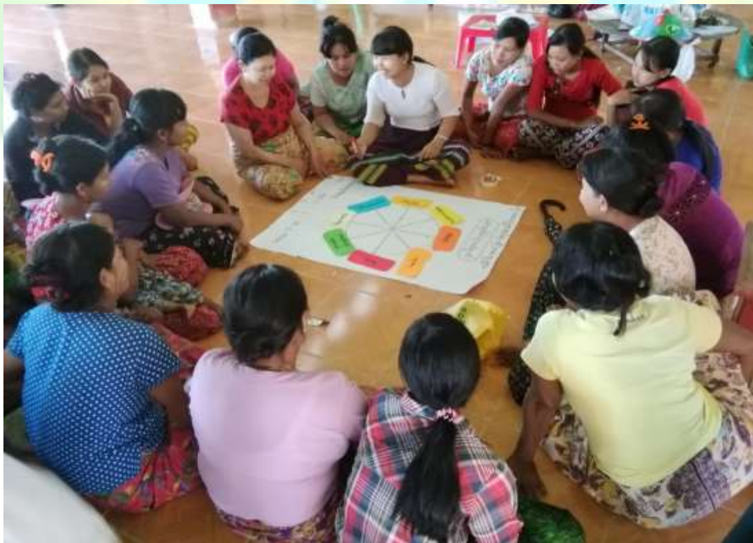
လူမှုဆန်းစစ်ခြင်း အစည်းအဝေးမှတ်တမ်းတင်ဓါတ်ပုံ။