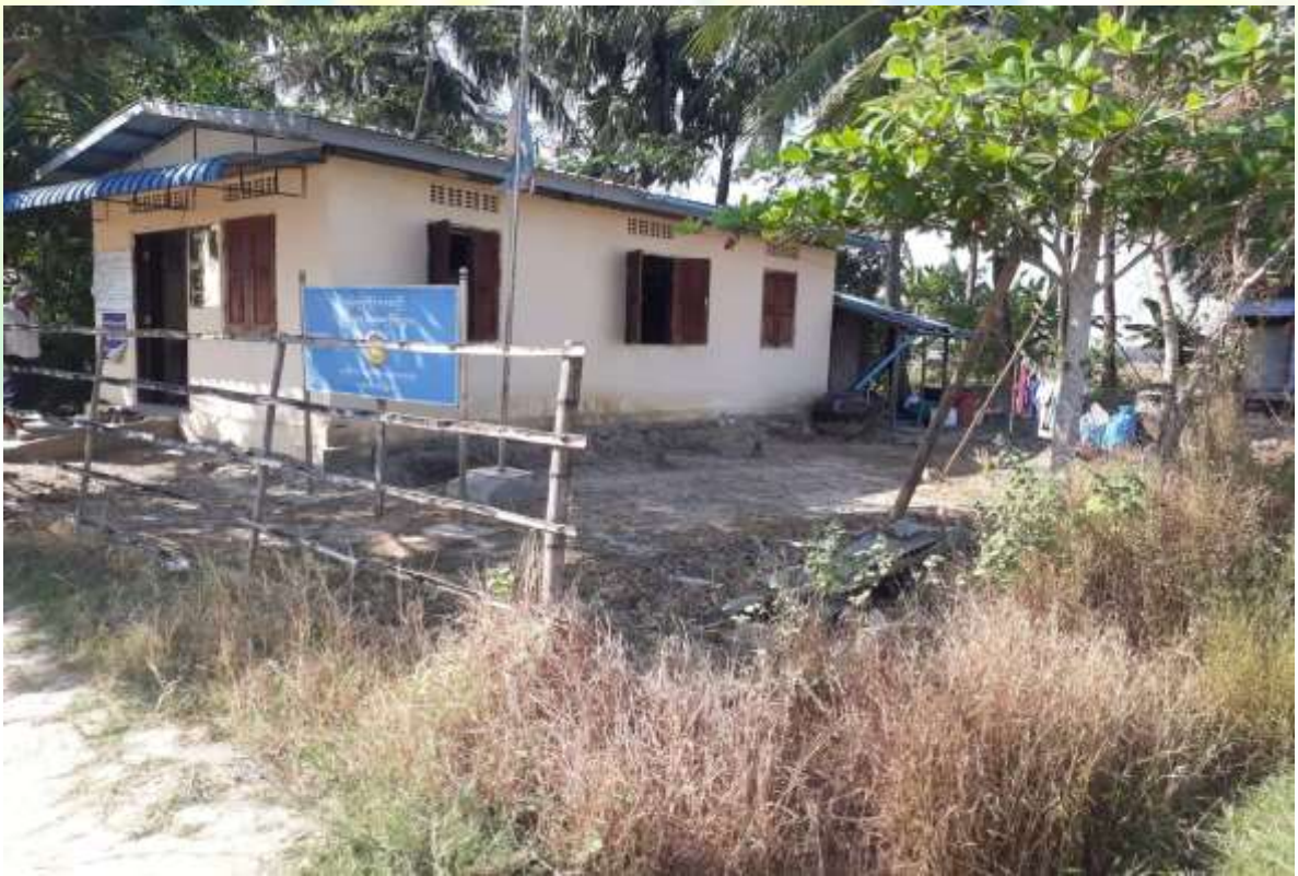
စီမံကိန်းလုပ်ငန်း မစတင်မှီ မှတ်တမ်းတင်ဓာတ်ပုံ။