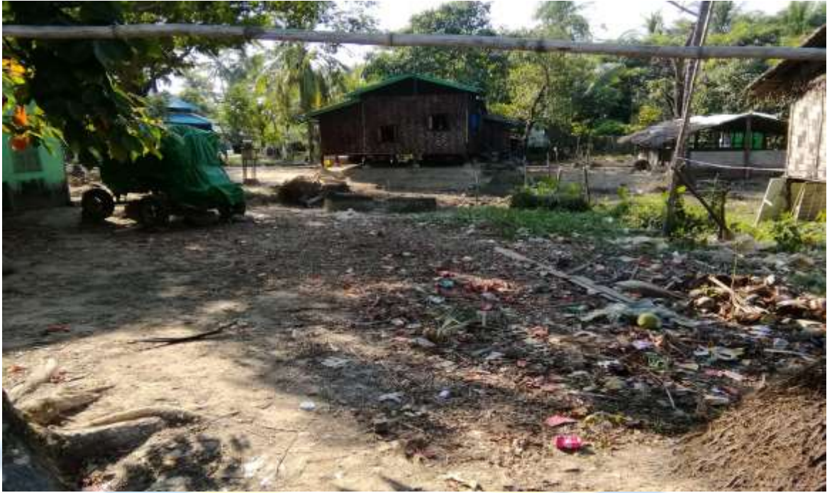
စီမံကိန်းလုပ်ငန်း မစတင်မှီ မှတ်တမ်းတင်ဓာတ်ပုံ။