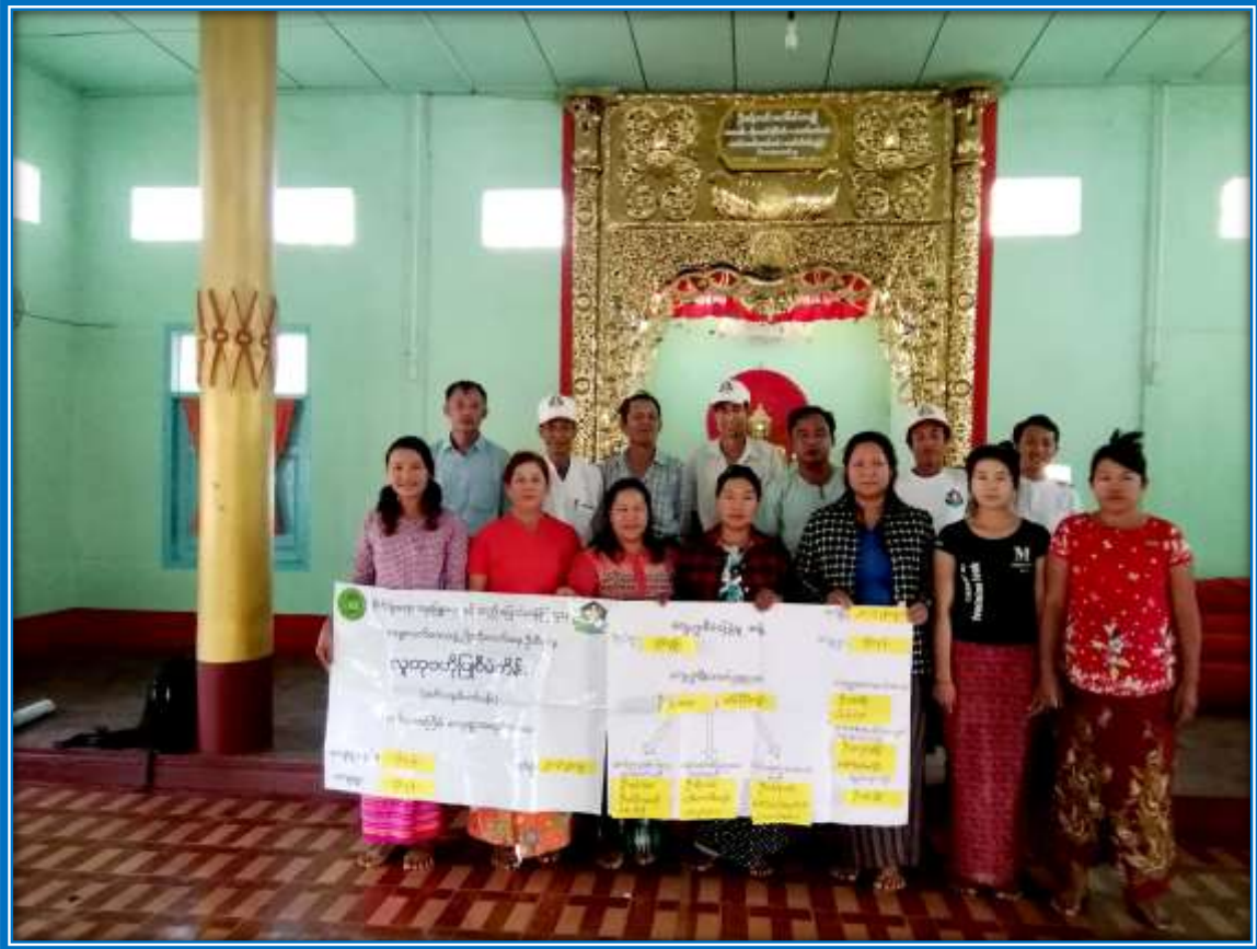
၇။ ကော်မတီဝင်များရွေးချယ်ခြင်းနှင့် ကျေးရွာဖွံ့ဖြိုးရေးအစီအစဉ်ဆောင်ရွက်မှု မှတ်တမ်းဓာတ်ပုံများ