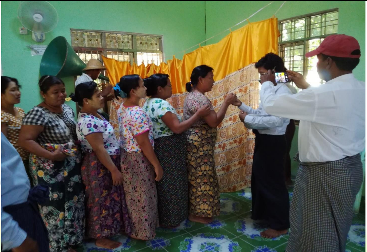
ကော်မတီရွေးချယ်ခြင်း မှတ်တမ်းဓာတ်ပုံ