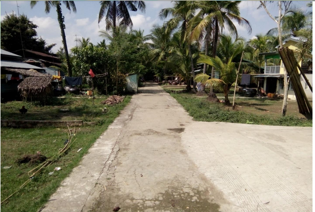
လုပ်ငန်းခွဲ၏မပြုလုပ်မီမှတ်တမ်းဓာတ်ပုံ