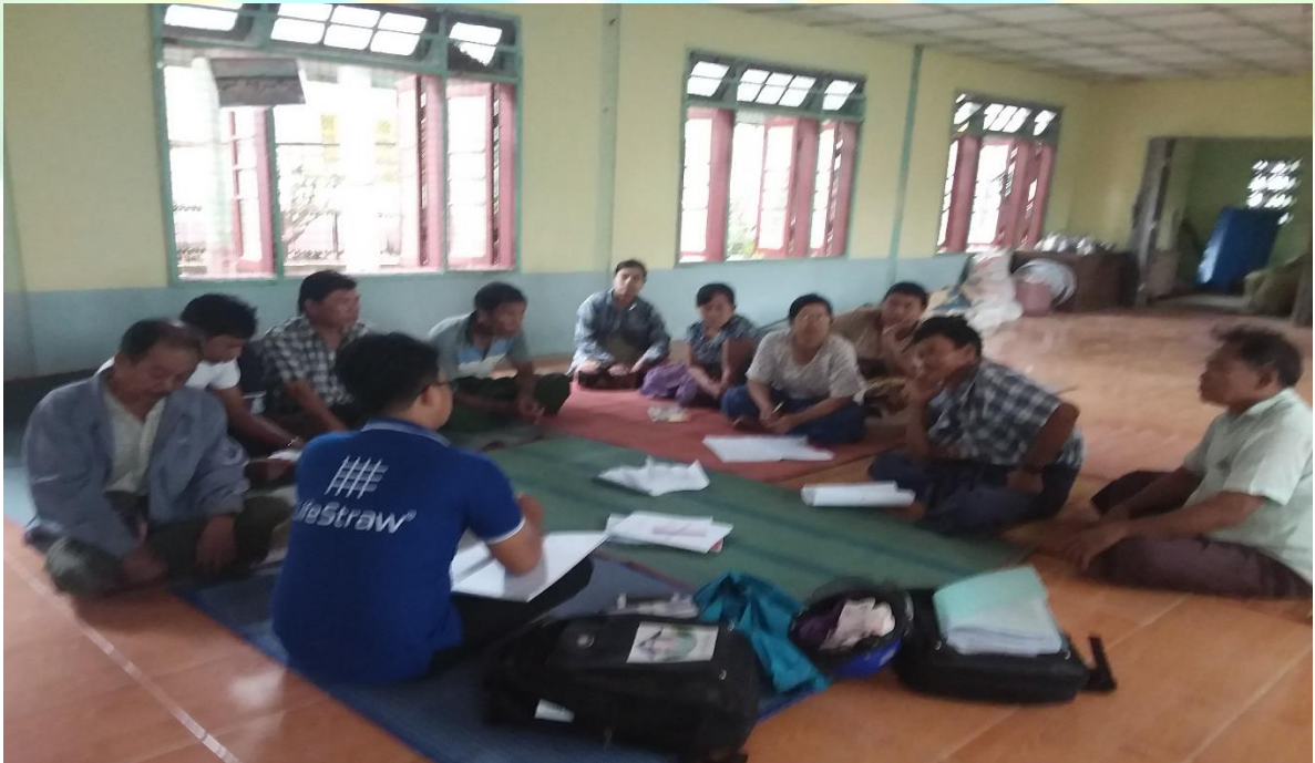
အမျိုးသား အုပ်စု မှတ်တမ်းတင်ခါတ်ပုံ။