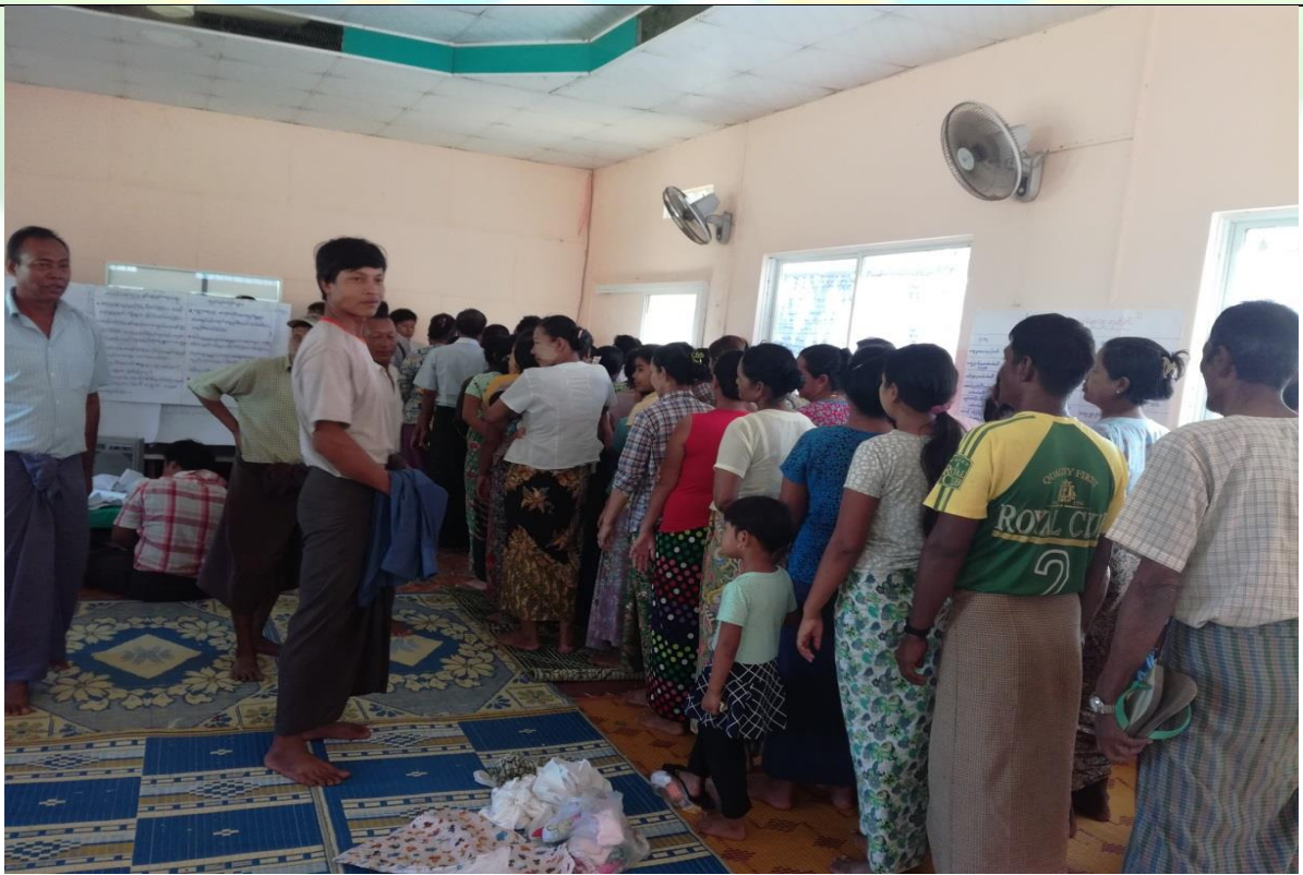
စေတနာ့ဝန်ထမ်းများ ရွေးချယ်ခြင်းမှတ်တမ်းဓာတ်ပုံ