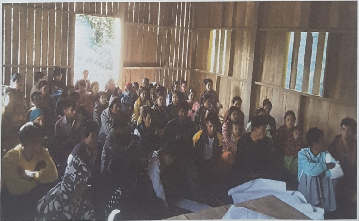
ဘီလောင်းပကျေးရွာ စီမံကိန်းမိတ်ဆက်အစည်းအဝေး