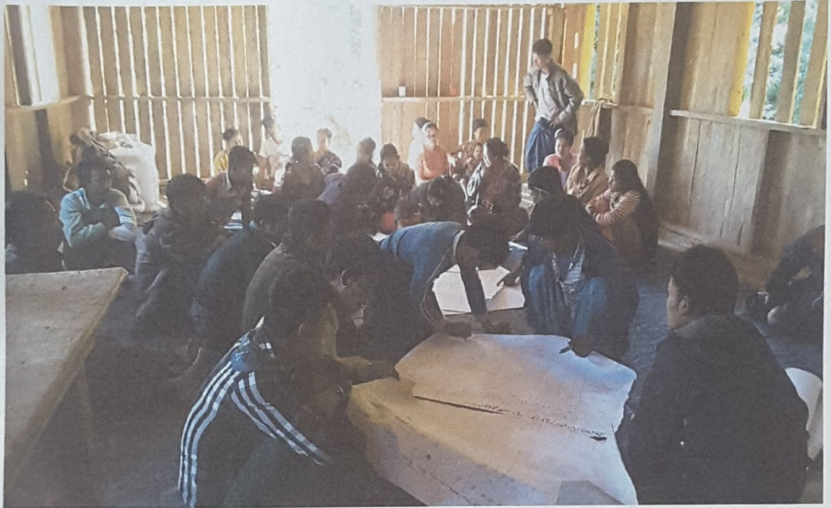
ဘီလောင်းပကျေးရွာ လူမှုဆန်းစစ်ခြင်း ရာသီခွင်ပြဇယားရေးဆွဲနေပုံ