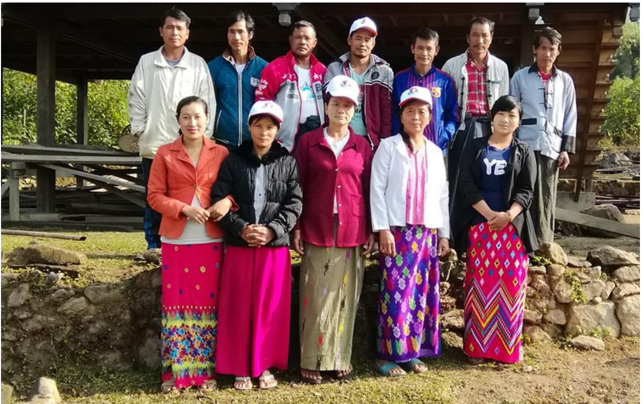
ကျေးရွာစီထောက်ကော်မတီဝင်များရွေးချယ်ဆောင်ရွက်ထားပုံ