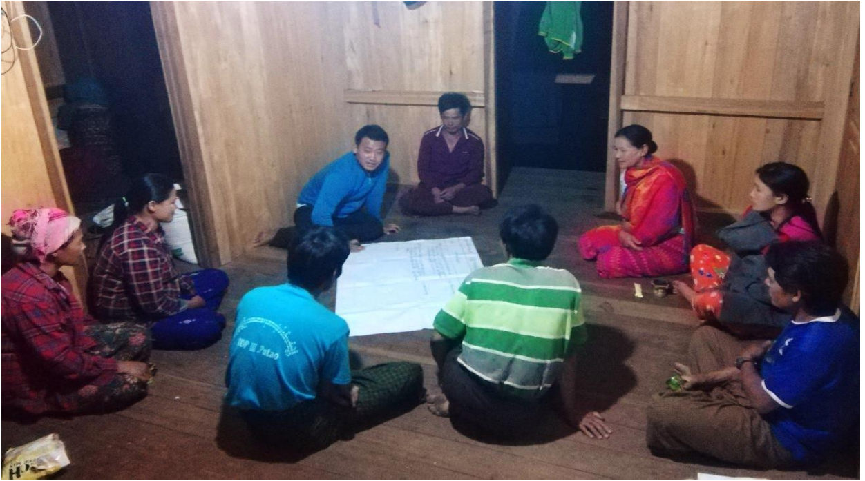
ကျေးရွာဖွံ့ဖြိုးရေးအစီအစဉ်များကိုဆွေးနွေးဆောင်ရွက်ရွက်နေပုံ