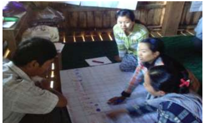
ကျေးရွာ အခက်အခဲ ပြဿနာများအား ဖော်ထုတ်ခြင်း