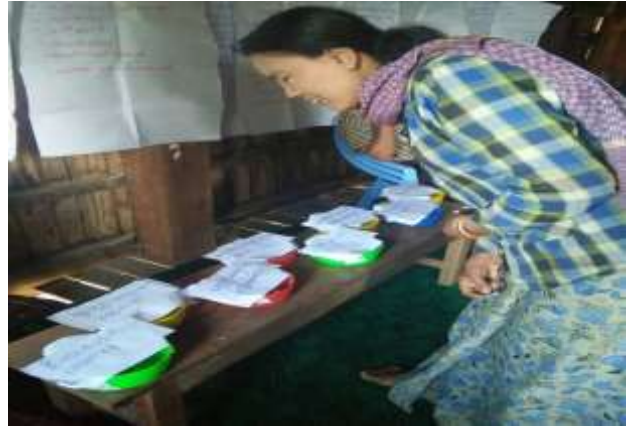
ကျေးရွာမှ ဖွံ့ဖြိုးရေး လုပ်ငန်းများအား မဲပေးရွေးချယ်ခြင်း