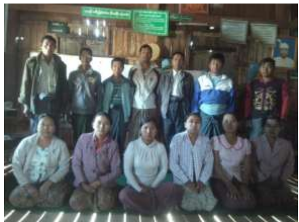
ကျေးရွာ ဖွံ့ဖြိုးရေး ကော်မတီဝင်များ