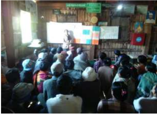
ကျေးရွာအစည်းအဝေးပြုလုပ်ခြင်း

၂၇။ ကျေးရွာ ဖွံ့ဖြိုးရေး အစီအစဉ် ဆောင်ရွက်မှု မှတ်တမ်း ဓါတ်ပုံများ