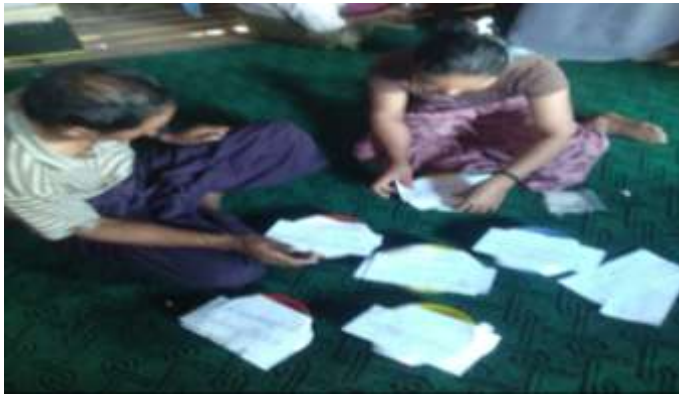
မဲများအား ရေတွက်ခြင်း