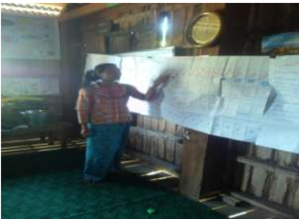
ကျေးရွာမှ ပြန်လည်တင်ပြခြင်း