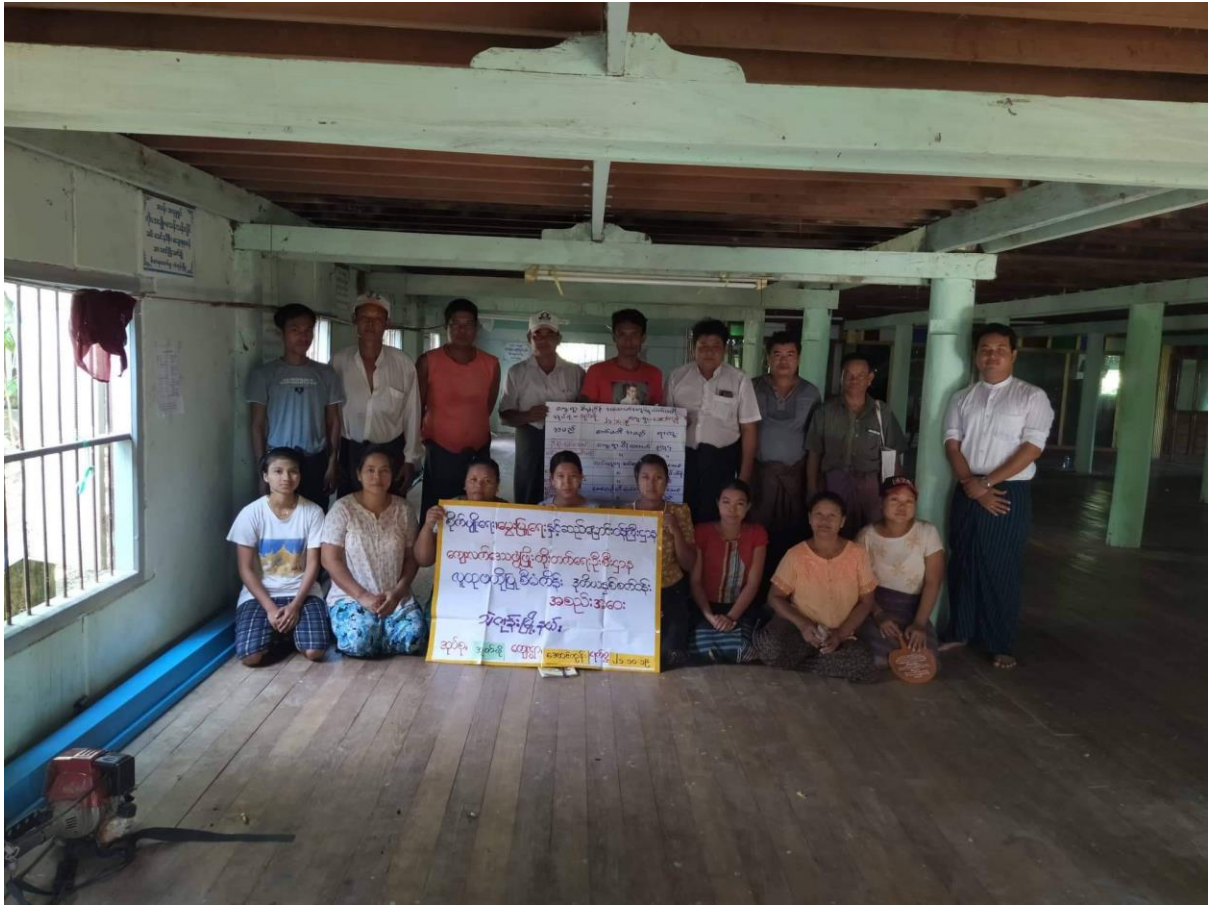
ကျေးရွာစီမံကိန်းအထောက်အကူပြု ကော်မတီဝင်များ(ဒုတိနှစ်စက်ဝန်း)