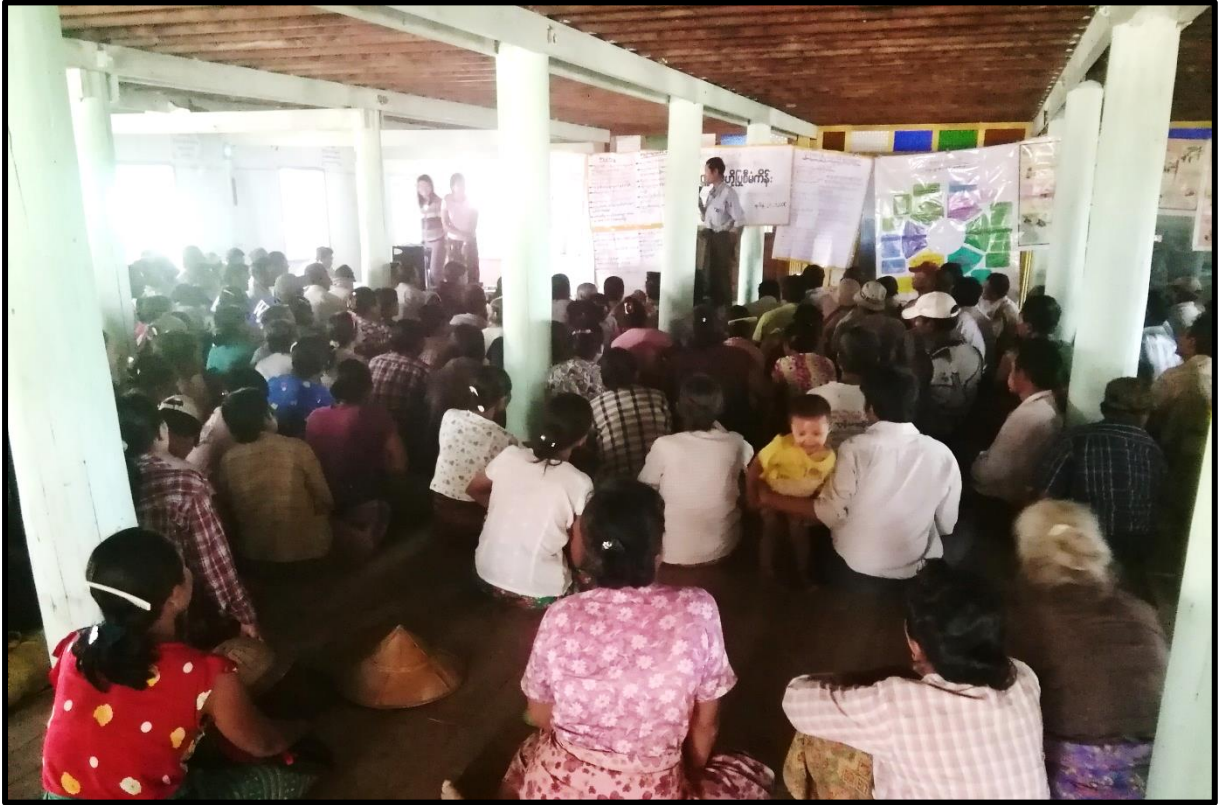
ပထမအကြိမ်အစည်းအဝေးကျင်းပဆောင်ရွက်နေပုံ