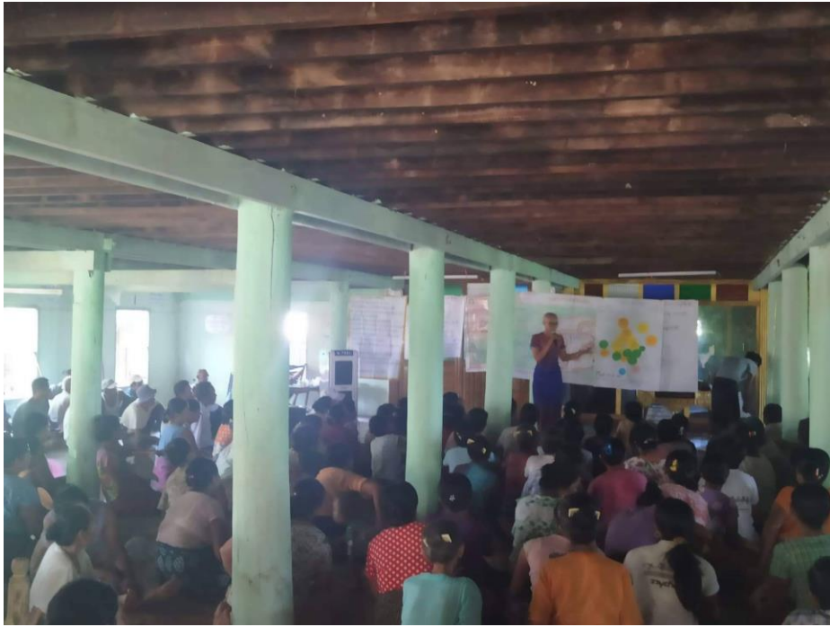
ပထမ ဒုတိယအကြိမ်အစည်းအဝေးကျင်းပဆောင်ရွက်နေပုံ(ဒုတိယနှစ်စက်ဝန်း)