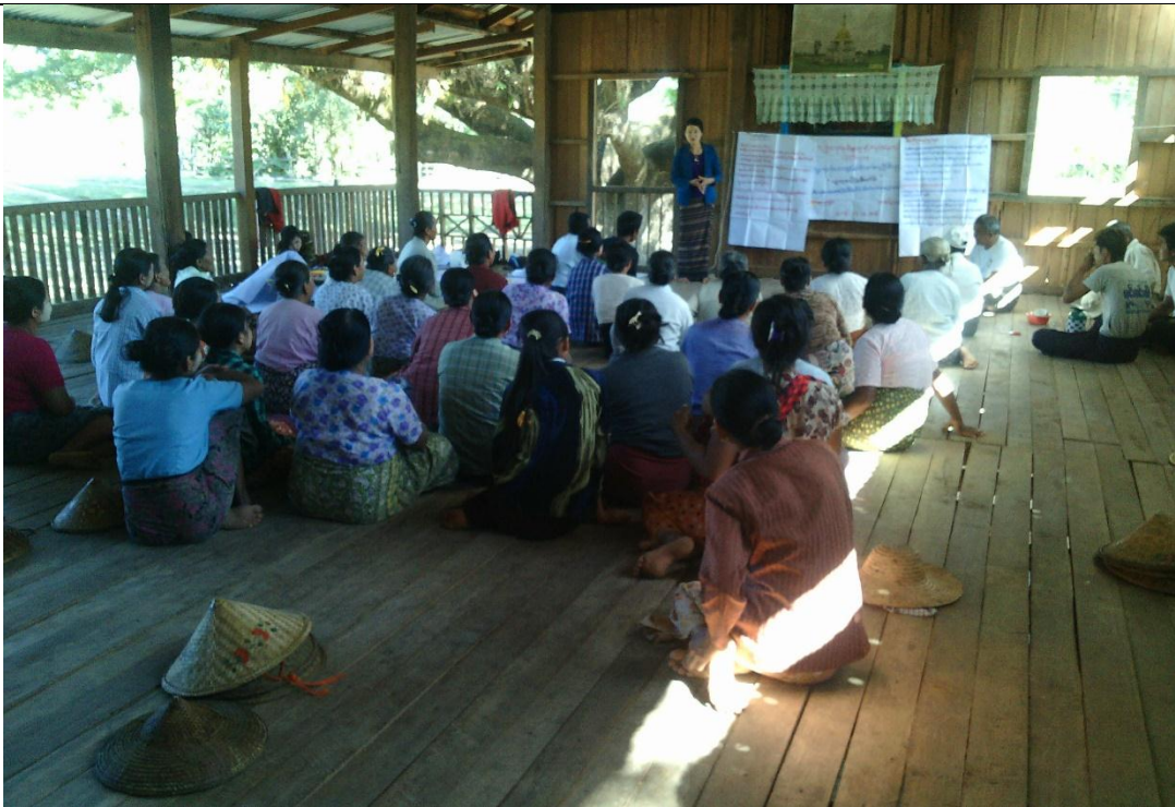
ကော်မတီရွေးချယ်ခြင်း မှတ်တမ်းဓါတ်ပုံ