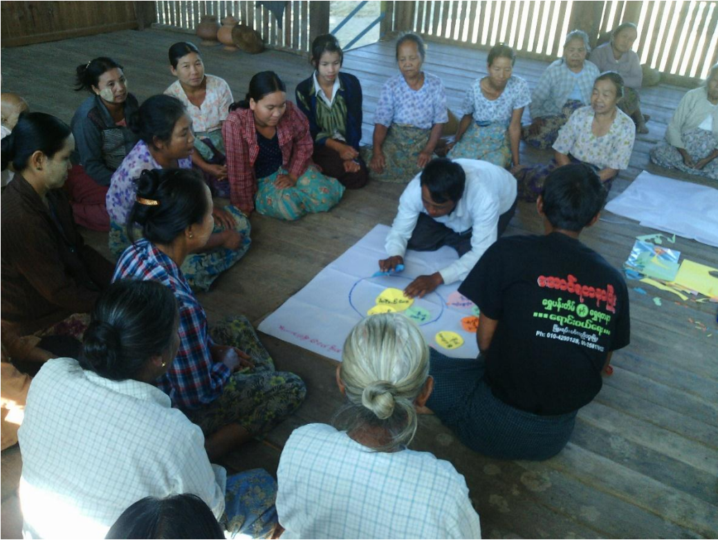
အမျိုးသား/အမျိုးသမီးအုပ်စု၏ မှတ်တမ်းခါတ်ပုံ

၇။ ကော်မတီဝင်များရွေးချယ်ခြင်းနှင့်ကျေးရွာဖွံ့ဖြိုးရေးအစီအစဉ်ဆောင်ရွက်မှုမှတ်တမ်းခါတ်ပုံများ