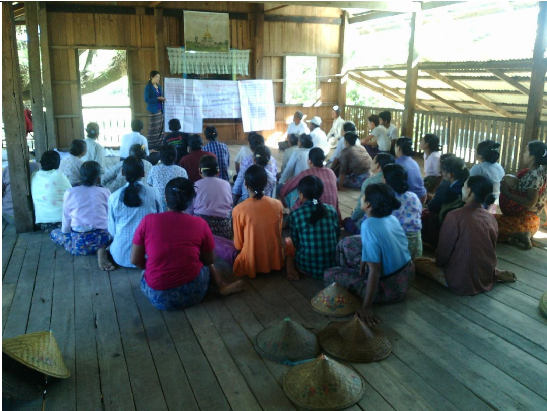
စေတနာ့ဝန်ထမ်းများ ရွေးချယ်ခြင်း မှတ်တမ်းဓါတ်ပုံ