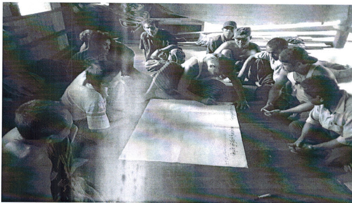
ကော်မတီဝင်များရွေးချယ်ခြင်းနှင့်ကျေးရွာဖွံ့ဖြိုးရေးအစီအစဉ်ဆောင်ရွက်မှုမှတ်တမ်းဓာတ်ပုံများ