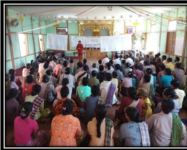
ကျေးရွာအစည်းအဝေး

၇။ ကျေးရွာကော်မတီရွေးချယ်ခြင်းနှင့် ကျေးရွာ ဖွံ့ဖြိုးရေး အစီအစဉ် ဆောင်ရွက်မှု မှတ်တမ်း ဓါတ်ပုံများ