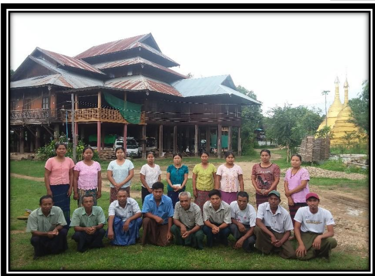
ကျေးရွာစီမံခန့်ခွဲမှုကော်မတီဝင်များ