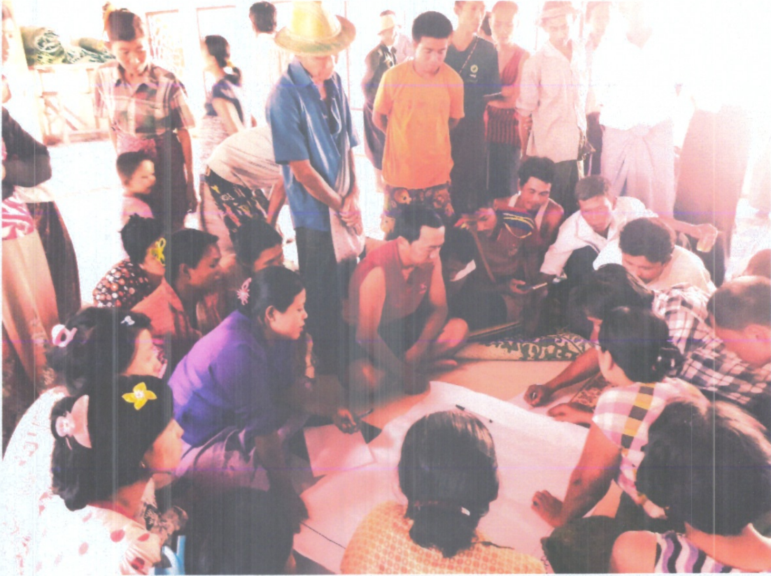
အမျိုးသား၊ အမျိုးသမီးများပူးပေါင်းပါဝင်သော လူမှုဆန်းစစ်ခြင်း