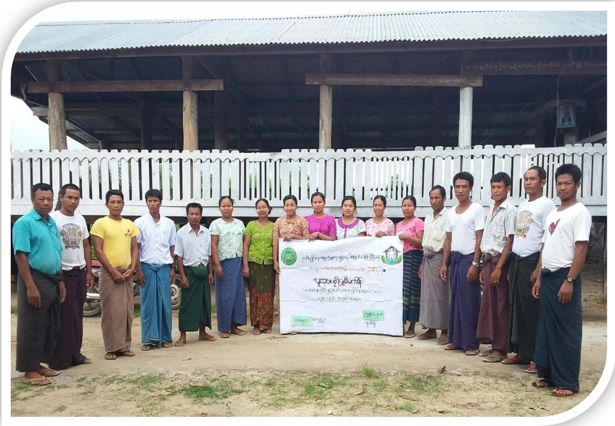
ရှမ်းပြည်နယ် (မြောက်ပိုင်း )