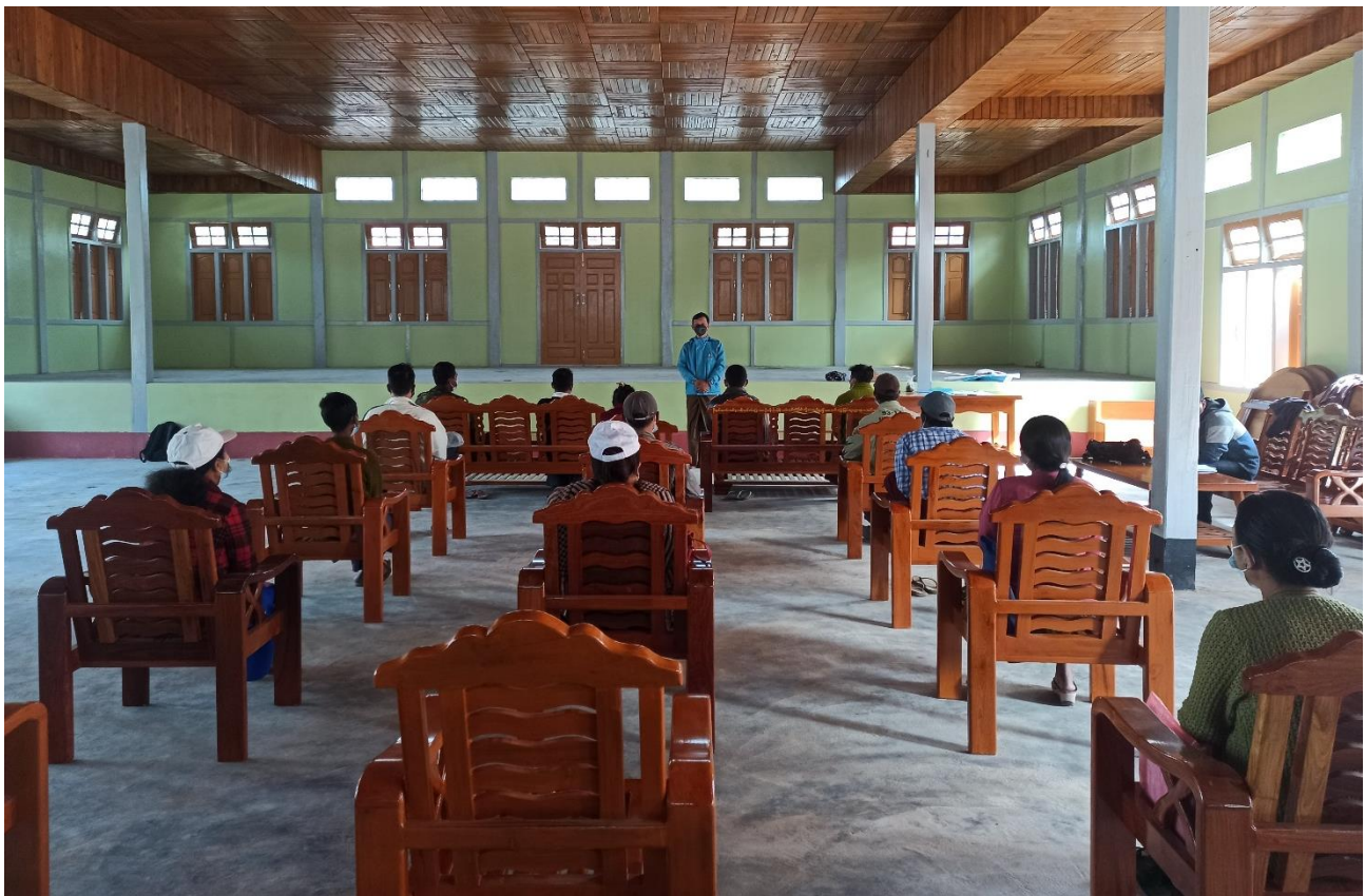
ရှမ်းပြည်နယ် (မြောက်ပိုင်း )