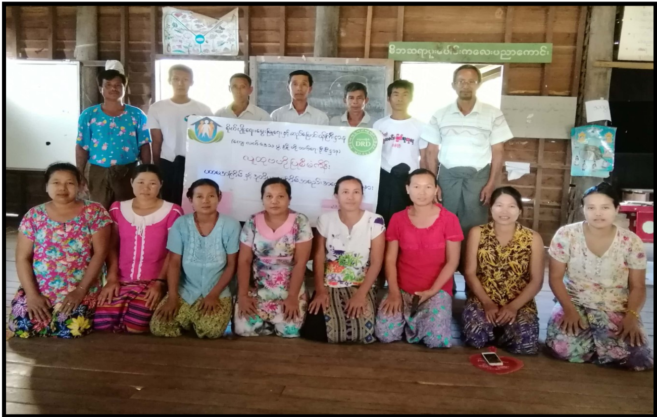
ကဏ္ဍအလိုက်လုပ်ငန်းအချုပ်ဇယား