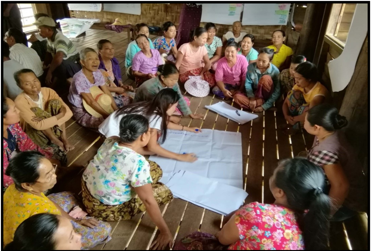
ရှမ်းပြည်နယ် (မြောက်ပိုင်း )