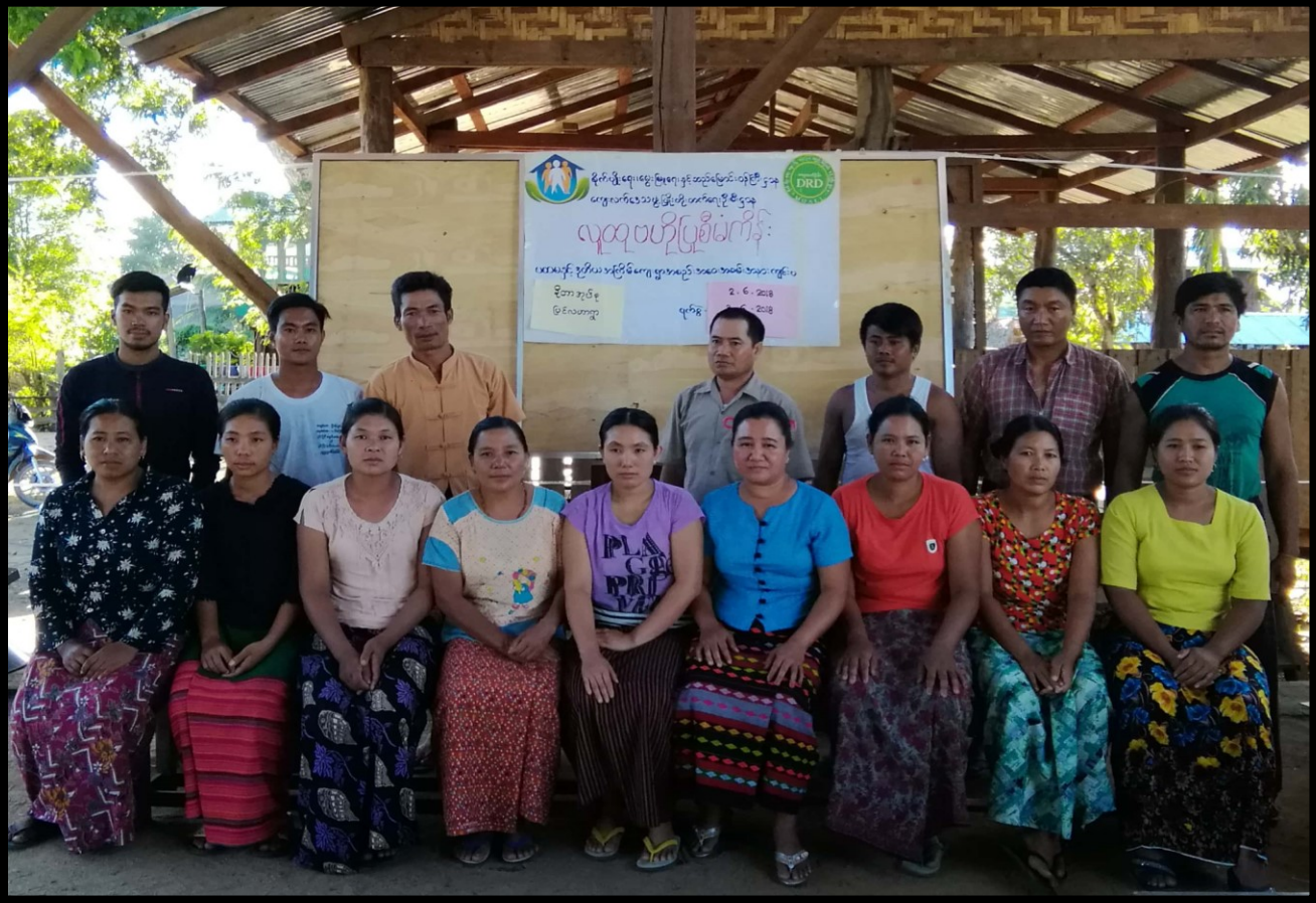
ရှမ်းပြည်နယ် (မြောက်ပိုင်း )