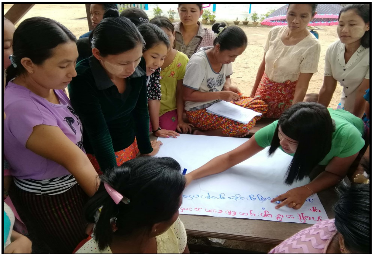
ရှမ်းပြည်နယ် (မြောက်ပိုင်း )