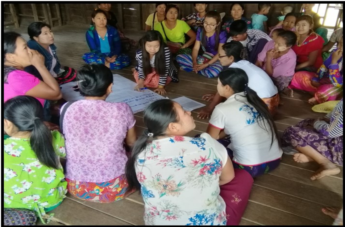
ရှမ်းပြည်နယ် (မြောက်ပိုင်း )