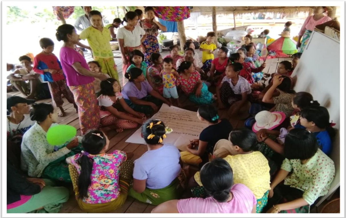
၂၀၂၁ ခုနှစ်