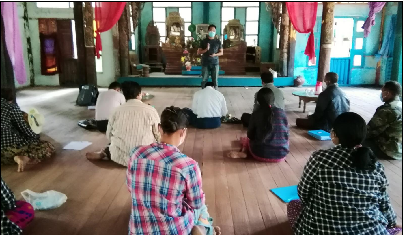
ရှမ်းပြည်နယ် (မြောက်ပိုင်း )