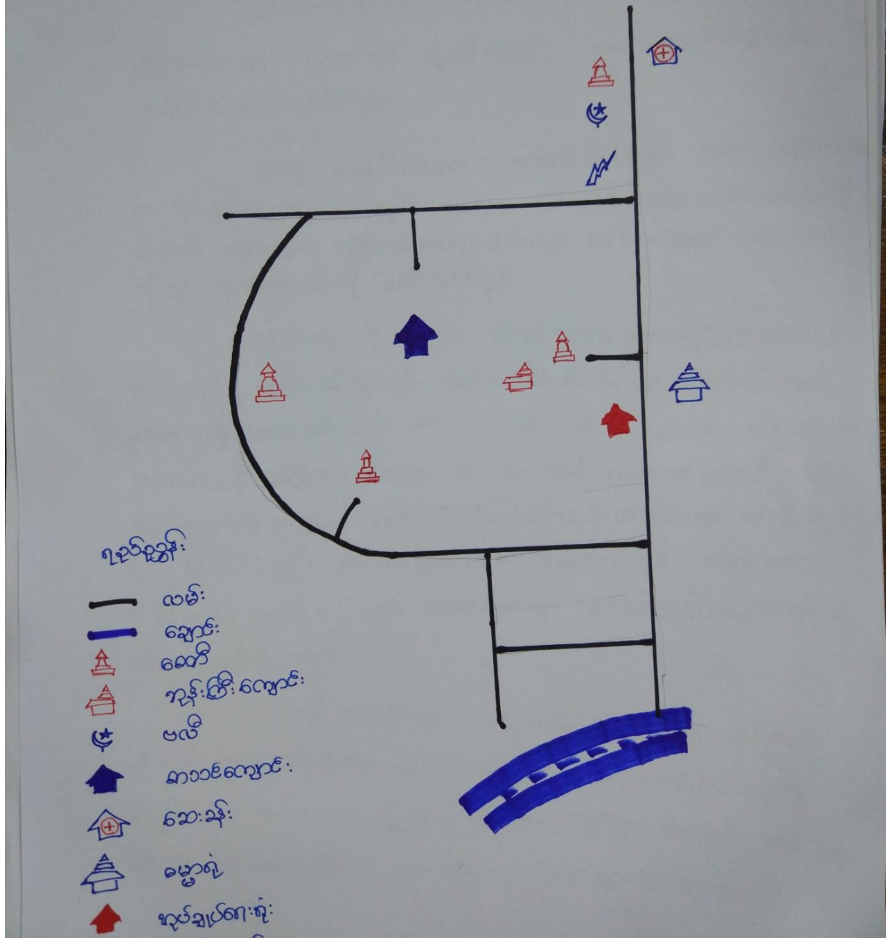
ကော့ကရင်ကျေးရွာ၊ ကော့ကရင်ကျေးရွာအုပ်စု

ကော့ကရင်ကျေးရွာခြေပုံ ကော့ကရင်ကျေးရွာအုပ်စု၊ ပေါင်မြို့နယ်