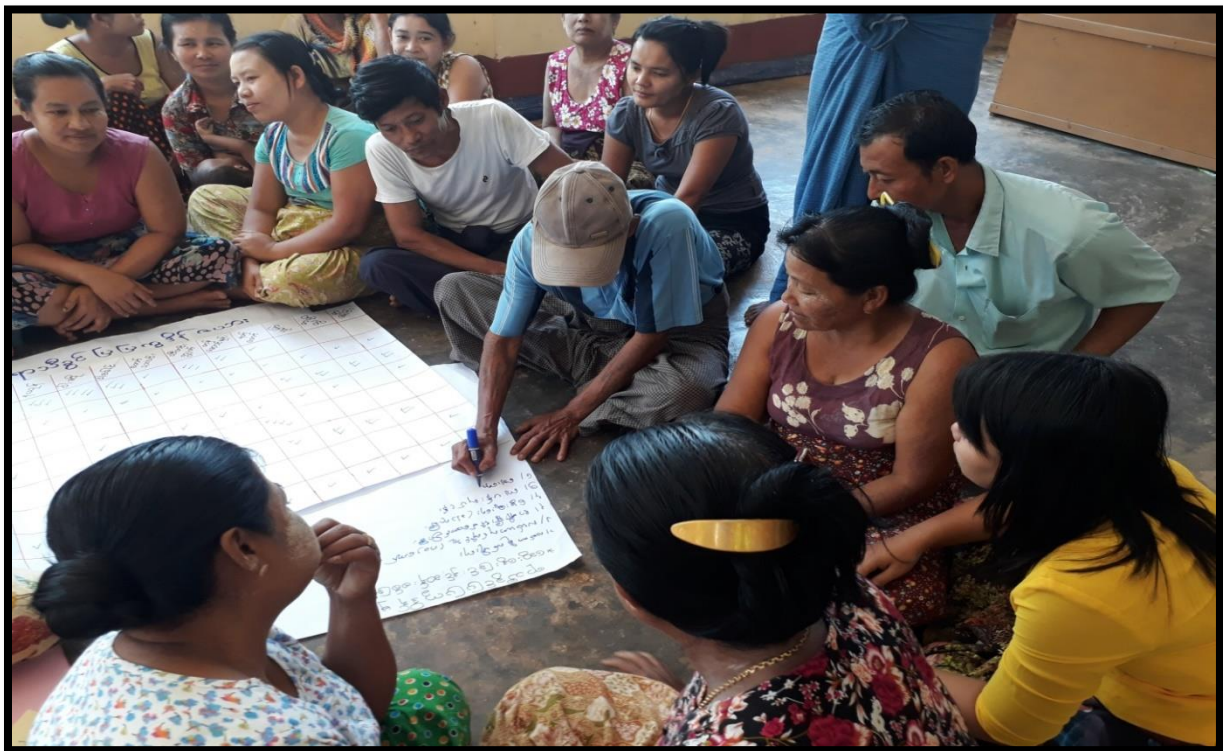
ကျေးကရင်ကျေးရွာ၊ ကျေးကရင်ကျေးရွာအုပ်စု