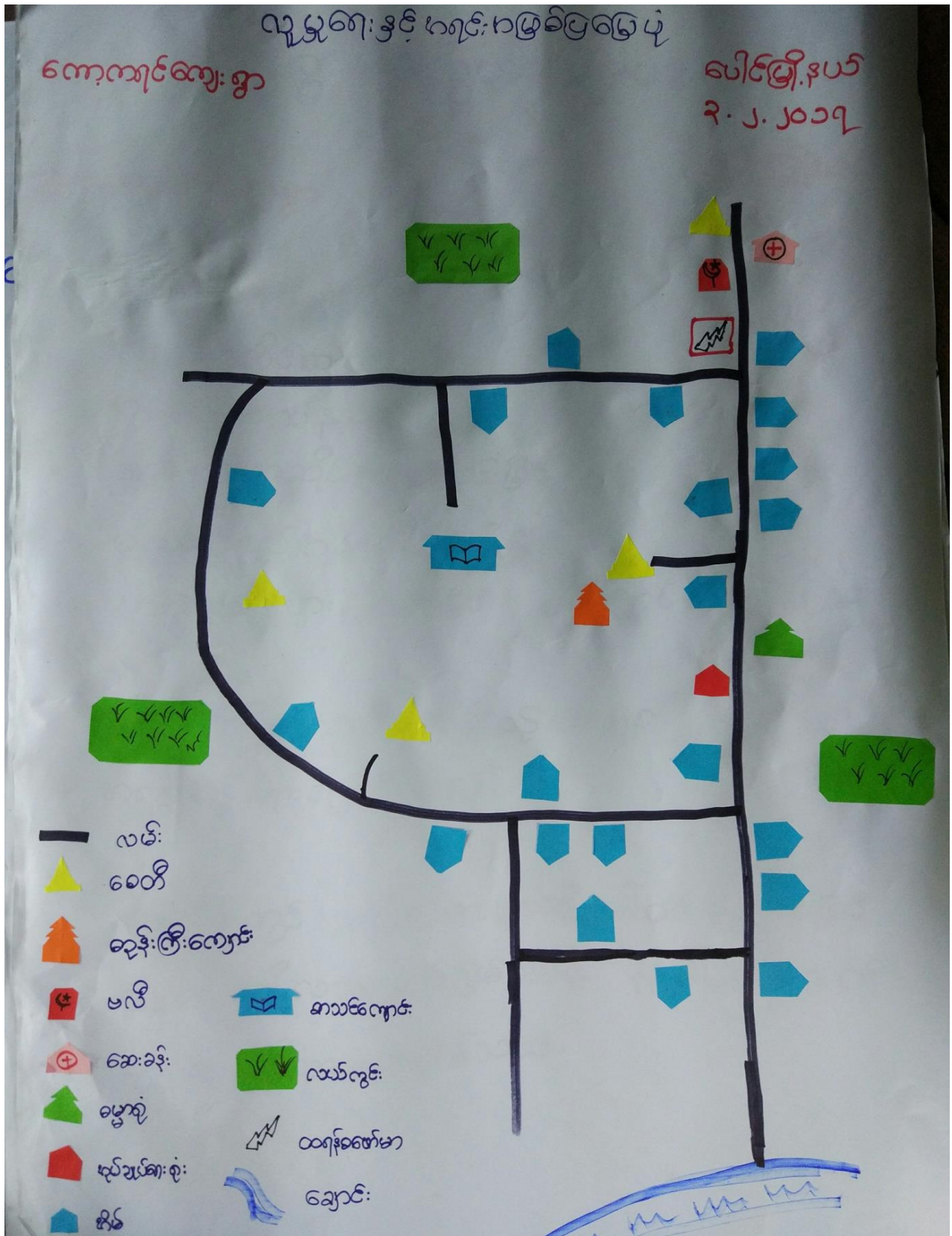
ကျေးကရင်ကျေးရွာ၊ ကျေးကရင်ကျေးရွာအုပ်စု