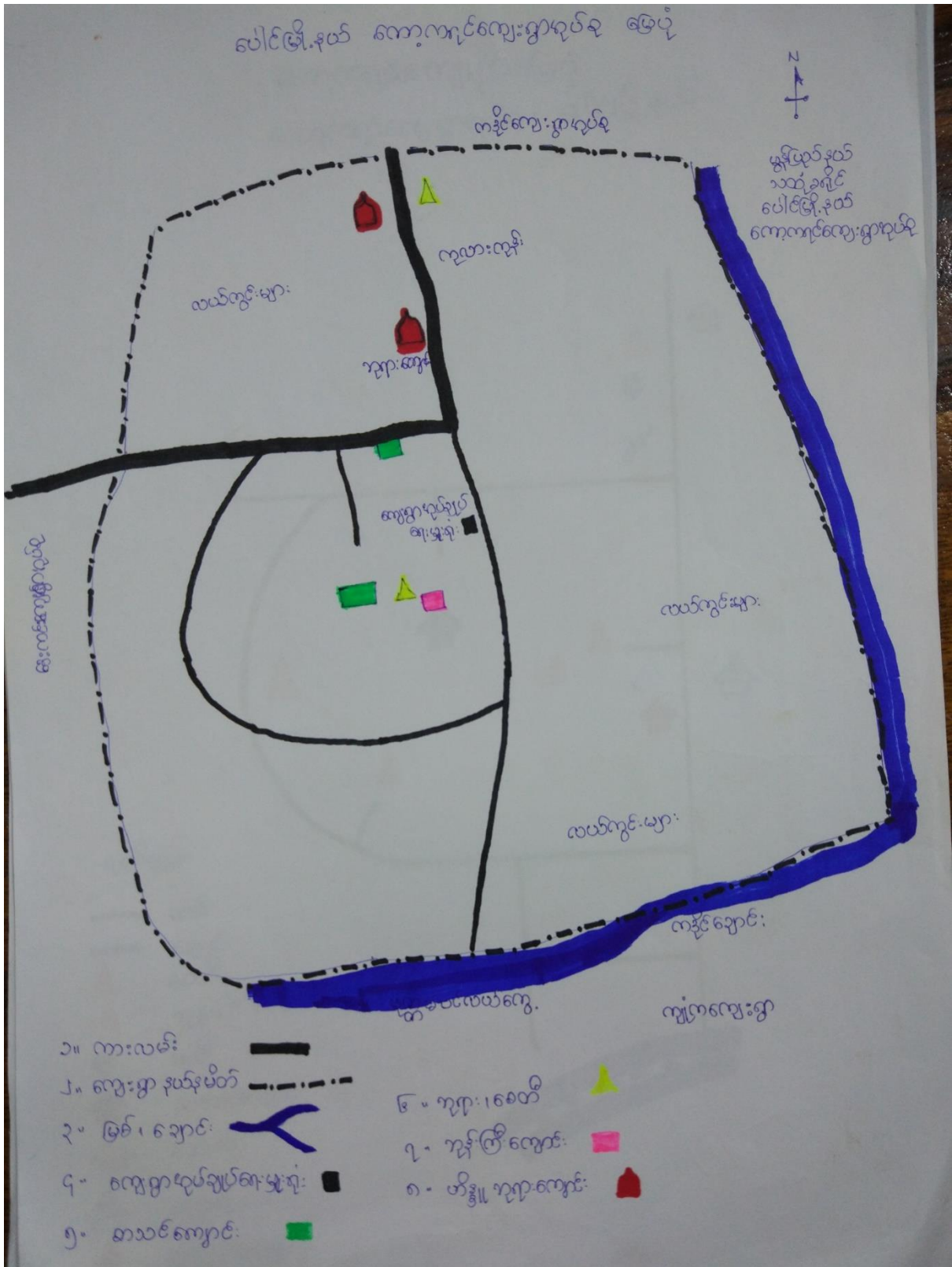
ကော့ကရင်ကျေးရွာ၊ ကော့ကရင်ကျေးရွာအုပ်စု