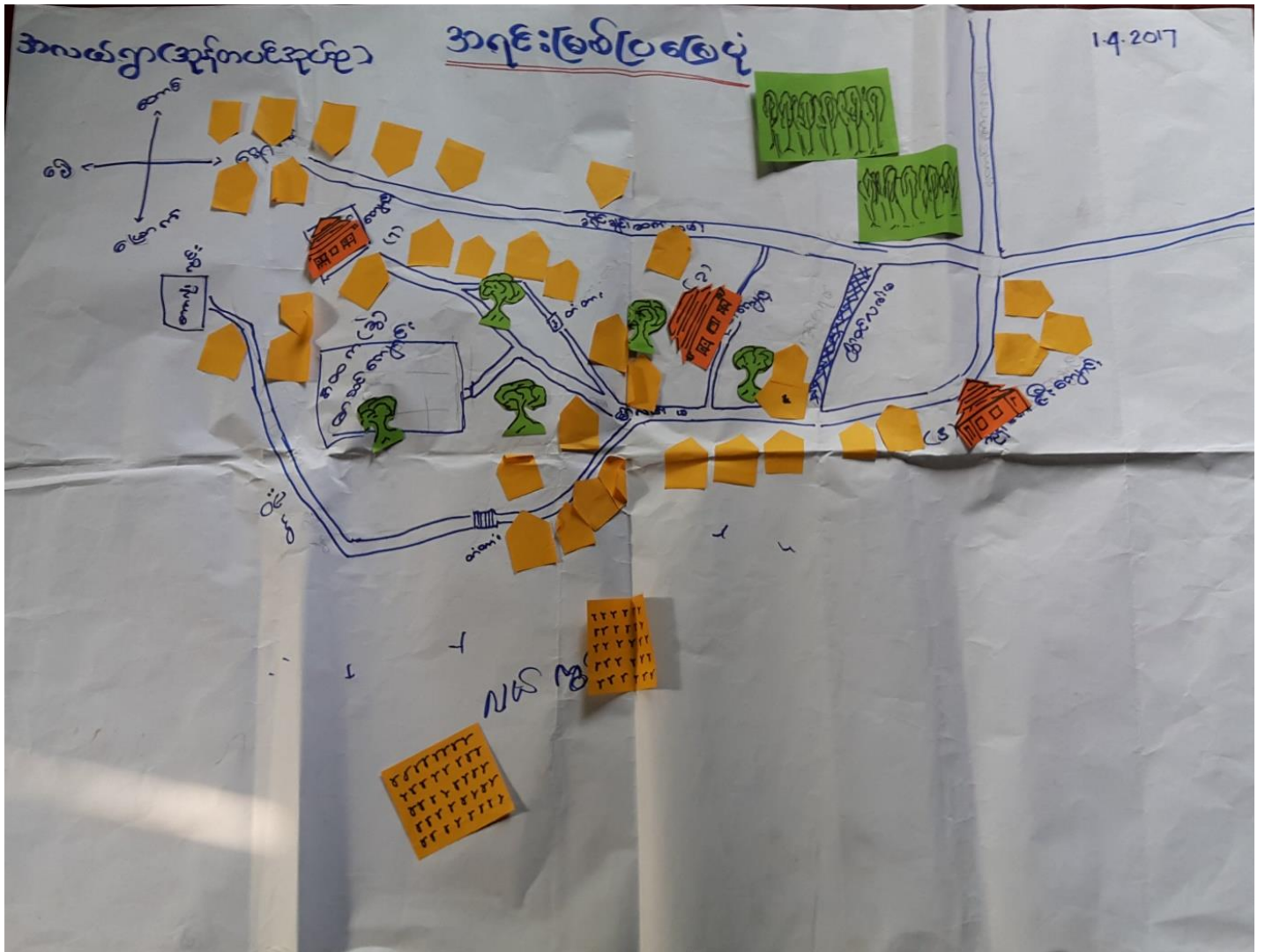
အလယ်ရွာကျေးရွာ၊ အုန်းတပင်ကျေးရွာအုပ်စု