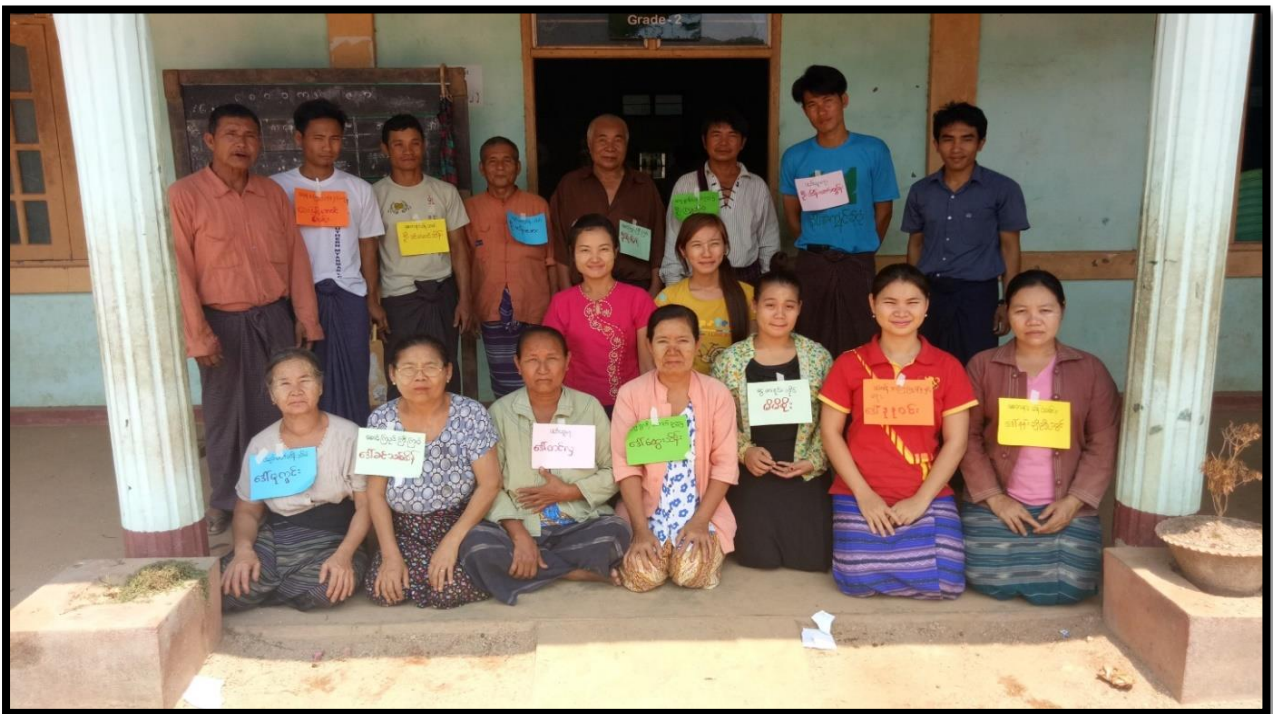
အလယ်ရွာကျေးရွာ၊ အုန်းတပင်ကျေးရွာအုပ်စု