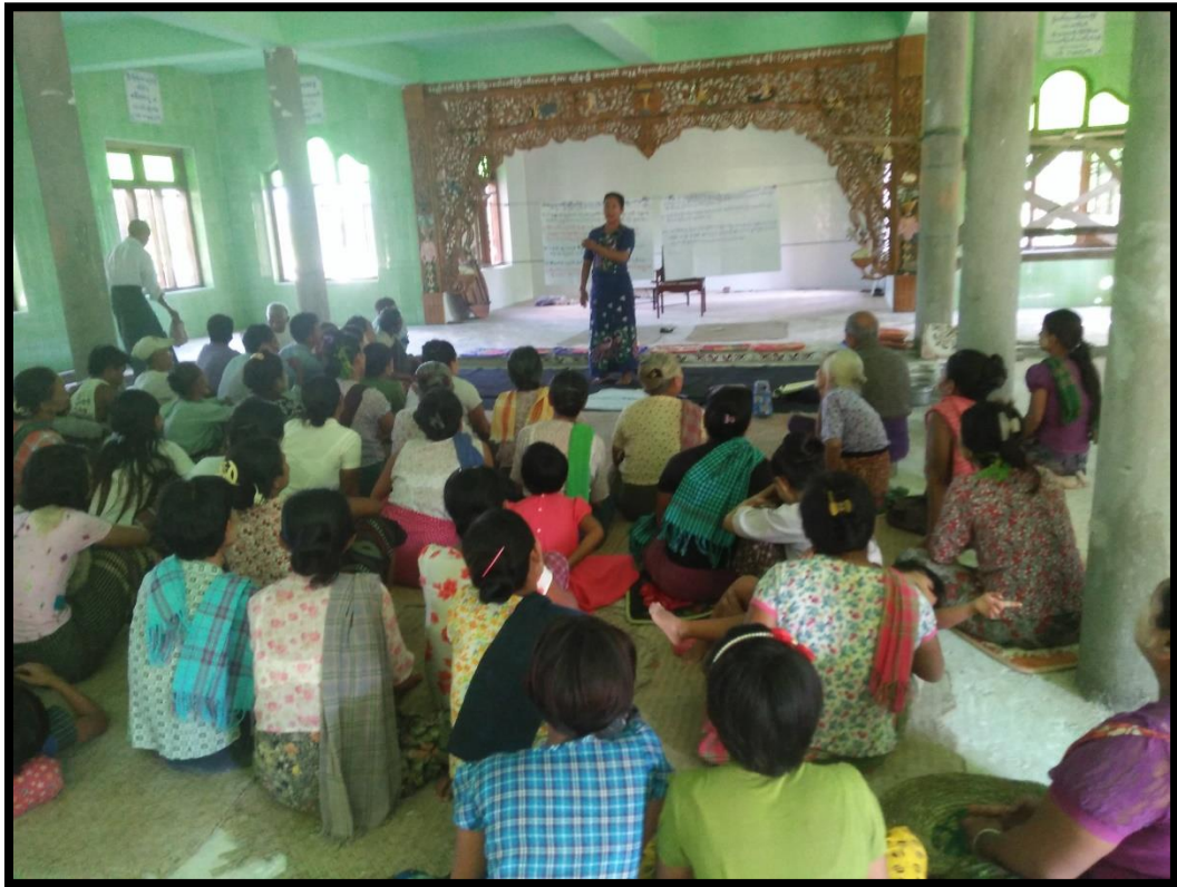
စီမံကိန်းအကြောင်းရှင်းလင်းတင်ပြနေခြင်း