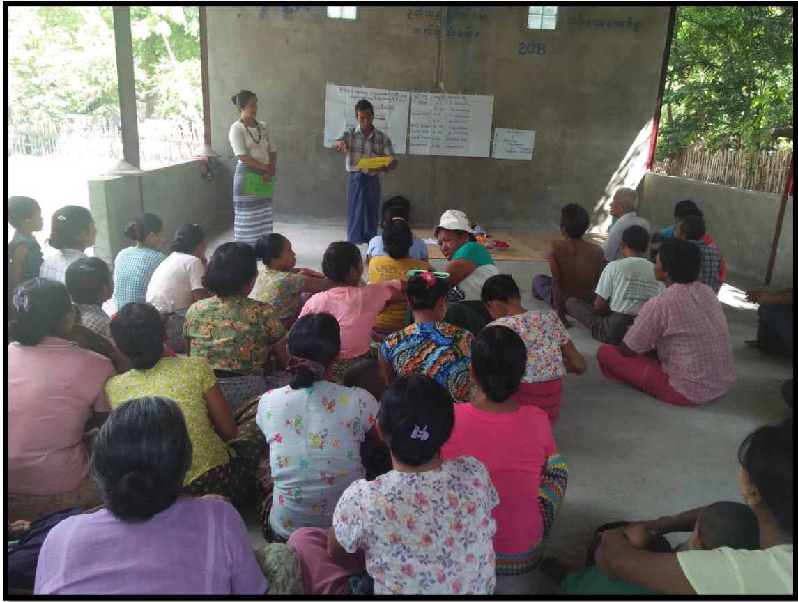
ပထမအကြိမ် ကျေးရွာအစည်းအဝေးဆောင်ရွက်မှုမှတ်တမ်း