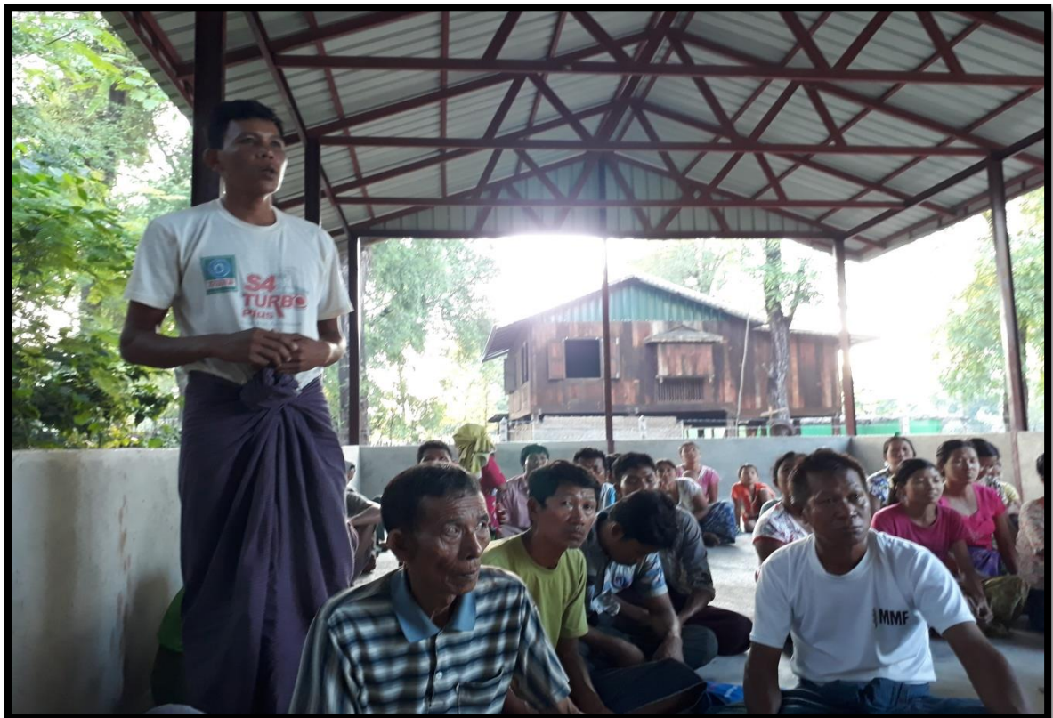
ကော်မတီဝင်များမှအတွေ့အကြုံများအားပြန်လည်ဆွေးနွေးခြင်း