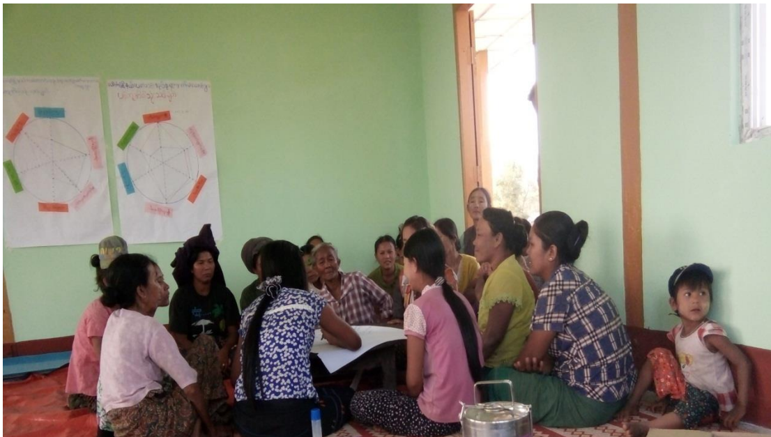
လူမှုဆန်းစစ်ခြင်းများပြုလုပ်ခြင်း