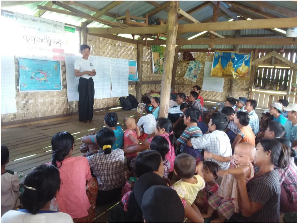
ပထမအကြိမ် ကျေးရွာအစည်းအဝေး