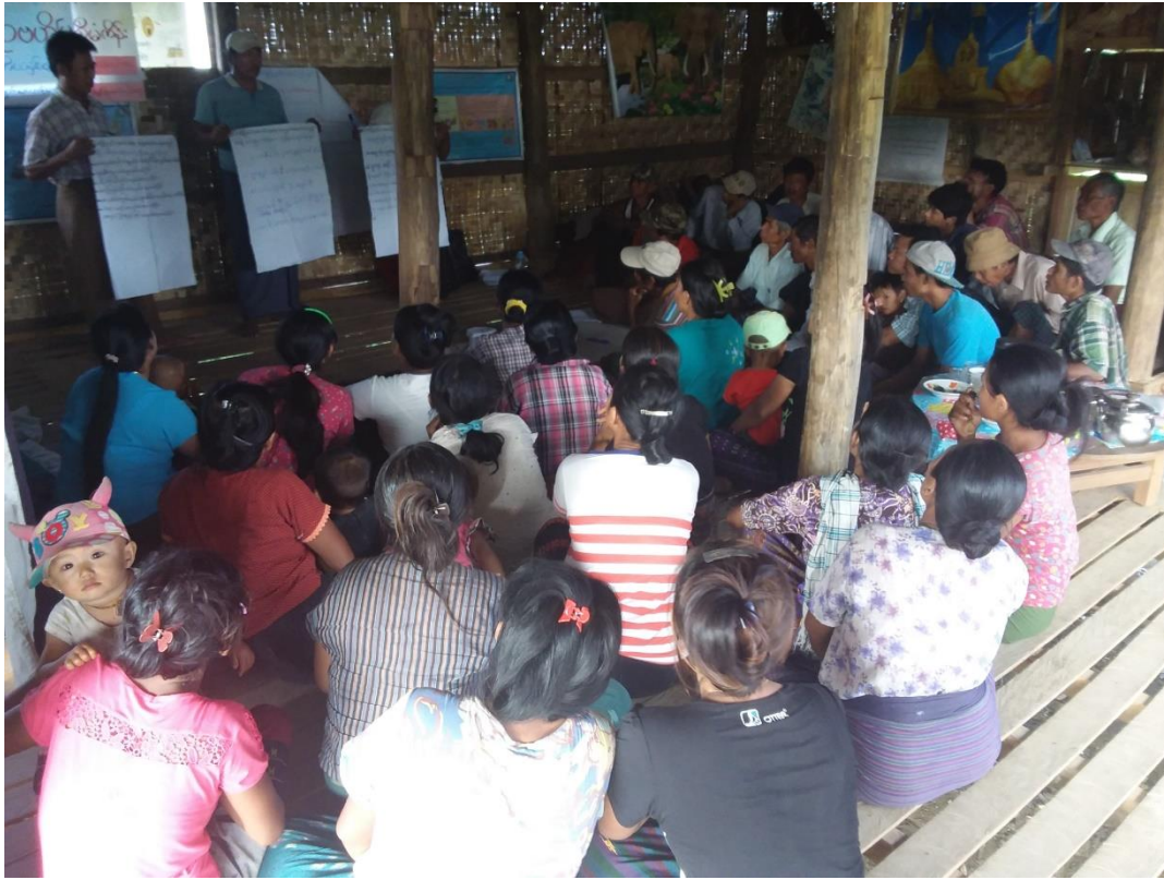
လူမှုဆန်းစစ်ခြင်းများကို အတူဆွေးနွေးခဲ့ကြ