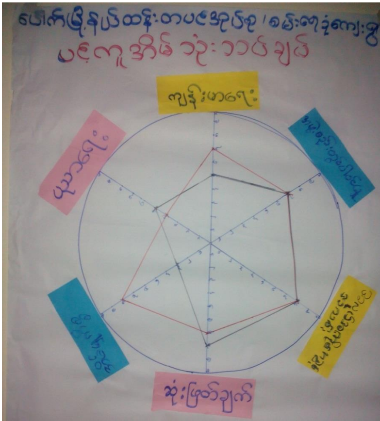
၁၅။ ပင်ကူအိမ်သုံးသပ်ချက် (ကျားမ)

ပင်ကူအိမ်ဆွေးနွေးခြင်း၊ နှင့် ဆန်းစစ်ခြင်း - အလုပ်အကိုင်အခွင့်အလမ်း အဖွဲ့အစည်း၊ အဖွဲ့အစည်း၊ ပါဝင်မှုညီ ညွတ်မှုရှိ - အိမ်မှုကိစ္စတွင်အမျိုးသ မီးများအားသာမှုရှိ - ပညာရေးနှင့်ဆုံးဖြတ်ချက် ရာတွင်အမျိုးသမီးများပါဝင်မှု အားနည်း - ကျန်းမာရေးတွင်အမျိုးသမီး များမှာအမျိုးသားများထက် အဖွဲ့ များ - ဆုံးဖြတ်မှုပုံစံ၊ ပညာသင်ကြားရေး - ကျန်းမာရေးတွင်အမျိုးသမီးများကို အမျိုးသားများထက် များစွာစောင့်ရှောက်ရန်