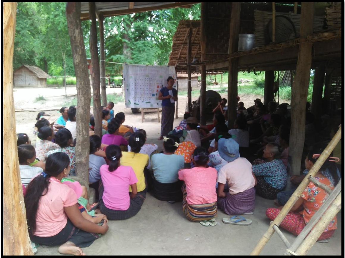
ပထမအကြိမ် ကျေးရွာအစည်းအဝေးဆောင်ရွက်မှုမှတ်တမ်း