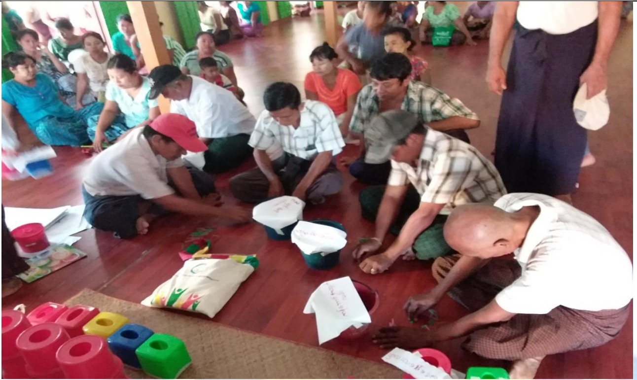
ကော်မတီရွေးချယ်ခြင်းမှတ်တမ်းခါတ်ပုံ