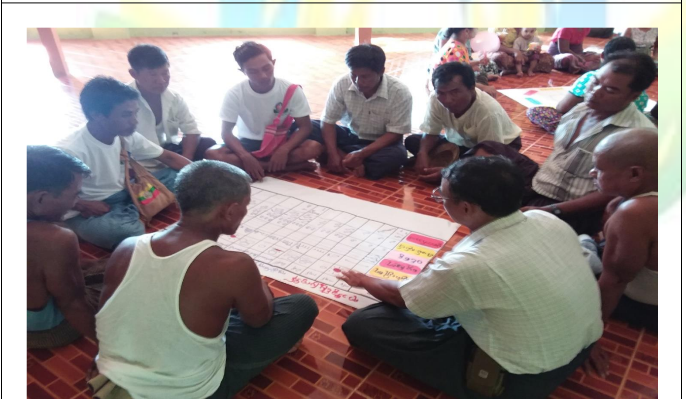
အမျိုးသားအုပ်စုမှတ်တမ်းတင်ခါတ်ပုံ။