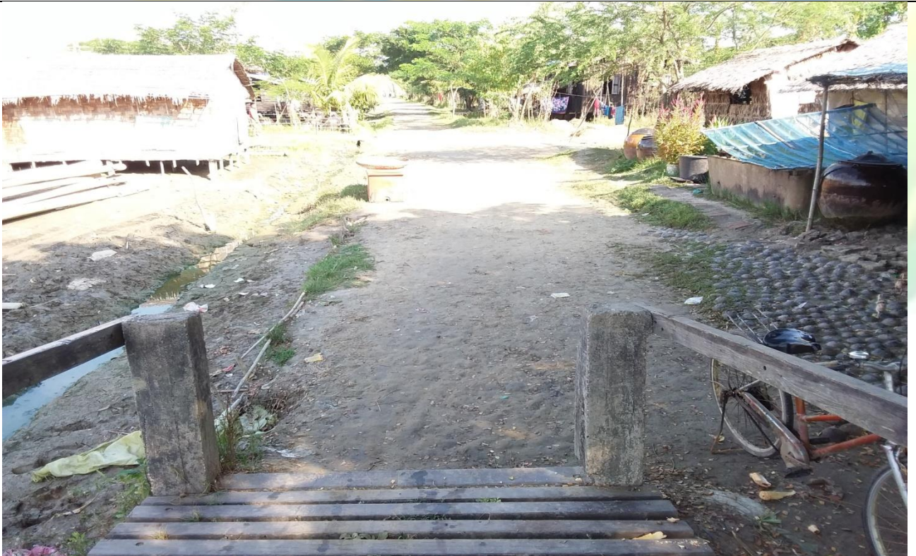
လှိုင်ငန်းရွဲ၏မပြုလုပ်မီမှတ်တမ်းဓာတ်ပုံ