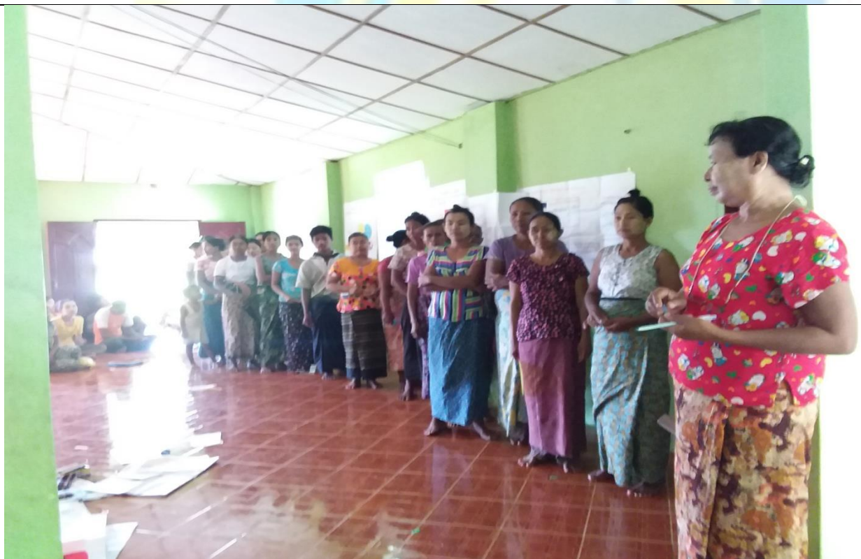
စေတနာ့ဝန်ထမ်းများရွေးချယ်ခြင်းမှတ်တမ်းခါတ်ပုံ