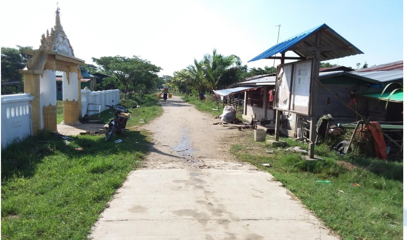
လှိုင်ငန်းရွဲ၏မပြုလုပ်မီမှတ်တမ်းဓာတ်ပုံ