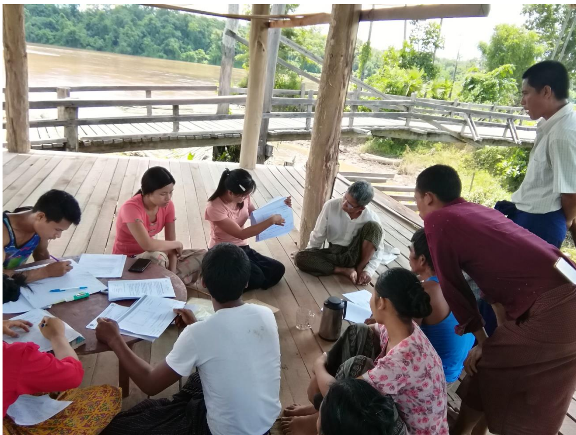
ရှမ်းပြည်နယ် (မြောက်ပိုင်း)