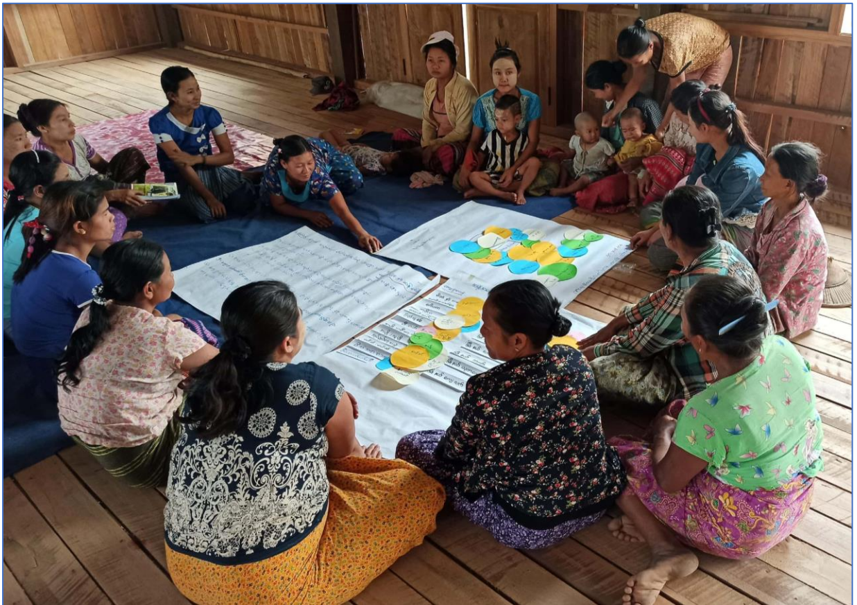
ရှမ်းပြည်နယ် (မြောက်ပိုင်း)