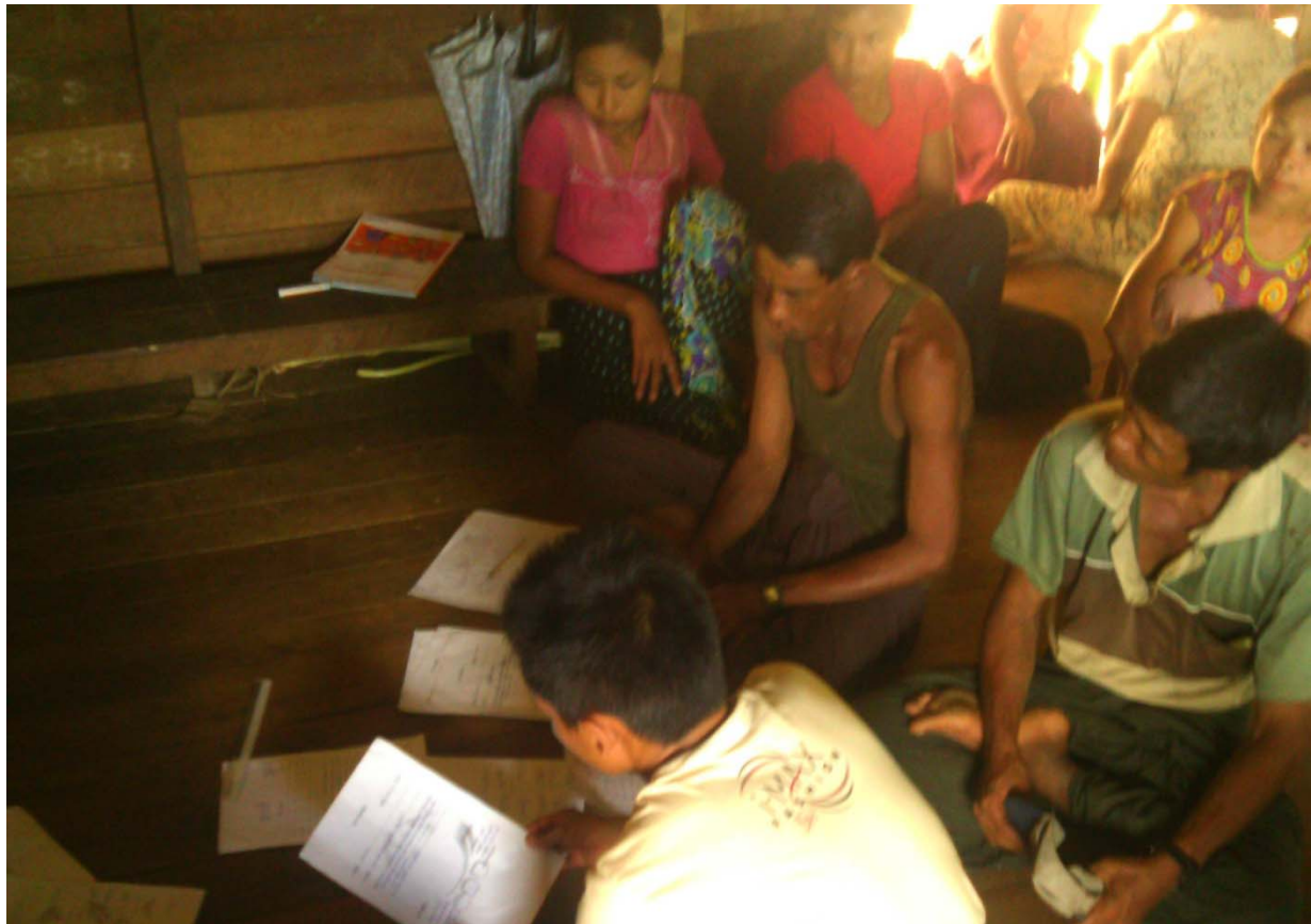
၂၀။ ကော်မတီဝင်များရွေးချယ်ခြင်းနှင့် ကျေးရွာဖွံ့ဖြိုးရေးအစီအစဉ်ဆောင်ရွက်မှုမှတ်တမ်းခါတ်ပုံများ