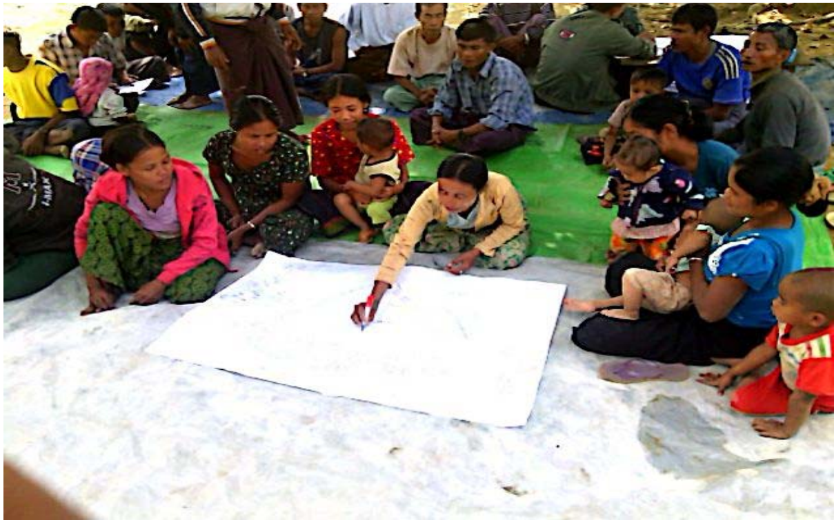
၂၀။ ကော်မတီဝင်များရွေးချယ်ခြင်းနှင့် ကျေးရွာဖွံ့ဖြိုးရေးအစီအစဉ်ဆောင်ရွက်မှုမှတ်တမ်းခါတ်ပုံများ